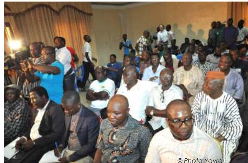
Les journalistes à la cérémonie

Par ailleurs, de tous les temps, lorsqu'il y a crise, c'est l'argent qui fait la loi et pousse certains acteurs à aller à l'encontre des intérêts du football. Le Colonel Akpovy doit veiller à ce que ces pratiques cessent. Et que cessent également les "un penalty pour le président". Autrement, lutter contre la corruption des arbitres sur les terrains.