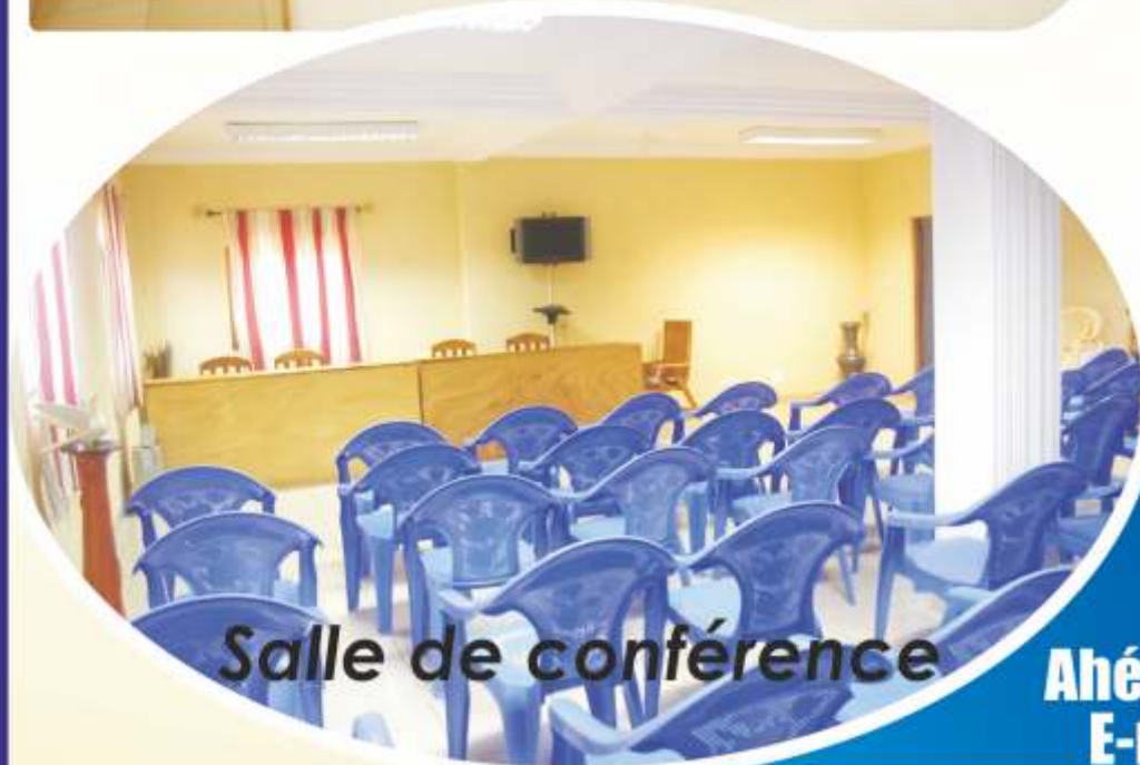
Salle de conférence