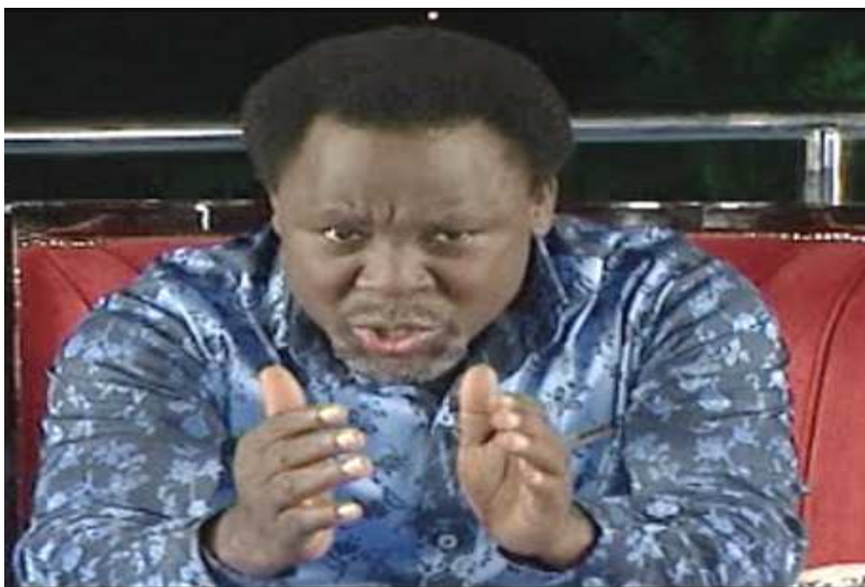
Le Prophète T.B. JOSHUA du SCOAN

L'offense emprisonne d'innombrables chrétiens, rompt les relations et élargit les brèches qui existent entre nous. À moins que nous nous en dégagions, Dieu ne nous entendra pas. Vous continuez à dire : "Au nom de Jésus",