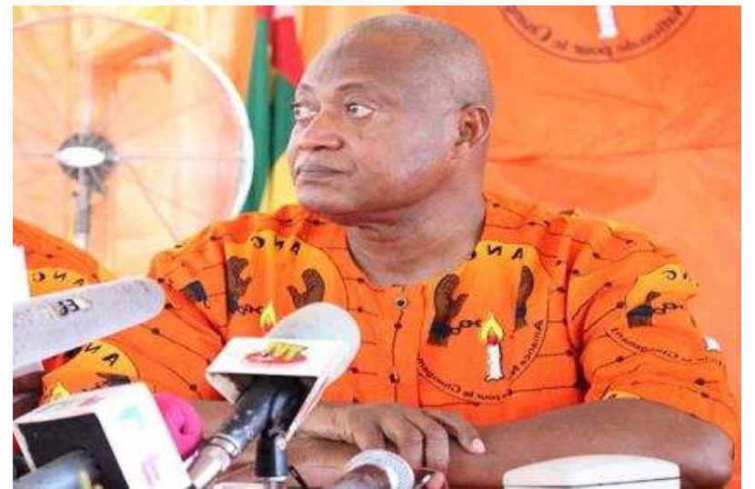
Jean-Pierre Fabre, président de l'ANC et chef de file de l'opposition

L'homme continue de dire que le ministre refuse de lui faire parvenir ce document et y voit une volonté du pouvoir à imposer les choses au moment venu. " S'il rechigne à don-