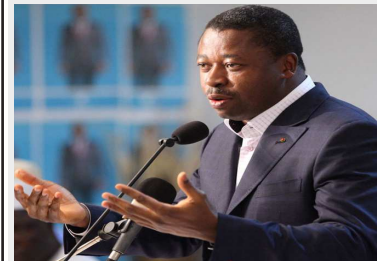
Faure au secours du peuple bissau-guinéen

Le Président bissau-guinéen, Jose Mario Vaz, de retour d'Accra au Ghana où il a pris part à la commémoration des 59 ans d'indépendance de ce pays, a passé quelques heures à Lomé ce mercredi.