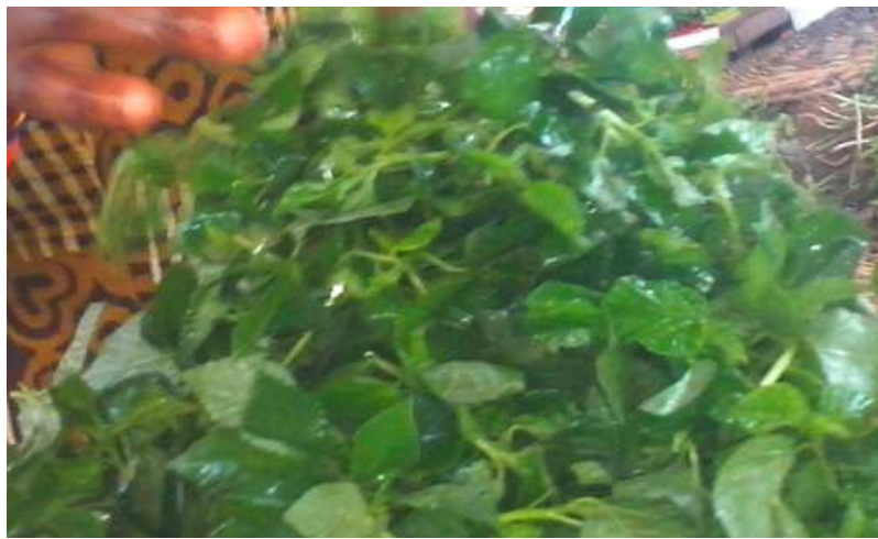
Adémé en hausse de 59,5 9%

Parmi les produits qui ont enregistré une hausse, on peut citer : "Charbon de bois" (+34,8%) ; "Maïs séché en grains crus vendu au grand bol" (+14,9%) ; "Adémé" (+59,5%) ; "Ignose" (+24,7%) ;