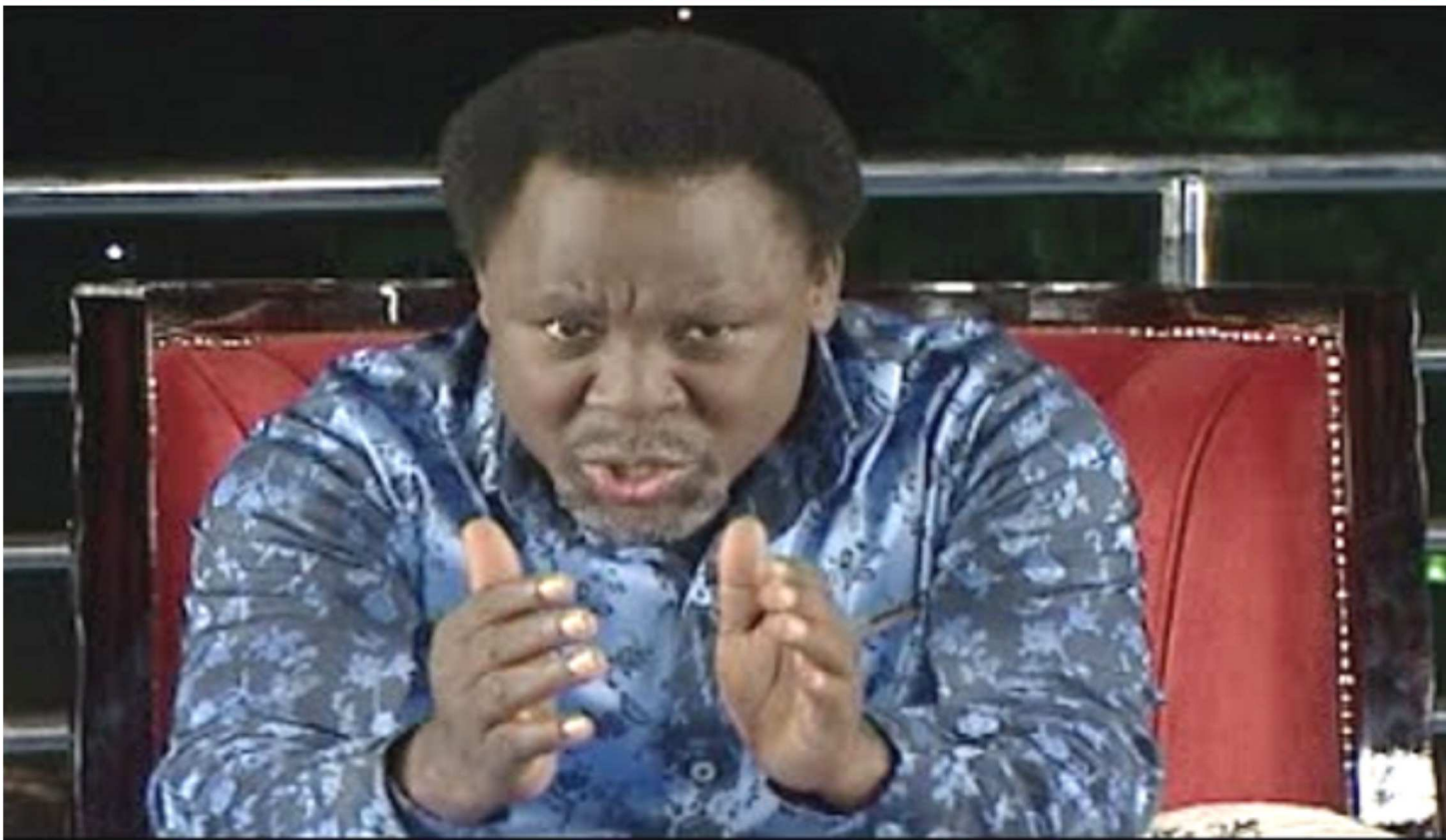
Le Prophète T.B. JOSHUA du SCOAN