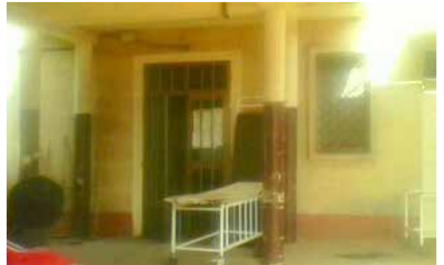
L'entrée du service de la réanimation