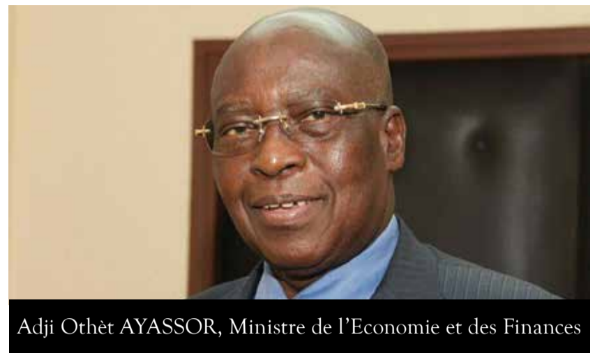
Adjil Othèl AYASSOR, Ministre de l'Economie et des Finances

La vision et les priorités de développement de la SCAPE indique qu'à long terme, l'ambition politique affirmée est d'amener le Togo à rejoindre d'ici 15 à 20 ans le peloton des pays émergents. Aussi, la politique économique du Gouvernement à moyen terme, sur la période 2013-2017, s'emploiera-t-elle pour l'essentiel à jeter et consolider les bases pour l'émergence future du Togo. Pour cela, elle devra s'orienter vers de nouvelles priorités que sont : (i) accélération de la croissance ; (ii) emploi et inclusion ; (iii) renforcement de la gouvernance ; et (iv) réduction des disparités régionales et promotion du développement à la base.