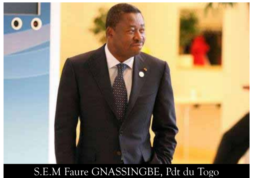
S.E.M Faure GNASSINGBE, Pdt du Togo

Pour la couverture santé, un partenariat a été signé le 22 mars 2016 entre le Ministère de la santé et celui du Développement à la Base. Il permet aux bénéficiaires de crédits de se faire soigner gratuitement dans les centres de santé. La prise en charge médicale