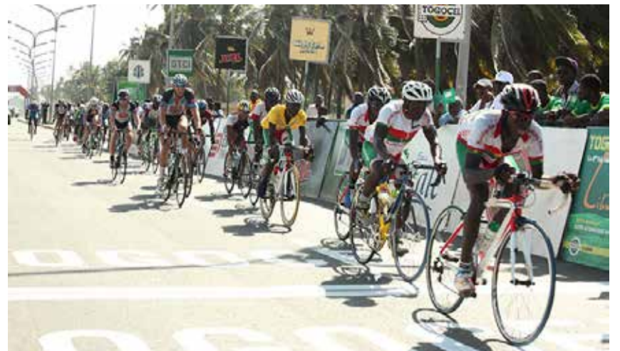
Des cyclistes sur une étape du tour du Togo