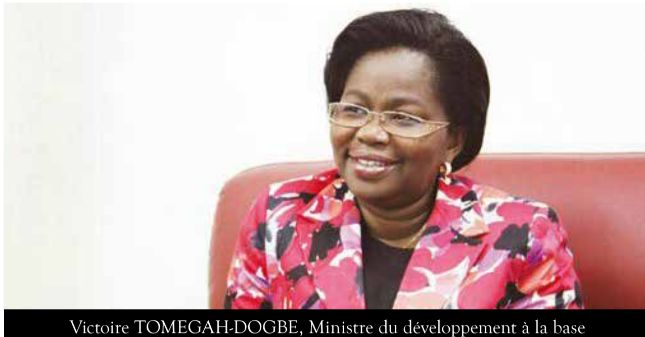
Victoire TOMEGA-DOGBE, Ministre du développement à la base

Dans cette perspective, l'Etat togolais a mis à disposition du programme 3 milliards de FCFA pour l'année 2013. De plus, le programme dispose de l'appui technique et financier de différents partenaires, notamment du Programme des Nations Unies pour le Développement (PNUD) - à hauteur de 212 850 dollars en 2013 - et de France Volontaires.