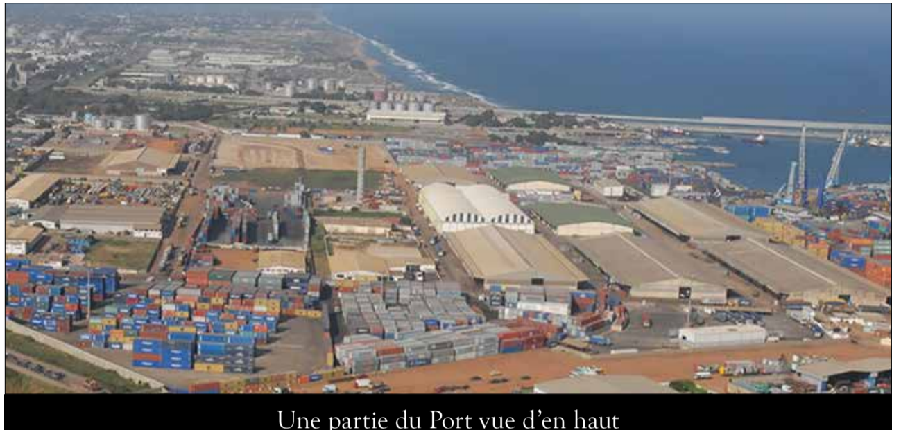
Une partie du Port vue d'en haut

rations douanières du Golfe, M. Agoro MEDJESSIRIBI, a ouvert la voie au dépôt le 28 juin 2014 des instruments de ratification de ladite convention, affichant ainsi l'engagement irrévocable du Togo, à la facilitation du commerce international. « Le Togo a également ratifié en Octobre 2015, l'Accord sur la Facilitation des Echanges (AFE) dont l'objectif est la facilitation du commerce » a précisé le directeur. L'opération de dépotage à domicile participerait en réalité à la facilitation des échanges en même temps qu'elle vise le décongestionnement du port. C'est donc dans cette vision et dans un souci de compétitivité pour mieux servir les opérateurs économiques que « les autorités portuaires de Lomé et celles de l'OTR ont institué un système de travail 24/24, 7j/7 », destiné à ré-