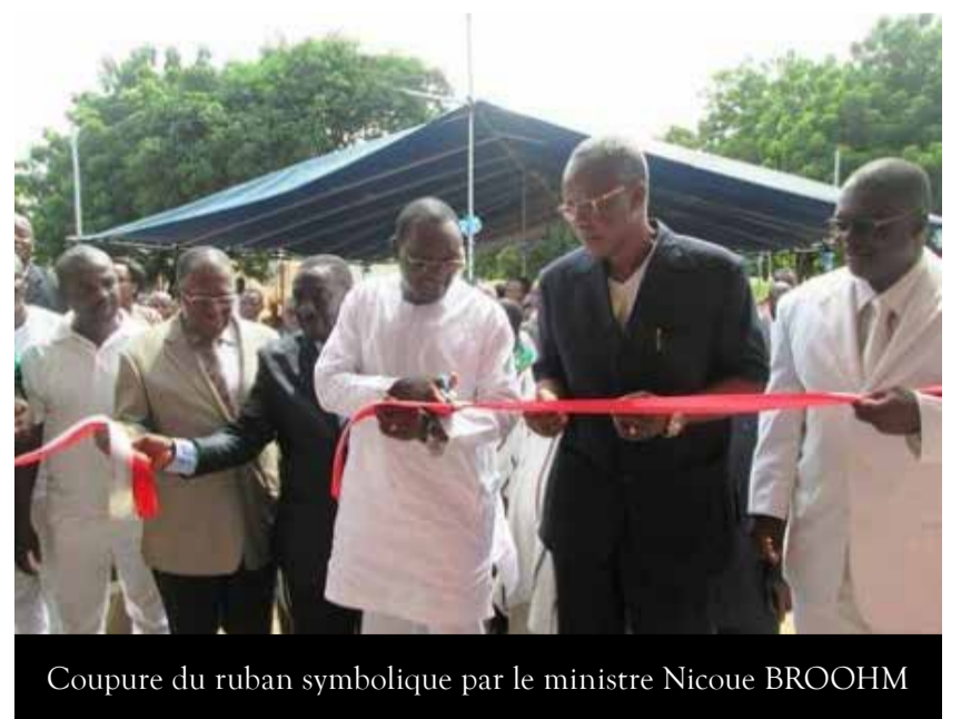
Coupure du ruban symbolique par le ministre Nicoué BROOHM

La MUTO a vu le jour en juillet 1990 suite à une Assemblée générale constitutive le 2 mai 1990 et