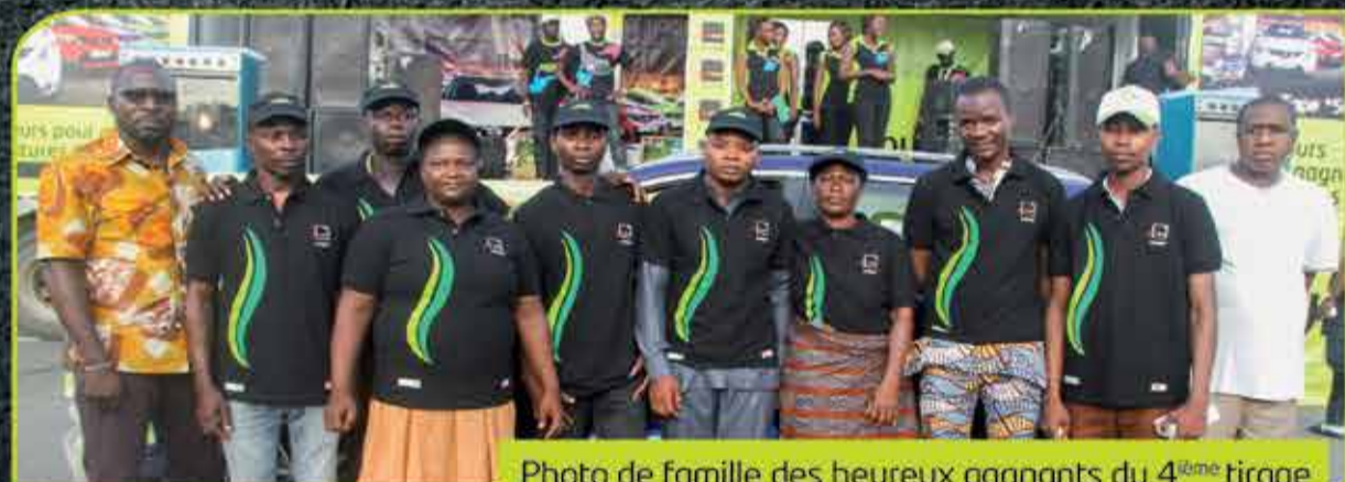
Photo de famille des heureux gagnants du 4 ème tirage