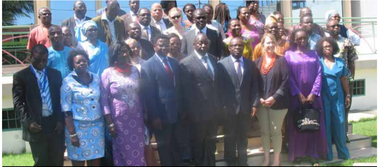
Photo de famille de la délégation

golaises qui ont inscrit dans le budget de l'année en cours 100 millions pour l'achat de contraception.