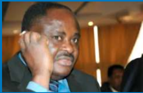
L'ex Ministre Pitang Tchalla, désormais à la HAAC

Haute Autorité de l'Audio Visuel et de la Communication