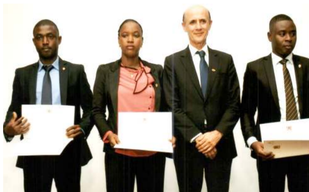
Photo de famille, aux deux extrémités les togolais récipiendaires