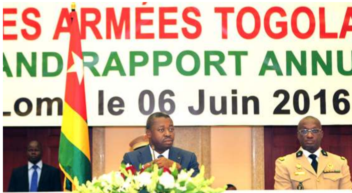
Le Chef de l'Etat Faure Gnassingbé au milieu et le CEMG

Les différents corps constituant les Forces Armées Togolaises (FAT) ont pris part lundi à Lomé, à une rencontre consacrée à la présentation de leur rapport annuel au Chef des armées, le Président de la République, Faure Essozimna Gnassingbé. Un an durant, comment ces corps habillés ont-ils accompli leurs missions et avec quels moyens ? Comment ont-ils perçu l'engagement du chef de l'Etat dans la conduite des affaires du pays ? Tout est dressé en un document soumis à l'appréciation du Chef de l'Etat.