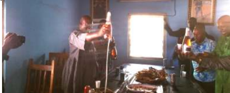
Collation au siège de la NJSPF

c'est beaucoup, mais ce n'est pas suffisant ».