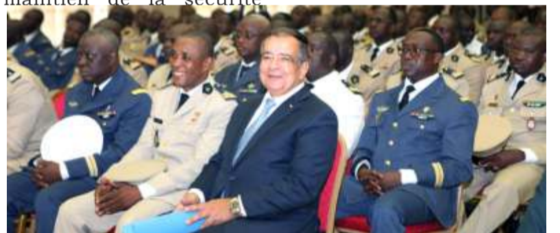
Une vue des officiers supérieurs des FAT

En décidant de placer le Togo sur la voie de l'émergence, vous avez lancé une politique de grands travaux. Aujourd'hui, notre pays est en plein chantier. Les infrastructures aéroportuaires, portuaires, routières comme le témoignent les différents axes et les échangeurs, ne cessent de changer le visage du Togo. Le récent lancement des travaux d'assainissement de la capitale et l'électrification à grande échelle de nos villes y participent également. Tout ceci ne serait possible sans la paix et la sécurité,