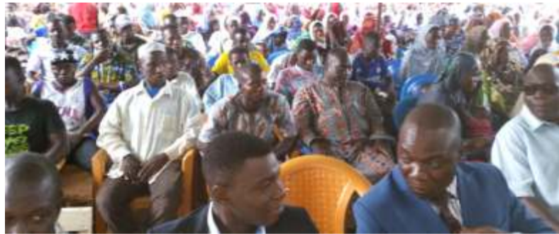
Quelques fidèles musulmans de la mosquée de Vakpossito