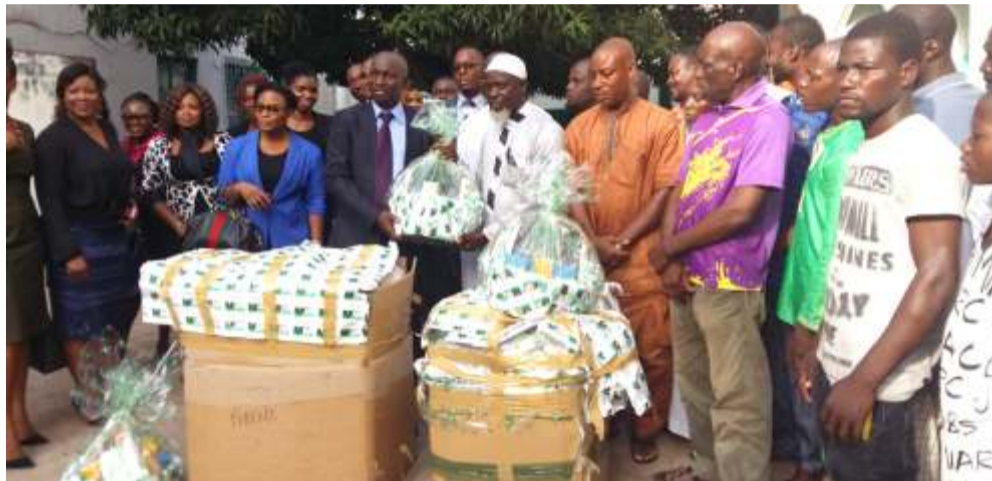
Les représentants de la BOA et ceux de la Grande Mosquée de Lomé

La Bank Of Africa(BOA) a fait un don ce lundi 6 juin 2016 à la mosquée centrale de Lomé. Ceci, dans le but d'aider les musulmans qui ont débuté le jeûne le même jour.