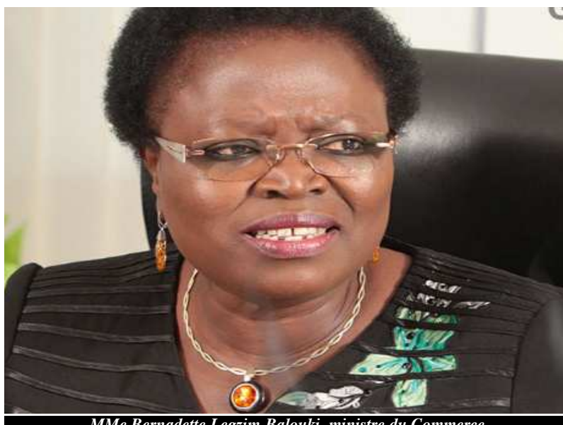
Mme Bernadette Legzim-Balouki, ministre du Commerce

Même si les bars venaient à respecter les prix des produits de la brasserie fixés par les