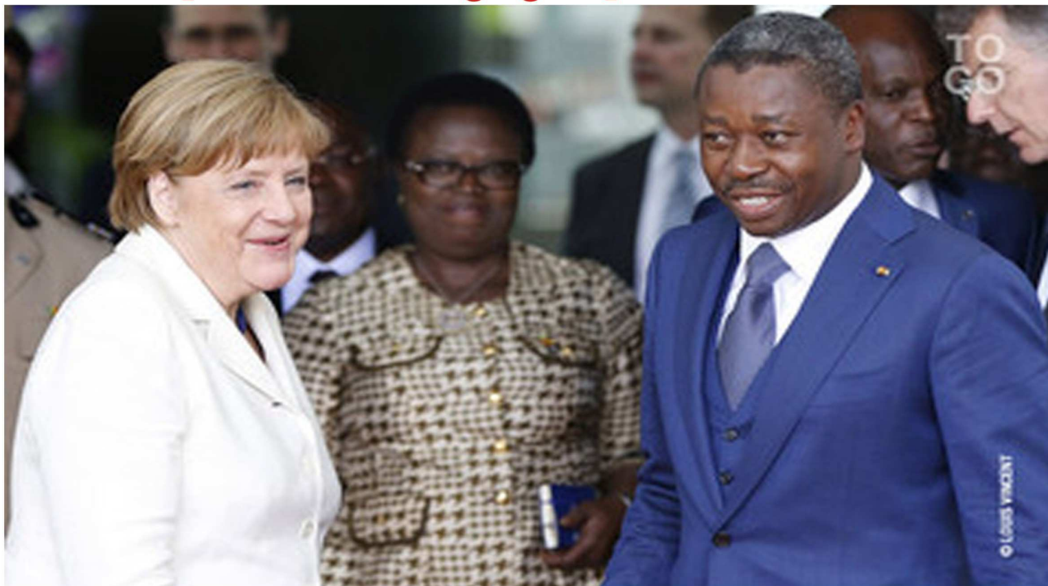
Le Président Faure Gnassingbé (dt) et la Chancelière allemande, Angela Merkel (g)

Angela Merkel : "Le Togo est sur la voie du progrès, les résultats sont très encourageants et l'Allemagne est disposée à s'engager pour sa réussite" P.4