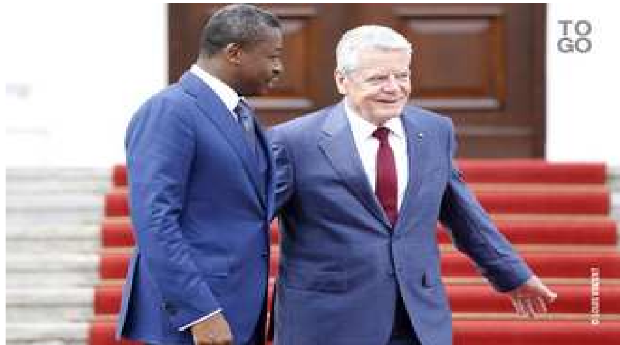
Les Présidents Faure Gnassingbé (g) et Joachim Gauck (dt)

Aussi faut-il reconnaître que, le président Faure Gnassingbé a rencontré la chancelière Allemande Angela Merkel. Lors d'une entrevue entre Faure et Angela, la chancelière