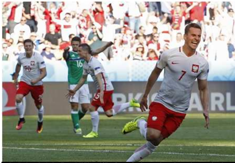
Le Polonais Arkadiusz Milik a délivré son équipe en inscrivant le premier but

Il faut attendre la 26e minute pour voir la première offensive des Verts : un long centre pour Kyle Lafferty, bien capté par Wojciech Szczesny, le gardien polonais. Son homologue irlandais n'est pas aussi sûr et doit s'y