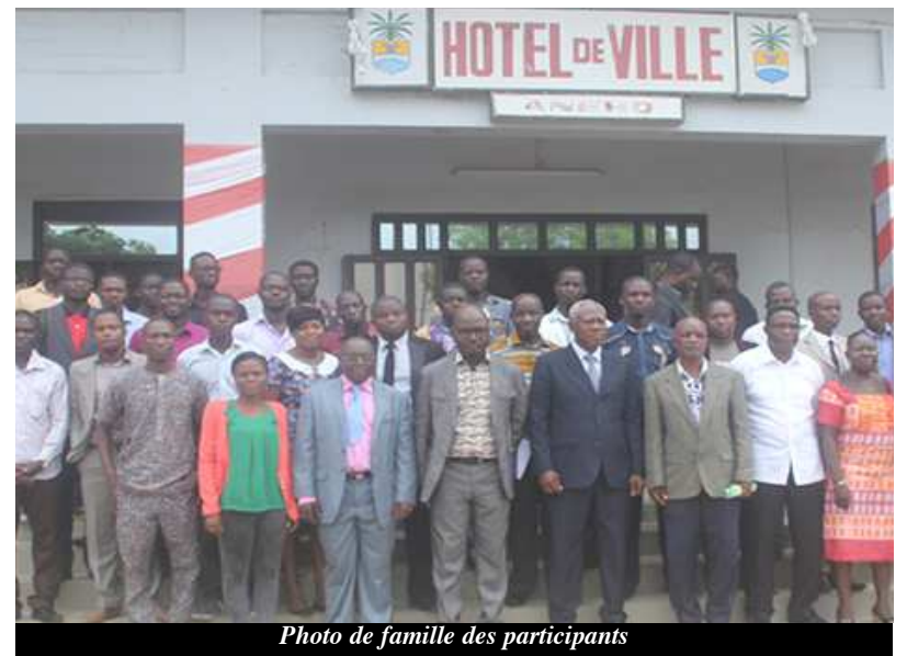
Photo de famille des participants

Démarrée depuis le 07 juin dernier à l'hôtel de ville, cette formation de cinq jours a connu son apothéose le samedi 11 juin dernier. Des thématiques comme la gestion durable des terres et risques et catastrophes, la prévention, le système d'alerte précoce ont été développés par d'éminents communicateurs