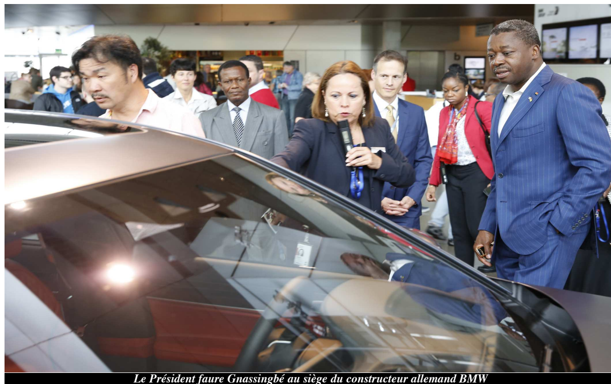
Le Président Faure Gnassingbé au siège du constructeur allemand BMW

de nombreux migrants venus principalement de Syrie, mais le flux est constant, notamment en provenance d'Afrique.