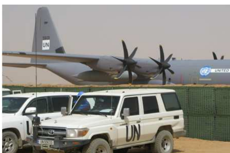
Des véhicules de la Minusma sécurisent l'aéroport de Kidal, dans le nord du Mali.

" Faux ", répond un autre groupe armé du nom de Ganda Iso. " Nos combattants étaient en mission de sensibilisation dans la zone, dans le cadre du désarmement, lorsqu'ils sont tombés dans une embuscade tendue par le