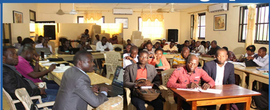
Les participants lors de la formation