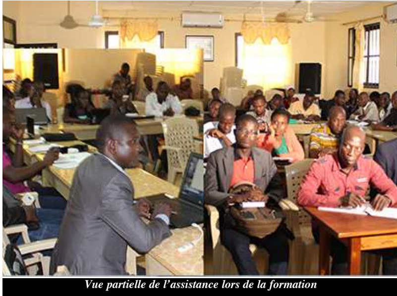
Vue partielle de l'assistance lors de la formation

De nos jours, les changements climatiques constituent des enjeux majeurs qui déstabilisent la quiétude des populations. Face aux effets néfastes que ses changements climatiques engendrent, les médias sont appelés à y apporter leur contribution dans le traitement de l'information en matière environnementale et ceci dans un contexte de décentralisation. C'est dans cette perspective que la ville d'Aného qui fait partie des zones les plus vulnérables au Togo a servi de cadre à une formation à laquelle a pris part une trentaine de journalistes de la presse écrite et de télévisions.