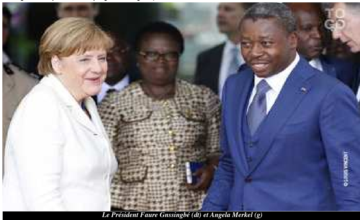
Le Président Faure Gnassingbé (dt) et Angela Merkel (g)

dans les bureaux de leur institution à Berlin.