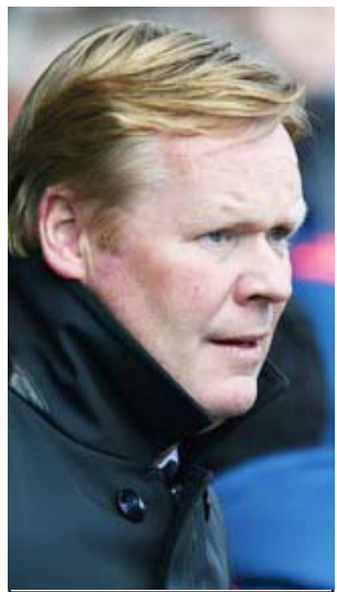
Ronald Koeman à Everton pour trois ans.

Agé de 53 ans, Koeman, ancien joueur de l'Ajax Amsterdam et du FC Barcelone, 78 fois international avec