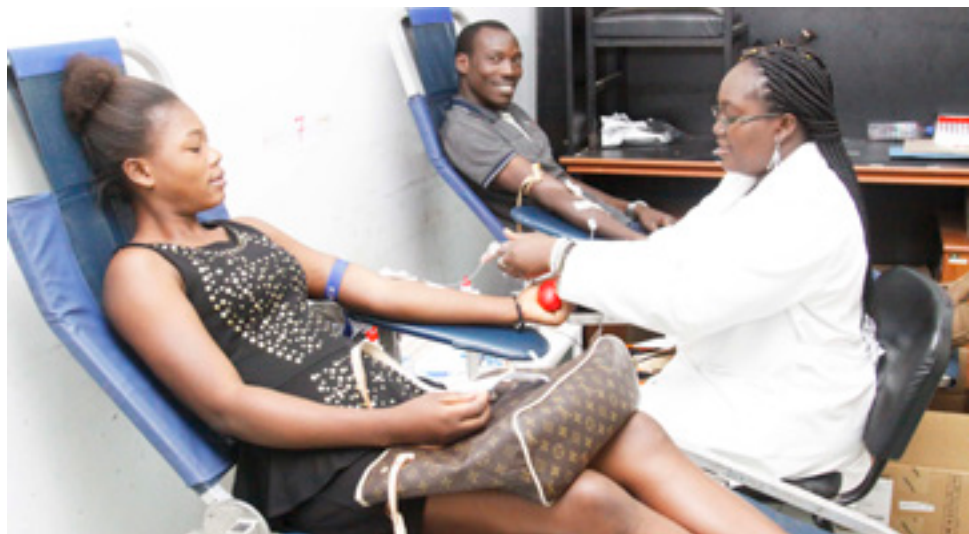
Une séance de prise de sang au CNTS.