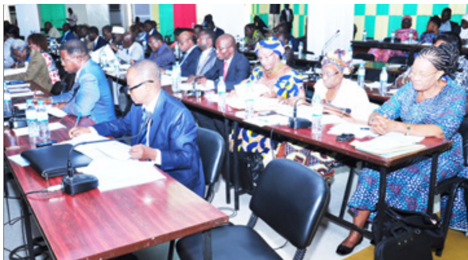
Les députés lors des travaux..

de la protection prévue par la législation nationale et internationale.