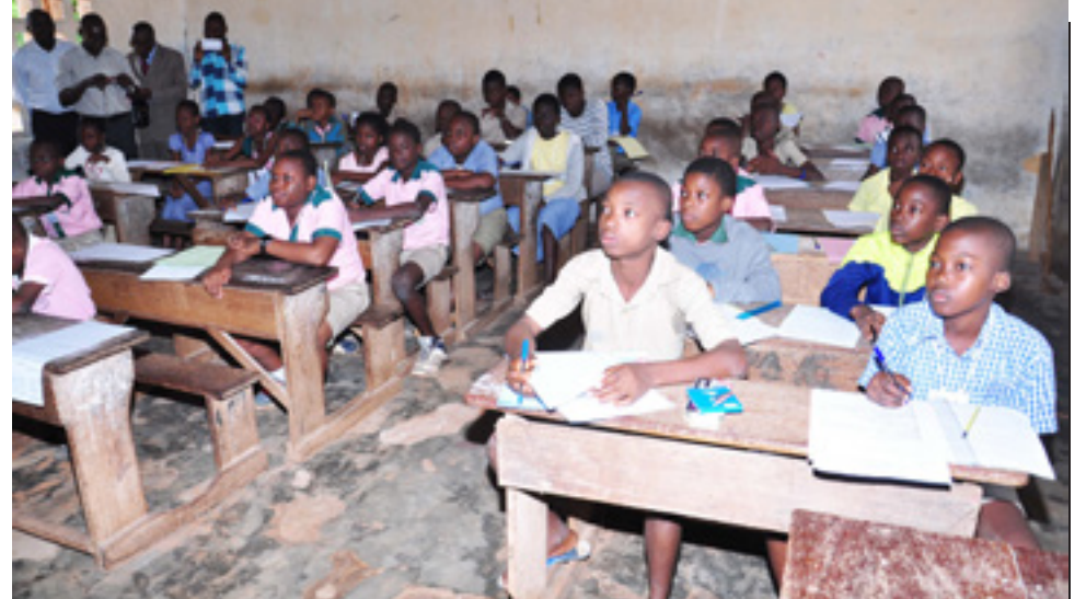
Des candidats en composition.

total, 199751 candidats, dont 96113 filles sont engagés dans la course pour l'obtention du tout premier diplôme qui ouvre les portes du secondaire. On note une augmentation du nombre de candidats de 9,51 % par rapport à 2015 avec une tendance à la parité entre celui des garçons et celui des filles, soit 48,12 %. Le ministre des