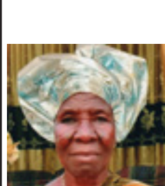
Ménagère à Soumbou (préfecture de la Kozah) Rappelée à Dieu le 27 mai 2016 dans sa 91 e année.