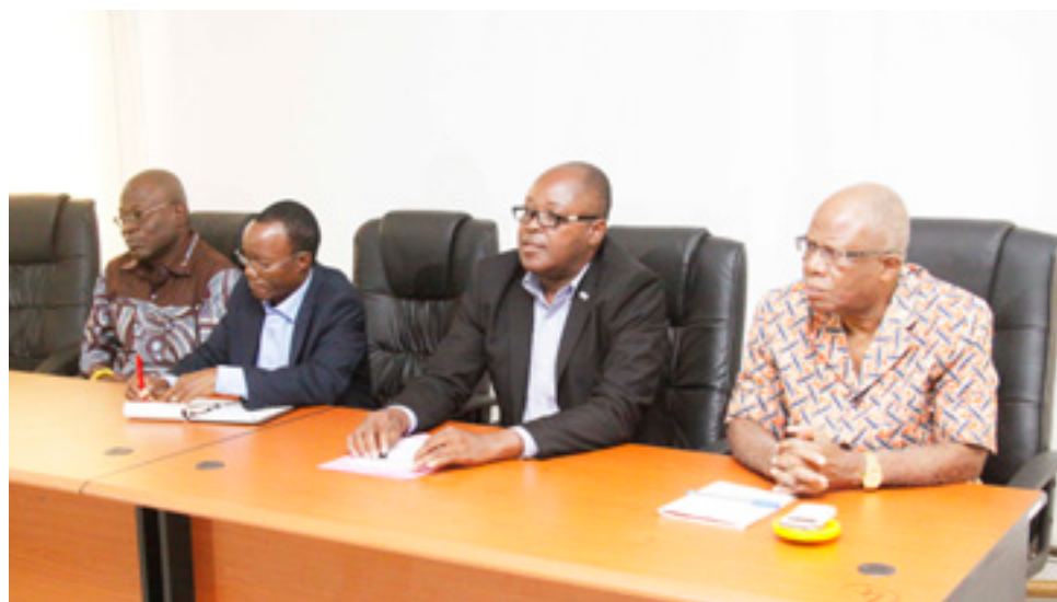
La table d'honneur lors de la conférence de presse.

composant du sang chez un malade ou un blessé. Malheureusement, expliquent-ils, ce liquide précieux est en manque, malgré les campagnes de collecte dans les centres de Lomé et de Sokodé. « Pour une population de plus de 6 millions d'habitants, il faut un besoin de 60 000 poches, malheureusement, les deux centres, pour l'année 2015, n'ont produit que 44 000 poches, donc, il y a un manque de 16 000 poches. C'est ce qui fait que nous couvrons les besoins autour de 70 % », ont-ils déclaré. Pour eux, toute personne âgée de 18 à 60 ans, jouissant d'une bonne santé, peut donner de son sang sur un intervalle minimal de deux mois pour les hommes et de trois mois pour les