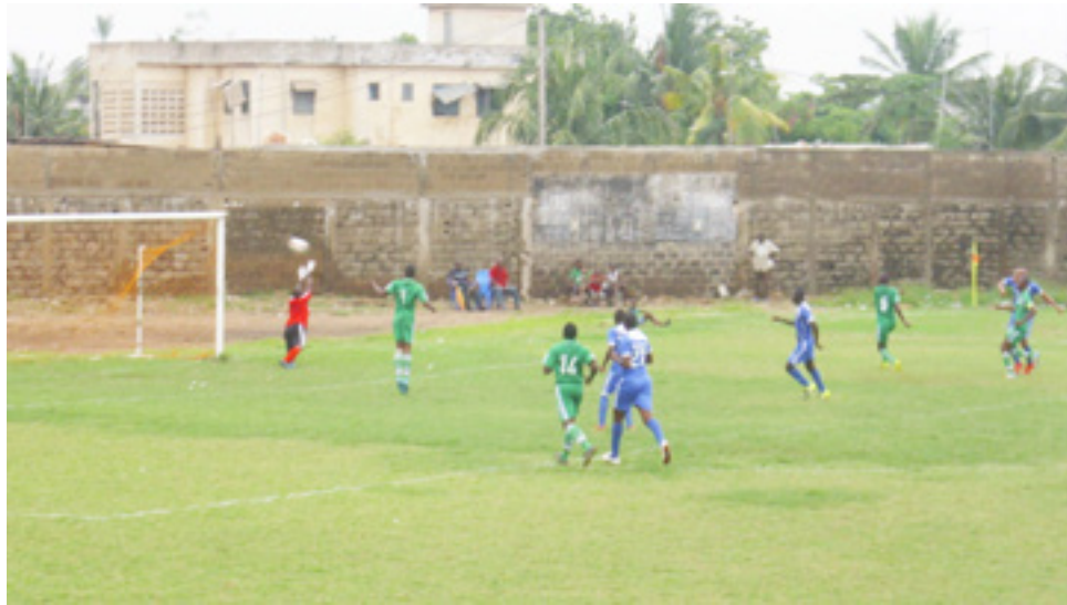
Une frappe de l'attaque de l'UTB déviée en corner par le goal de Diamond Bank.

a profité d'une bourde du goal de Diamond Bank pour propulser le cuir au