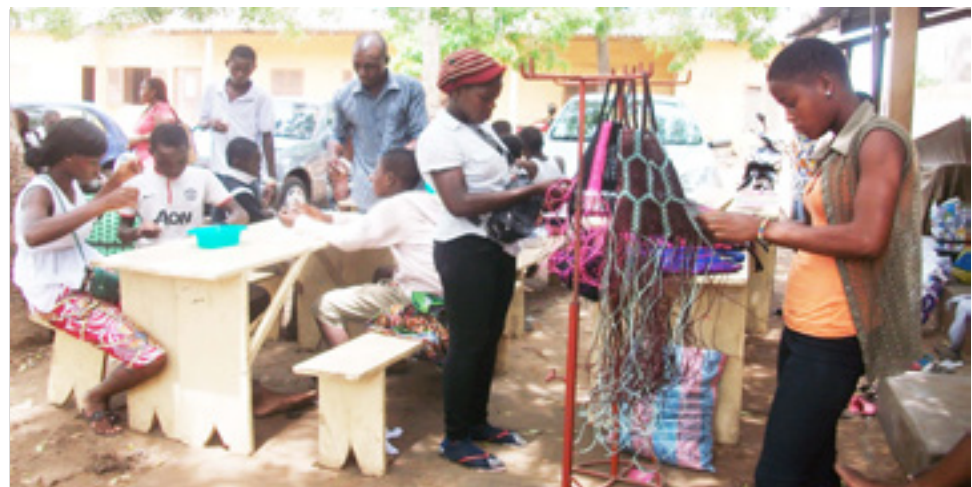
Tuma ane pḡmḡnaa se piya ela ne pḡsḡsi-si

Ḍḗo 2005 punay taa «Tdh» ḡgbeye pazḡ labu tuma ḍe-ejaḍe taa se pḡsun piya ne siwee si-wala taa. Ḍeḍe wayi pḡtaliv Mḡḡum evemiye 12 yḗḗ tḗzuv yḗḗ, Loma taa ḡgbeye ndi ḍi-taa ḡḡna kḗyḗli samay ne pḗyḗḗḗḗ-ke