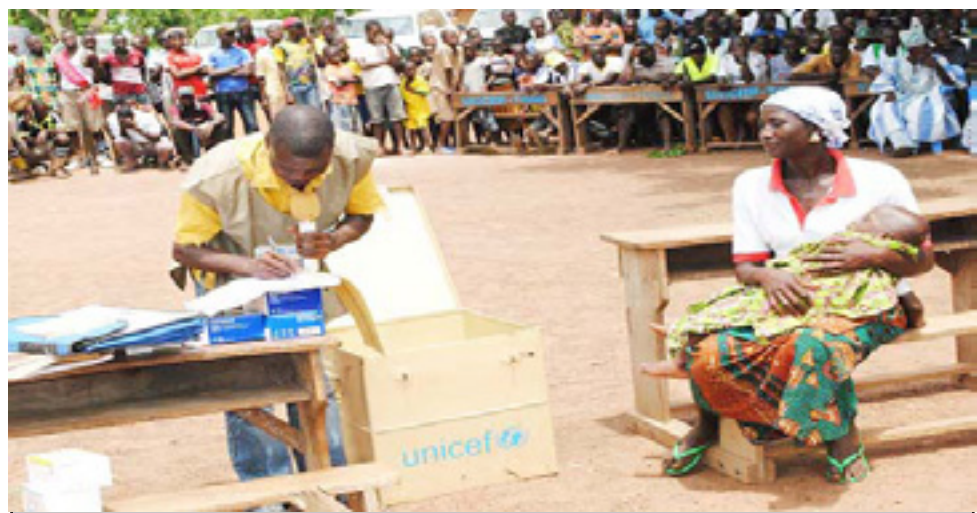
Nutome lāmesē gbḗkpḗla aḍe le alesi woxḗa ḍḗwḗwo ḍem fia

wodzi yeye la ta kpḗkpḗ me. Le tefe siwo didi tso ḍḗyḗfewo gbḗ abe