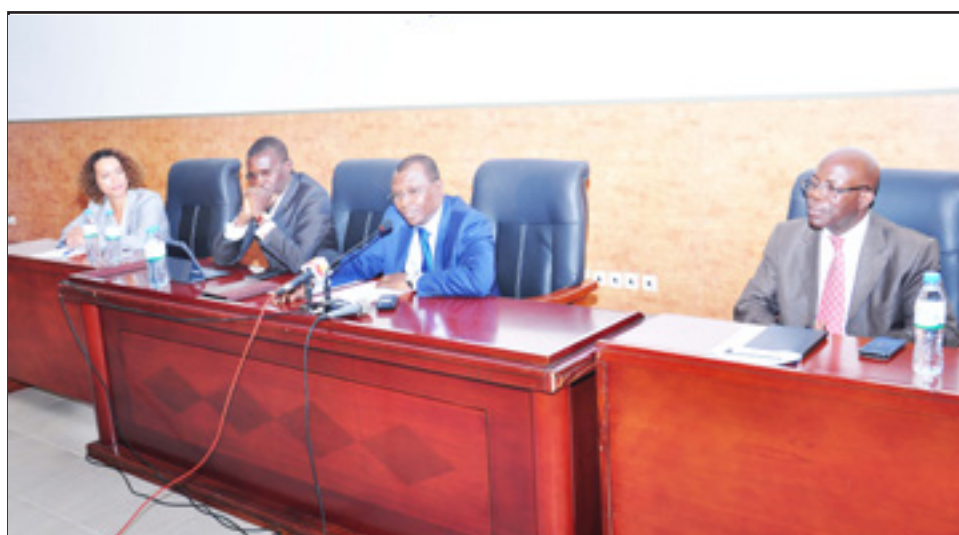
A l'ouverture du séminaire, on reconnaît le ministre Yaya (3 e de la droite) (Photo TOUVOR).

d'un pays. Cependant, au Togo, elles sont perçues comme moins compétitives et moins efficaces que le sec-