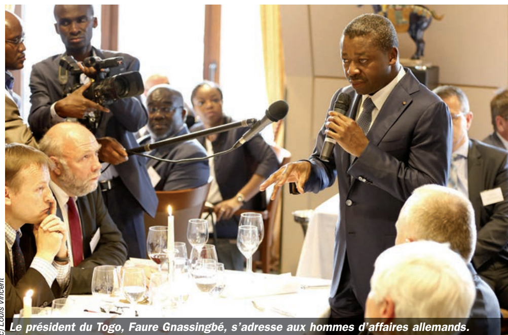
Le président du Togo, Faure Gnassingbé, s'adresse aux hommes d'affaires allemands.