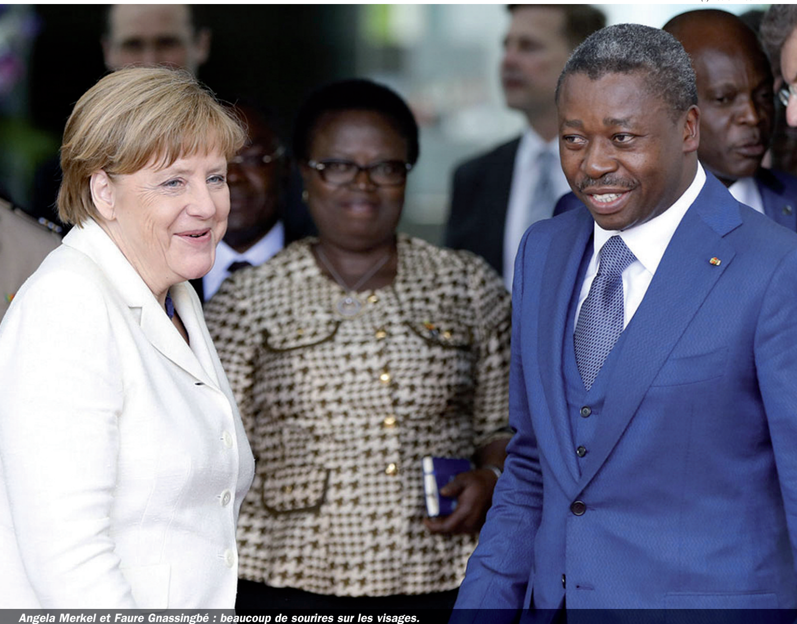
Angela Merkel et Faure Gnassingbé : beaucoup de sourires sur les visages.