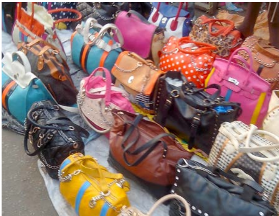
Des sacs en vente

A moyen terme et à long terme, un job de vacances permet de construire une expérience professionnelle pour un CV et un carnet d'adresse pour de futurs stages et/ou emplois. Un autre avantage sur le long terme, c'est l'immersion en entreprise qui fait découvrir le monde du travail et apprend aux jeunes à travailler en équipe, à respecter la hiérarchie et à s'investir dans l'accomplissement d'une tâche.