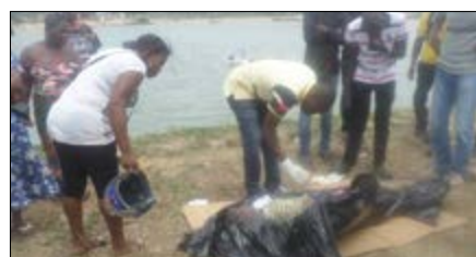
Le corps sans vie de la dame

environs de 10 heures. Repêché, le corps ne présentait pas de signes d'une personne noyée. D'après les propos des uns et des autres sur les lieux, tout porte à croire que le décès se serait intervenu un peu plus tôt. En attendant que Togomatine sache un peu