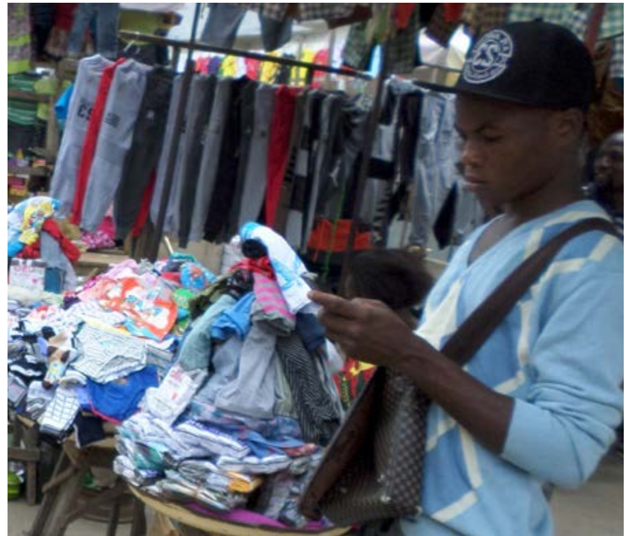
Vente de friperies au marché

Pour mettre toutes les chances de votre côté, il est important de bien le préparer en définissant vos besoins et vos attentes qui doivent être en cohérence avec ce que recherche le recruteur. Chacun devant trouver un intérêt commun à la réalisation de ce stage.