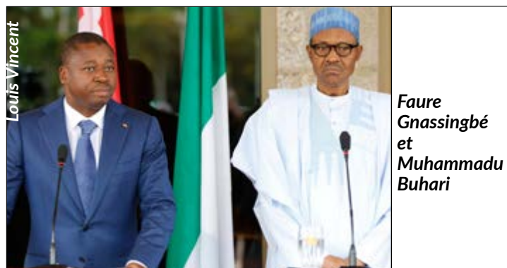
Faure Gnassingbé et Muhammadu Buhari

Breve, la visite du président de la République au Nigéria le mardi 02 août dernier était centrée sur des enjeux économiques, qui ont pris tacitement le pas sur l'évocation des affaires bilatérales entre le Togo et la République fédérale du Nigéria.