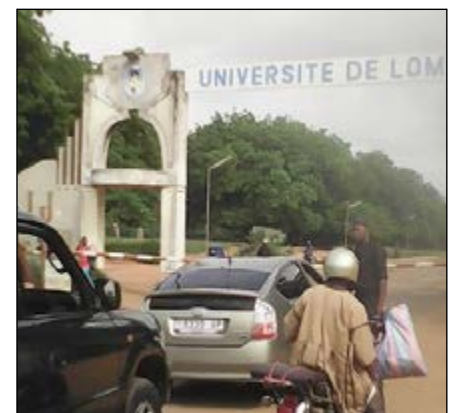
Entrée de l'Université de Lomé