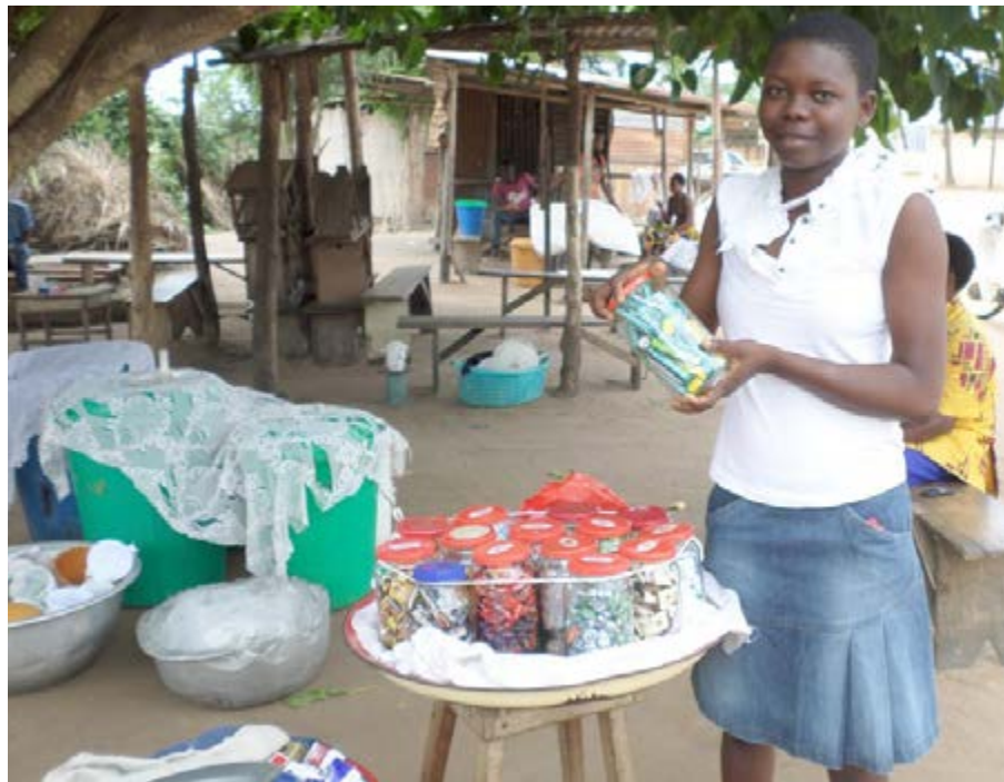
Une vacancière devenue commerçante

Serveurs / serveuses de bars, hôtesses d'accueil, guides touristiques, vendeurs d'accessoires divers... plusieurs centaines d'étudiants et élèves ne se plaignent pas, ils ne chôment pas pendant les vacances. Car les jobs d'été ne manquent pas. C'est le cas pour Lauren A., Etudiante en Tourisme au Village du Bénin à Lomé. Résolue à se relancer dans le même job que les vacances dernières – guide touristique pour un agence de Safari basée à Lomé – elle cache à peine, combien ce job lui a procuré à la fois rêve, passion, aventure, dépaysement et surtout beaucoup de rentrées d'argent.