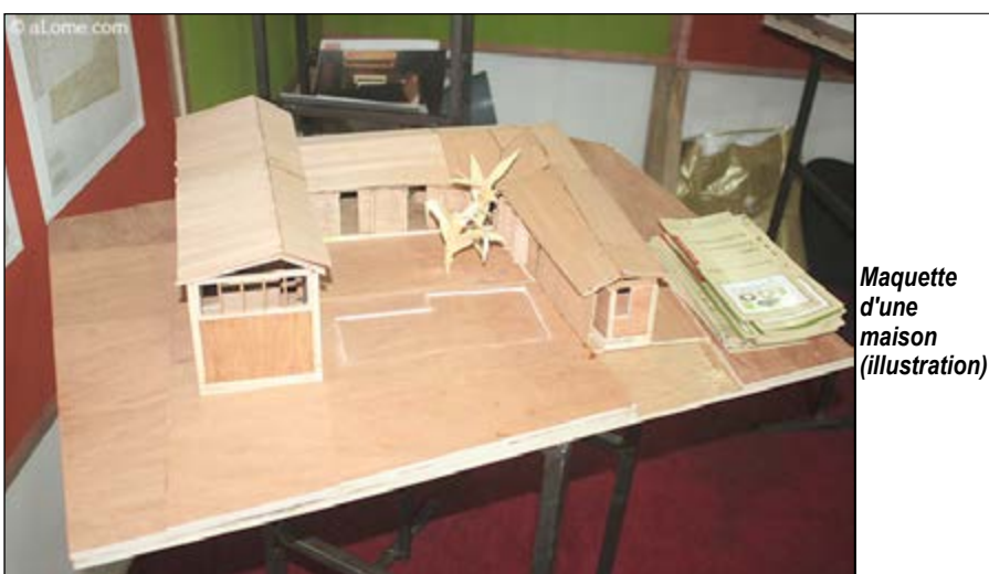
Maquette d'une maison (illustration)

La base de données « Sland Call » compte résoudre les problèmes de double vente de terrain très récurrent au Togo. Elle a été lancée la semaine dernière.