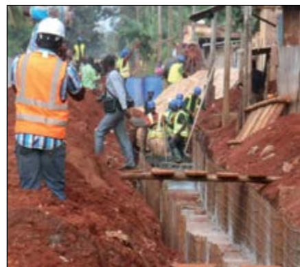
Un chantier du PGICT à Tsévié

La 6e mission d'appui de la Banque Mondiale à la mise en œuvre du Projet Gestion Intégrée des Catastrophes et des Terres (PGICT) a effectué le lundi dernier une visite sur le terrain afin de constater l'avancée des travaux.