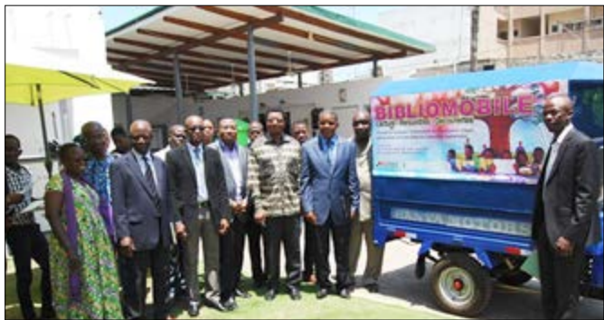
Lancement officiel de la Bibliomobile

Une bibliothèque mobile est désormais disponible à Lomé. Officiellement lancée ce jeudi 28 juillet 2016, la «Bibliomobile» est un projet de l'association Communication et Développement Intégral (CDI) qui a pour objectif de promouvoir le livre et de sensibiliser les populations à la lecture.