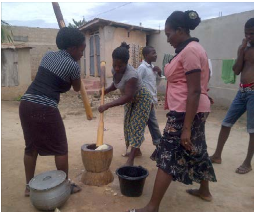
Que vous inspire cette photo?