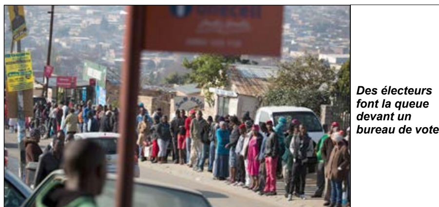
Des électeurs font la queue devant un bureau de vote

Le mercredi 3 août, ils étaient des milliers à se rendre aux urnes pour le scrutin municipal. Un véritable test pour Jacob Zuma et son parti l'ANC miné ces derniers temps par des scandales de corruption.