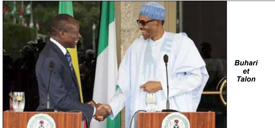
Buhari et Talon

Deuxième visite du président Talon au Nigéria mais la toute première du genre où le nouvel homme fort du Bénin rencontre enfin son homologue Buhari, le mardi 2 août 2016. Au menu des échanges, la chute du naira et ses conséquences sur les transactions entre les deux pays.