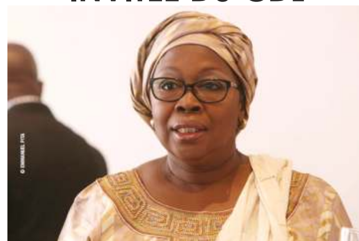
Khardiata Lo N'diaye

Khardiata Lo N'diaye, la représentante du PNUD au Togo et coordinatrice du Système des Nations Unies (SNU) sera la prochaine invitée du Club diplomatique de Lomé (CDL).