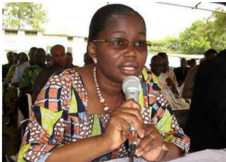
La Ministre Victoire Tomégah Dogbé

L'objectif de ces rencontres, selon les organisateurs, est de susciter une dynamique auprès des jeunes en vue d'accroître leur participation active à la protection de