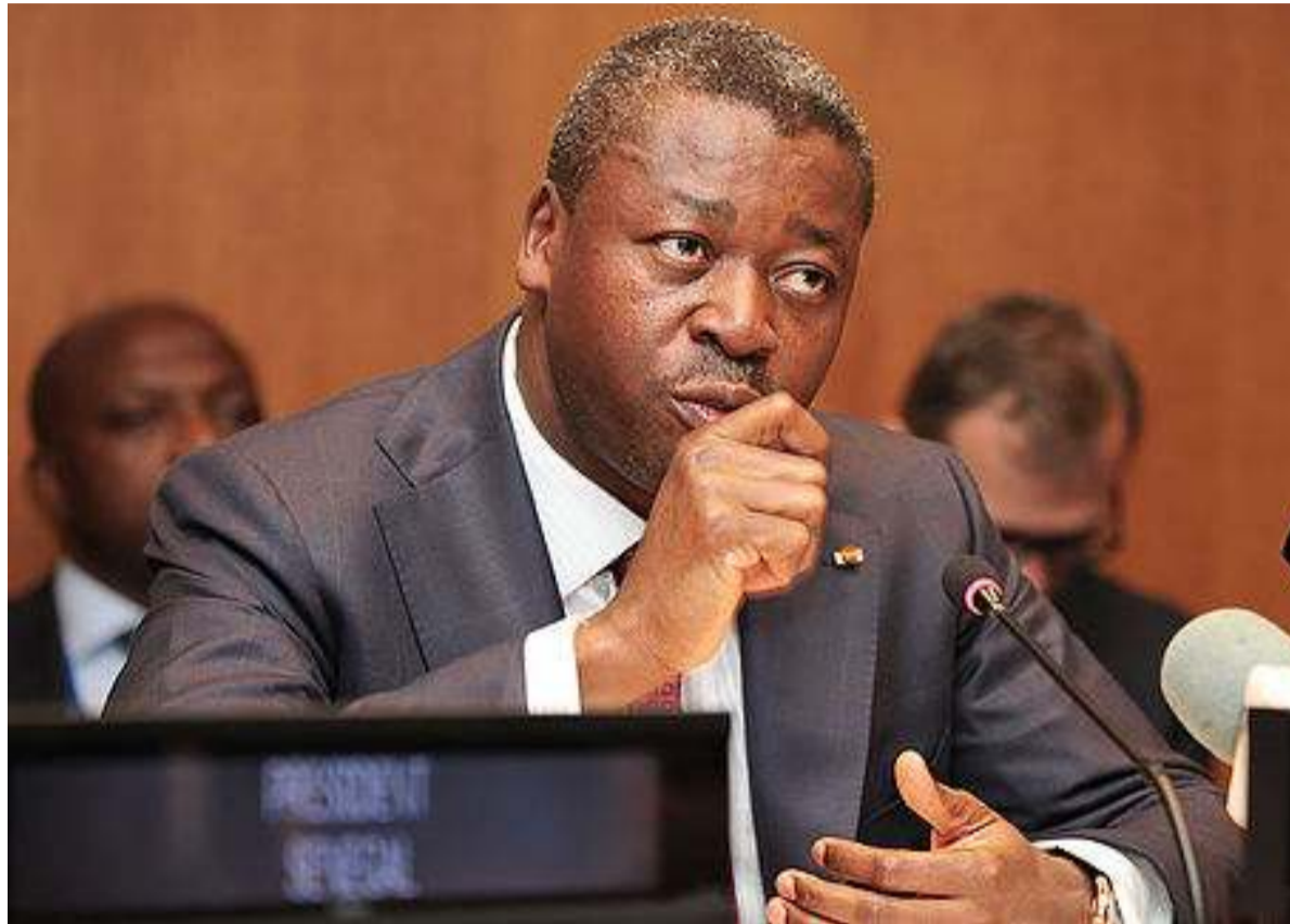
Le Président Faure Gnassingbé

Pour la réussite de l'événement, le Chef de l'Etat a souhaité l'implication de tous les acteurs aux préparatifs. Une grande rencontre à cet effet, a réuni d'éminentes personnalités, en l'occurrence le Premier ministre, Komi Selom Klassou, les membres du gouvernement, les acteurs du secteur maritime, les ambassadeurs des Etats partenaires du Togo pour l'Organisme National chargé de l'Action de l'Etat en Mer (ONAEM) et les diplomates. Cette réunion tenue au Palais de la Présidence, sous les auspices du Chef de l'Etat, a permis à tous ces acteurs de prendre connaissance