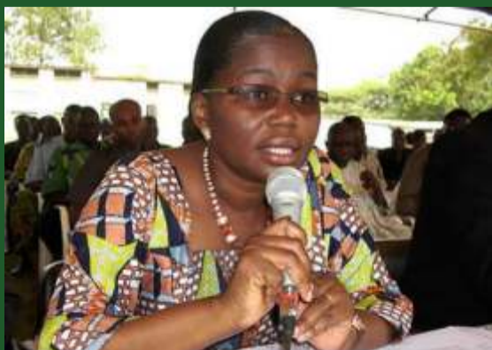
La Ministre Victoire Tomégah Dogbé

Participation des jeunes au développement