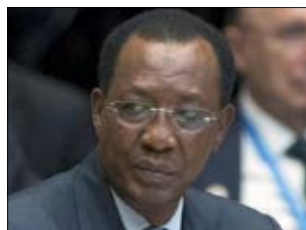
Idriss Déby Itno

Pour Jacob Enoh Eben, porte-parole de l'Union africaine, les tractations sont actuellement en cours sur la composition exacte de la délégation, qui sera appuyée par la CEEAC et les Nations unies, et aussi pour définir les contours exacts de cette mission. « Le président