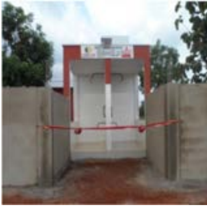
Un de ses forages à Tokpli

Et ce ne sont pas des produits DANGOTE, malgré le déroulement de leur rouleau compresseur qui feraient peur à CimTogo. Au sujet du concurrent nigérian, la vraie question selon le DRH de CimTogo serait plutôt : « Pourquoi exporte-t-il du ciment vers le Togo alors que l'importation du ciment est interdite vers le Nigéria ceci malgré le fait qu'on soit tous membres de la CEDEAO ? » et de poursuivre en expliquant : « En outre ce concurrent jouit d'exonération de taxes dans son pays et n'a créé aucun emploi au Togo, contrairement à CIMTOGO qui en a