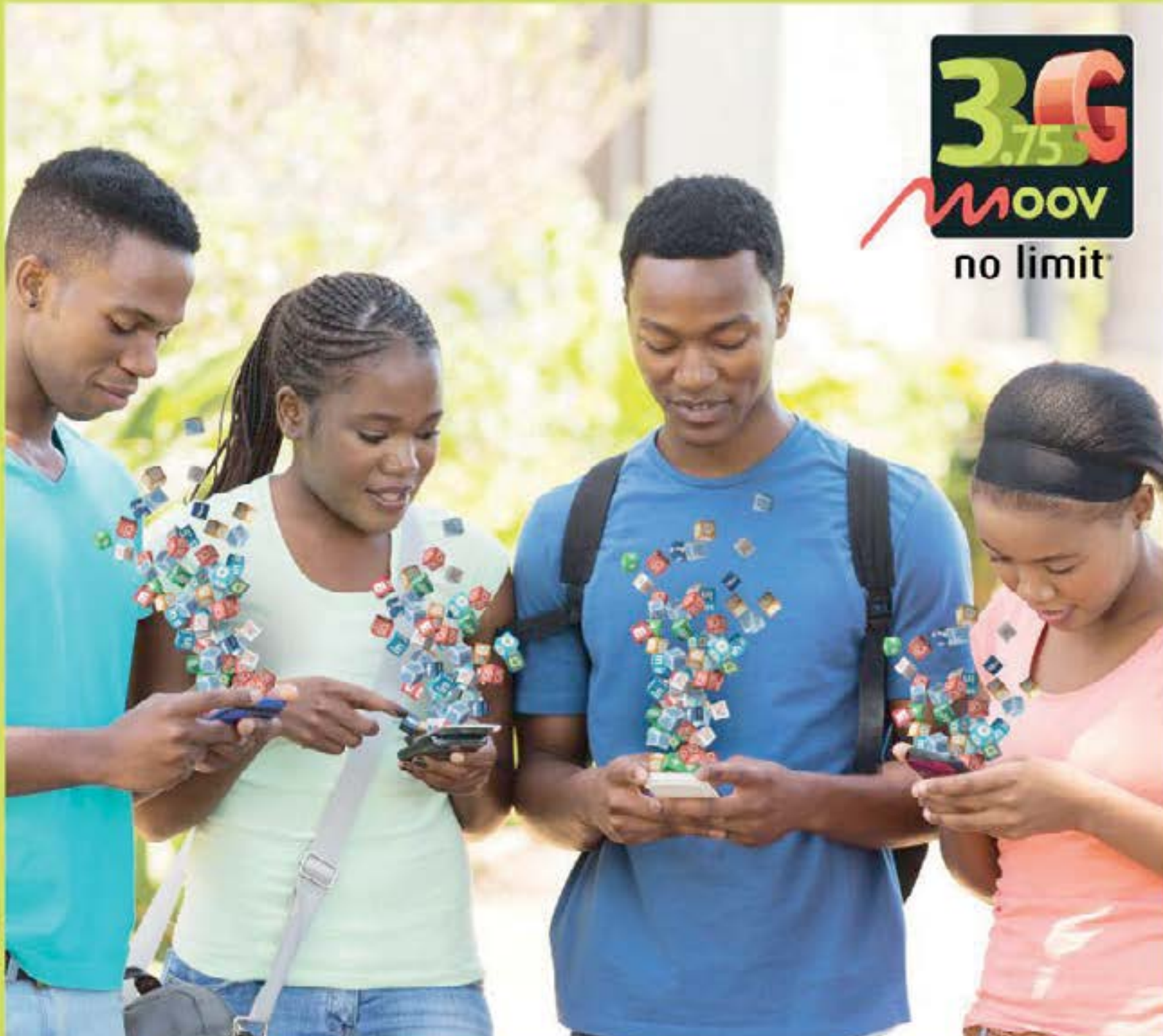
Dans la limite du stock disponible. Photo non contractuelle. Rendez-vous en agence