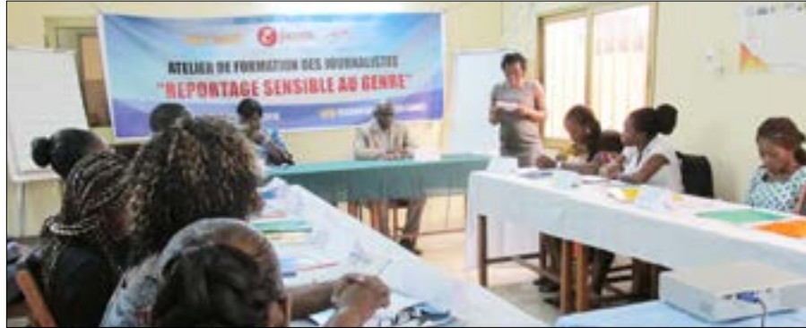
Des journalistes en pleine formation

Une vingtaine de journalistes venus de différents organes de presse, radios et télévisions du Togo ont pris part du 05 au 07 septembre à Lomé à un atelier de restitution sur le « reportage sensible au genre ».