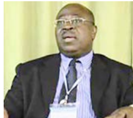
M. Edmond Amoussou, Dg ANPE -Togo

« La problématique de l'emploi constitue un challenge de tous les temps pour chacun de nos Etats dans le monde et pour chacun de nos services publics d'emploi. Pour mener à bien ce combat multidimensionnel face au