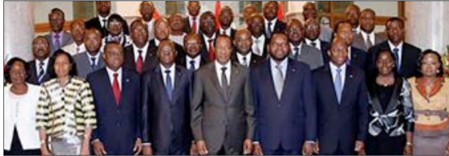
L'ancien Pdt Compaoré et son gouvernement

Une trentaine d'anciens ministres du dernier gouvernement de Blaise Compaoré ont été convoqués à la gendarmerie nationale il y a trois jours. Ils ont été entendus dans le cadre de l'enquête sur la répression de l'insurrection populaire, qui avait fait une trentaine de morts au Burkina-Faso en 2014.