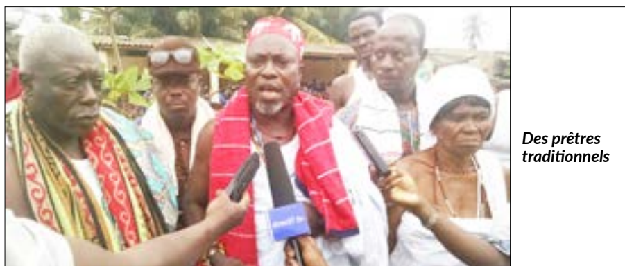
Des prêtres traditionnels

L'Union des Cultes Traditionnels du Togo (UCTT) a présenté son premier bureau exécutif le 06 septembre 2016 aux autorités locales dans le canton d'Aguègan dans la préfecture des Lacs.