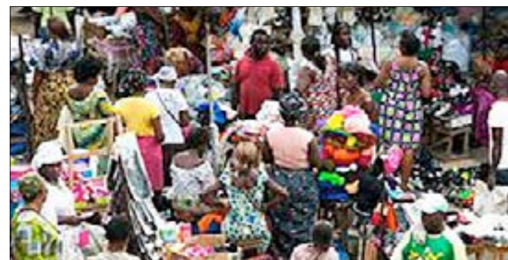
Des commerçantes au grand marché de Lomé

Le Directeur Général de la Chambre de Commerce et d'Industrie du Togo a annoncé la semaine dernière lors d'une conférence à Lomé, que plusieurs plaintes ont été déposées auprès de leurs services par plusieurs commerçants qui se disent harcelés par les taxes mis en place par l'Office Togolais des Recettes (OTR).