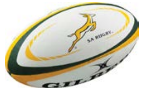
Un ballon de rugby

« World Rugby confirme que la France, l'Irlande, l'Italie et l'Afrique du Sud ont postulé dans les délais pour organiser la Coupe du Monde de Rugby en 2023 », lit-on sur le site officiel de l'instance.