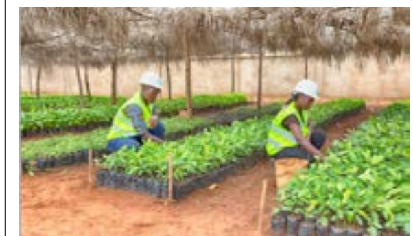
La pépinière à l'actif de la Fondation HeidelbergCement

Ces dernières années, au fil de nombreux sommets mondiaux, la question de la conciliation entre le développement économique et la recherche de l'équilibre écologique s'est toujours posée avec une grande acuité et une pertinence qui reflète le lien entre ces problématiques et la survie de l'homme. Dans le domaine de la cimenterie, le problème est d'autant plus poussé que ce domaine reste l'un des domaines visibles et palpables de la pollution. Même si notre dépendance au ciment est bien établie. Qu'en est-il alors de cette problématique à la Fondation HeidelbergCement et CimTogo ?