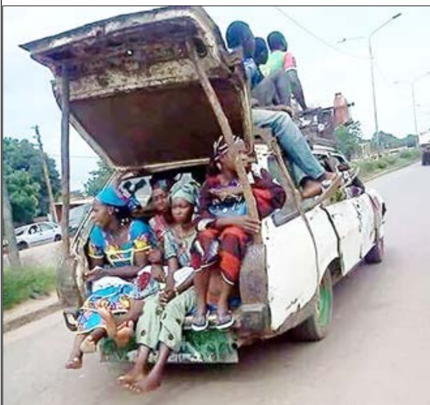
Commentez cette photo