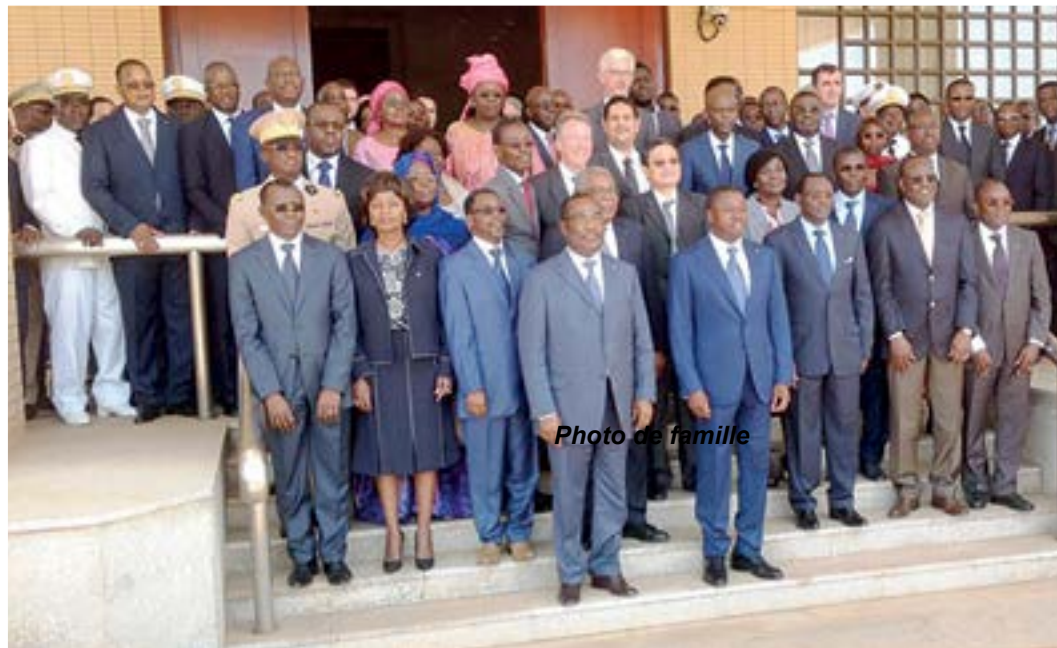
Photo de famille à l'issue de la dernière réunion du Haut Conseil pour la Mer

Selon le préfet maritime, le Togo, qui en 2011