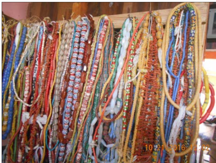
Des perles en vente au marché

Da Dédé : Il faut d'abord mettre la différence entre le corps de la femme et celui de l'homme. Chez la fille, les perles dessinent ses rondeurs et modèlent sa hanche. À la puberté, elles servent à tenir les couches traditionnelles (en pagnes) lors des menstruations. C'est également ces perles qui retracent et font ressortir les différentes parties du corps de la femme en toute sa beauté. Elles séparent le genou du mollet, le bras du poignet et les fesses du dos.