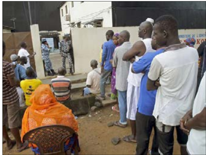
Des électeurs ivoiriens aux urnes

Toutes les vérités seront dites à travers les résultats des urnes au soir du 30 octobre 2016 en Côte d'Ivoire. Des résultats qui devront situer le président Alassane Ouattara sur ce projet de nouvelle Constitution vivement critiqué par une bonne partie de l'opposition qui appelle ses militants au boycott tout simplement.