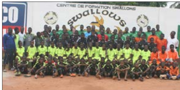
Équipe A & B des Swallows

Le centre de formation Swallows a battu l'As Tado, club de deuxième division du Bénin sur un score de 3 buts à 0, le jeudi 27 octobre à Lomé.