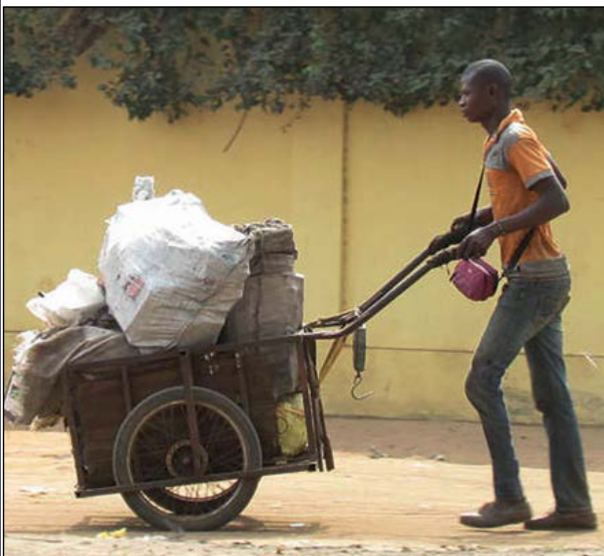
Commentez cette photo