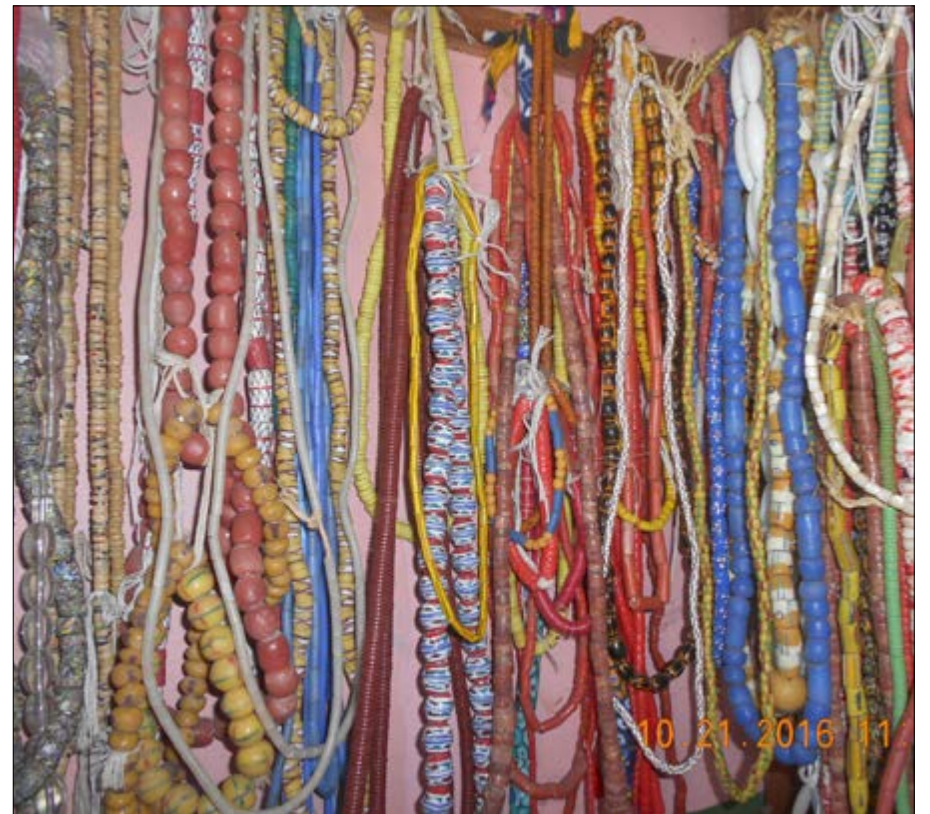
Exposition des perles de qualité supérieure sur un étalage

N'oublions pas l'aspect communication des perles. Les femmes se servent des perles pour faire passer un message. La femme mariée, par exemple, en portant les perles, ne fait que dire à son mari regarde-moi, je suis tout à toi. N'est-ce pas romantique ? Dans un couple, les perles jouent un rôle très important. Les filles ayant reçu ce précieux legs l'utilisent à bon escient. Le plus souvent, c'est pour susciter les désirs charnels de leurs hommes. Les perles se portent en fonction de l'atmosphère qui prévaut dans le foyer. La manière