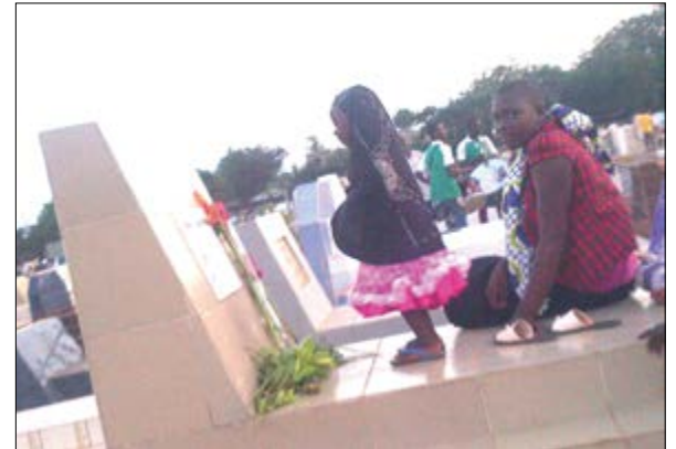
Recueillement sur des tombes

Le 1er novembre, il est de coutume de rendre hommage aux défunts. Une des manières de s'acquitter de ce devoir envers nos illustres et proches disparus reste de fleurir les pierres tombales. C'est d'ailleurs une tradition. Et ceci permet de témoigner l'attachement des vivants aux morts. Pour certains, les fleurs traduisent nos sentiments bien mieux que des mots. Encore faut-il connaître le langage des fleurs pour savoir justement quelle fleur offrir à un défunt. Au cimetière, fleur à la main