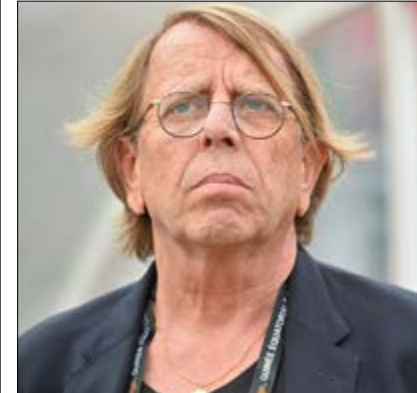
Claude Le Roy, sélectionneur des Eperviers

Les éperviers du Togo vont livrer deux matchs amicaux face aux Îles Comores le 11 Novembre à Tunis et contre le Maroc le 15 Novembre à Marrakech. Précise un communiqué de la Fédération Togolaise de Football (FTF).