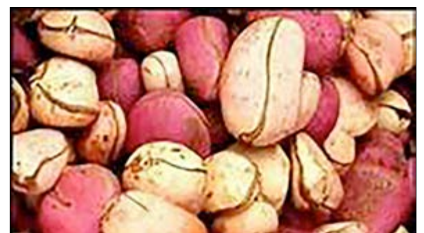
Des noix de kola

Au Togo, le commerce de la kola a commencé dans la région centrale à Sokodé et s'est développé avec les