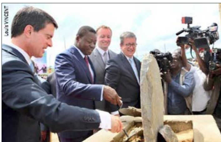
Pose de la première pierre du centre d'enfouissement

Au cours de sa tournée africaine, le Premier ministre français Manuel Valls était le 28 octobre dernier à Lomé où il a été reçu par le Président de la République togolaise Faure Essozimna Gnassingbé. Au programme, le renforcement des liens de coopération, d'amitié et des échanges commerciaux entre les deux pays. L'un des points saillants de cette visite aura été l'aide de la France pour la construction d'un centre d'enfouissement technique à Lomé.