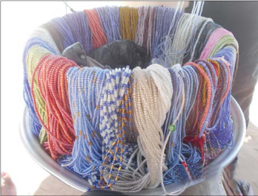
Variétés de perles en plastique

Depuis quelque temps, les Togolais sont rattrapés dans une nouvelle mouvance. On dirait une rupture avec les bijoux importés et le passage aux bijoux locaux « made in Togo », c'est-à-dire les perles.