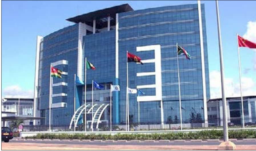
Le siège d'ETI au Togo

Nos confrères du magazine Jeune Afrique ont publié la semaine dernière la 18ème édition du hors-série annuel « Spécial Finance ». On y trouve le classement des 200 meilleures banques africaines.