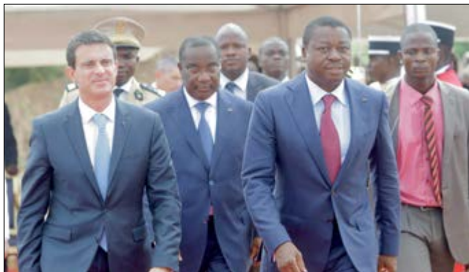
Manuel Valls en compagnie de Faure Gnassingbé

Lors de sa visite entre le 28 et le 29 octobre dernier, le Premier ministre français Manuel Valls saluant les efforts accomplis par le Togo dans le domaine de la bonne gouvernance, a souligné qu'« il y a un Togo moderne, en renouveau ».