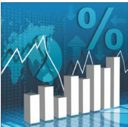
C'est peut être l'heure de vendre à la BRVM

2016 se profile comme l'année de la maturité pour la Bourse Régionale des Valeurs Mobilières (BRVM). Certes, son indice composite qui, avec une hausse de 17,7% au 31 décembre 2015, avait porté ce marché financier à la tête des bourses africaines, affichait au 27 octobre une baisse de 11,06%. L'indice BRVM 10 qui regroupe ses dix entreprises les plus performantes a reculé pour sa part de 16,7% à la même période. Pour les investisseurs c'est peut-être le moment de vendre des titres.