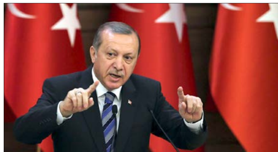
Recep Tayyip Erdogan

Le président turc Recep Tayyip Erdogan est décidé à punir et sévèrement les auteurs du coup d'Etat manqué de juillet dernier. Le weekend dernier, devant une foule qui réclamait la tête des putschistes, le président a promis faire voter cette loi par son Parlement et le promulguer rapidement pour passer à l'action. Une déclaration qui suscite indignation et consternation de la communauté internationale, surtout de l'Union européenne.