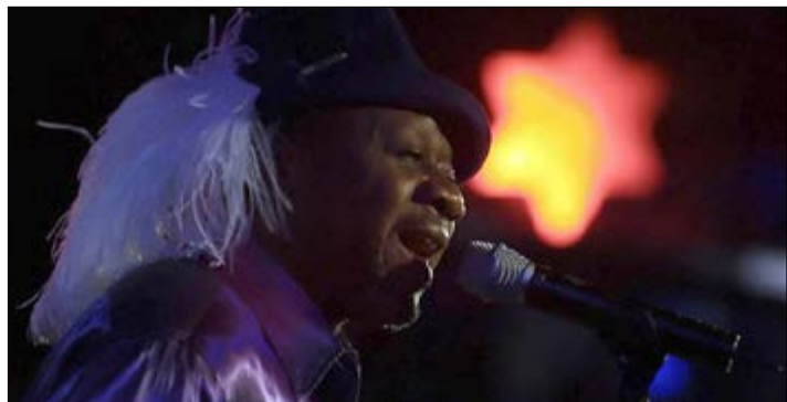
Feu Papa Wemba

Le label Cantos sort un disque posthume de l'icône de la rumba congolaise et de la « world music », six mois après sa mort brutale.