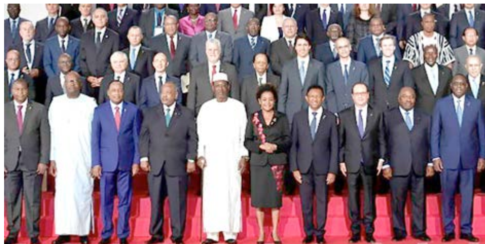
François Hollande (3ème à partir de la droite) au sommet de la Francophonie

Le 1er décembre dernier, le président François Hollande s'est exprimé, en direct à la télévision nationale, après avoir dressé un bilan de son mandat, qu'il ne se représentera plus. Si les analyses tendent vers les probables candidatures de Valls ou la redistribution des cartes de la gauche, l'une des questions qu'il faudra se poser est celle de savoir si, au regard de son bilan plus ou moins négatif, quel sort est réservé aux projets de ce tombeur de Sarkozy en 2012 qui avait promis entre autre, de rompre avec « la Françafrique » ?