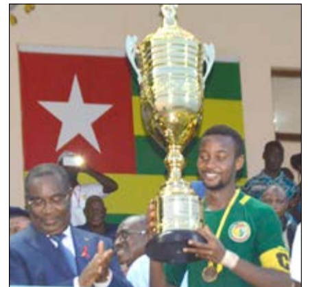
Le capitaine sénégalais soulevant le trophée