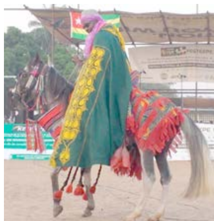
Exécution de la danse du cheval

Il sera également organisés dans le cadre du festival, un tournoi de football de