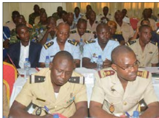
Vue partielle des FDS lors des échanges

Le Haut-Commissariat à la réconciliation et au Renforcement de l'Unité Nationale (HCRRUN) a rencontré les forces de défense et de sécurité (FDS) du Togo, le vendredi 02 décembre dernier à Lomé. C'est dans le cadre d'un atelier qui avait pour objectif de recueillir leurs contributions et implications sur le processus de réconciliation et d'unité nationale.