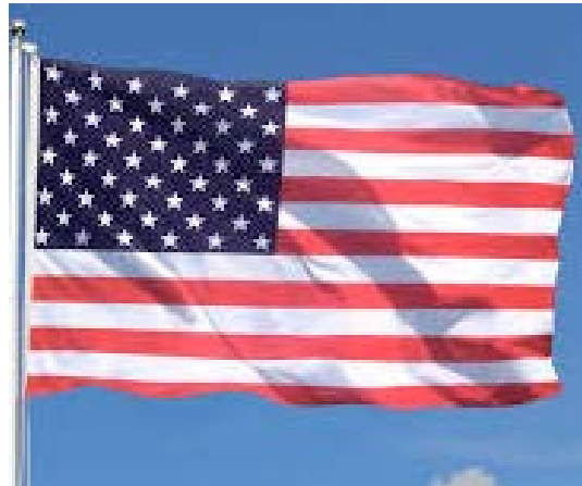
Un drapeau américain

Les autorités ghanéennes ont mis fin aux activités d'une fausse ambassade des Etats Unis dans la capitale, Accra, dirigée par un réseau criminel et qui, depuis dix ans, délivrait d'authentiques visas obtenus illégalement, a révélé le département d'Etat américain.