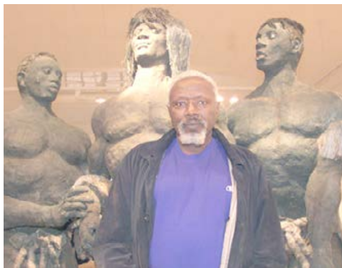
Le sculpteur feu Ousmane Sow entouré de ses oeuvres

Le génie de l'art devient l'un des créateurs contemporains les plus doués de sa génération par ses expositions au Whitney Museum aux États-Unis. Outre son rôle de rendre la terre ou le calcaire immobile, il sait extraire l'énergie vivifiante de la terre pour créer l'Homme à son image. Il arrive également à extirper de l'inerte la mémoire essentielle du vivant, l'emprisonner pour