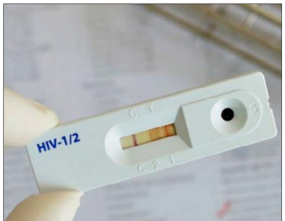
Un appareil d'autodépistage

L'insuffisance du nombre de diagnostics du sida ralentit la mise en œuvre du traitement de toute personne séropositive.