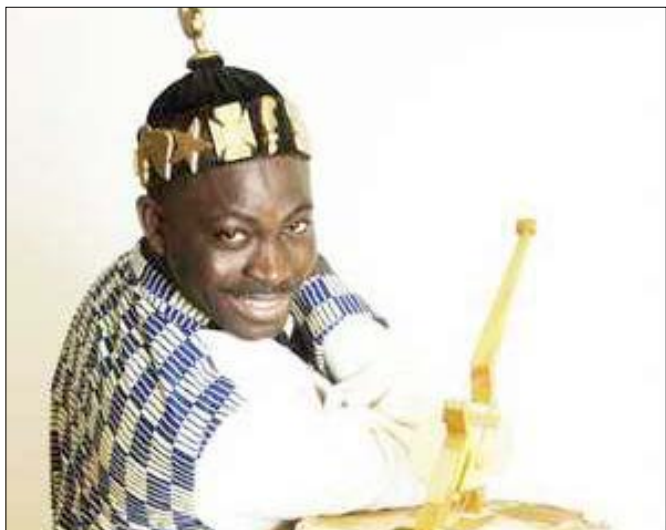
L'artiste King Mensah

Le roi de la musique togolaise, King Mensah sera en concert live le 10 décembre prochain à l'hôtel Sarakawa à Lomé. Un évènement placé dans le cadre de la célébration de ses 20 ans de carrière musicale.