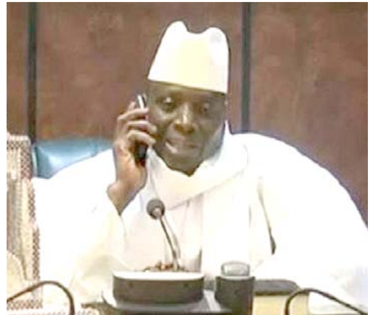
Yahya Jammeh, le président sortant

C'est l'un des événements inattendus de l'actualité africaine, également commentée par la maison blanche. Dans une élection où plusieurs analystes disaient être jouée d'avance, les gambiens votaient presque dans une désinvolture totale, puisque la tradition a toujours démontrée qu'on n'organise pas des élections en Afrique « pour les perdre ! ». Tradition donc infirmée ce vendredi 2 décembre 2016 en Gambie au cours d'un scrutin à un seul tour où les billes, utilisées comme bulletin de vote, ont eu raison du tout puissant ex-putschiste Yahya Jammeh.