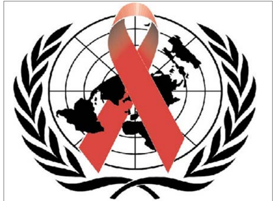
Élément visuel d'ONUSIDA

Le taux de prévalence du Sida dans la population générale est de 2,3%. Les plus touchés sont les prostituées (13,5%), les homosexuels (19,6%) et les toxicomanes (5%). Quant aux femmes, elles sont deux fois plus infectées que les hommes (1,7%). Selon les données de la Commission