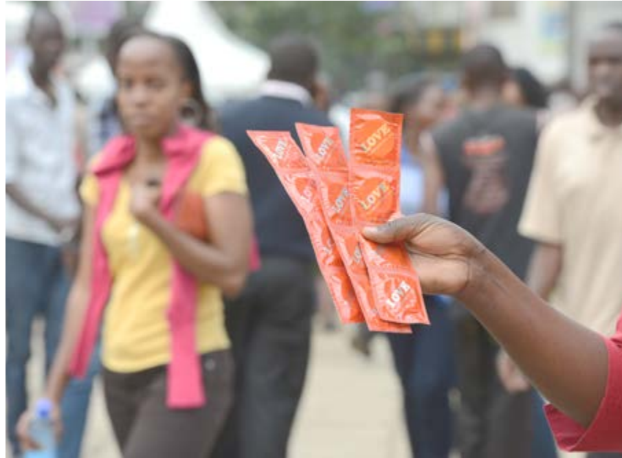
Des échantillons de préservatifs

Les raisons de cette vulnérabilité seraient, comme pour toute population aussi, le manque d'informations sur la prévention, la non-protection, l'appât du gain, l'isolement dû à la stigmatisation sociale, le manque de contrôle de soi devant le sexe, l'ignorance des voies de transmission, l'infidélité, etc. D'autres soutiennent que les gays