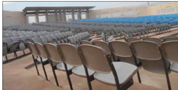
Les nouvelles chaises ... et les officiels

L'amphithéâtre en plein air de la Maison des jeunes d'Amadahomé a bénéficié le vendredi 02 décembre d'un don de 1200 chaises de la part de Togo Terminal, une filiale du Groupe Bolloré Transport et Logistics au Togo en collaboration avec le gouvernement togolais. Ce don vise à offrir un cadre socio-éducatif, culturel et propice à l'encadrement de la jeunesse.