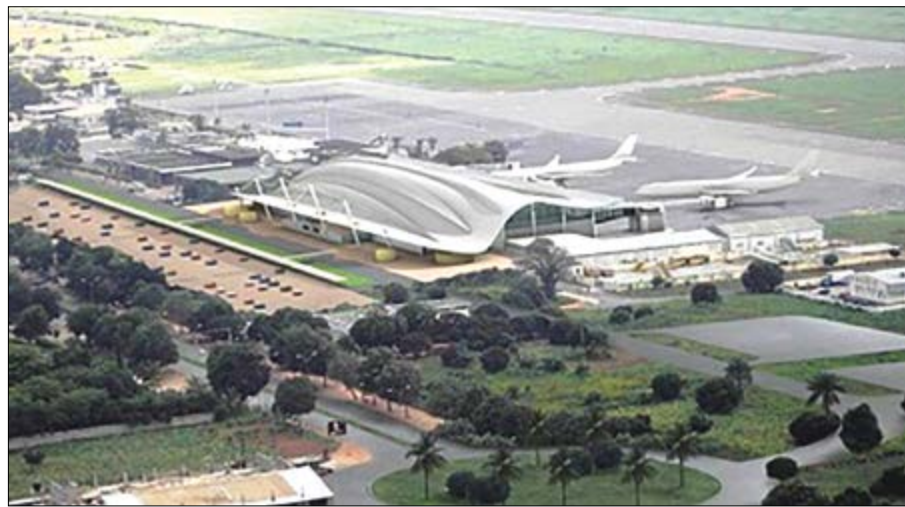
Aéroport de Lomé vu d'en haut

Les aéroports des 18 Etats membres de l'Agence pour la sécurité de la navigation aérienne en Afrique et à Madagascar (ASECNA) seront, d'ici 2020, équipés d'un nouveau système de positionnement par satellite dénommé « Galileo ». A l'aéroport Gnassingbé Eyadema de Lomé le système a été testé.