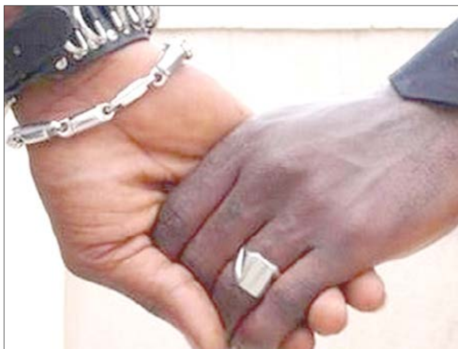
Deux homosexuels main dans la main