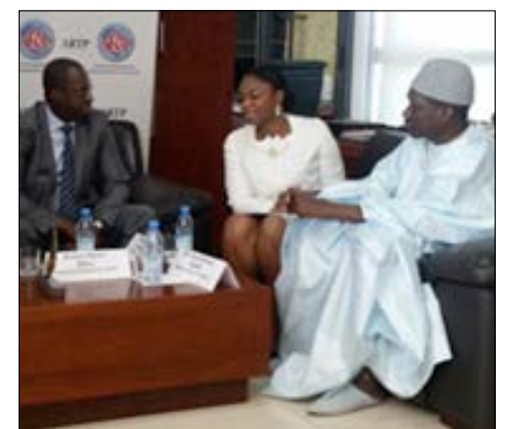
Les délégations togolaises et sénégalaises lors de la signature

Le « free roaming » vise à faciliter la mobilité des populations à travers les télécommunications en réduisant les coûts de communication lorsque l'on se trouve dans la zone des