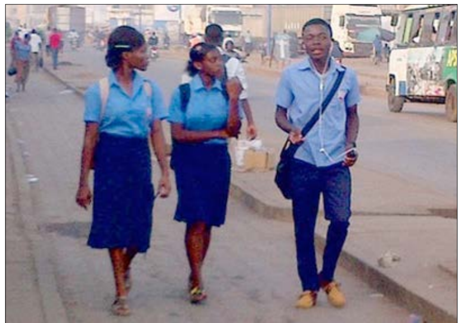
Des élèves en route pour l'école