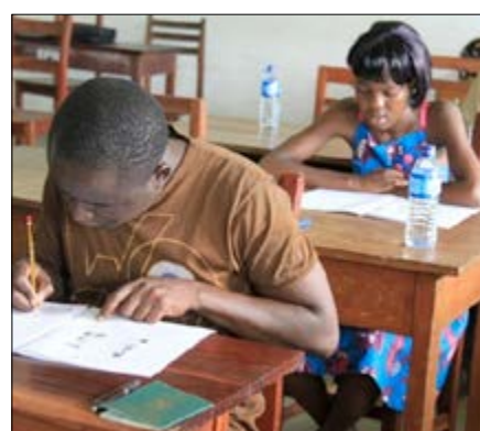
Des élèves en examen

Le troisième trimestre compte aussi 13 semaines de travail. Il débutera le 18 Avril pour prendre fin le 14 Juillet 2017.