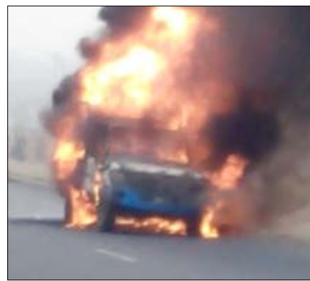
La voiture de la police en feu

Dans un communiqué issu par le ministère de la Sécurité, il est fait état de ce que « ni la gravité, ni la