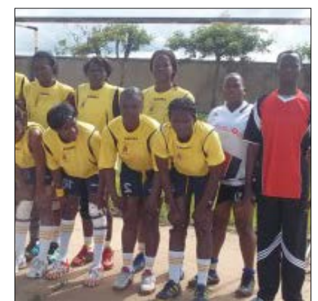
Des joueurs du club des Elites

Le championnat organisé par la Fédération Togolaise de Handball (FTHB) a permis de mettre en compétition les meilleurs clubs sur