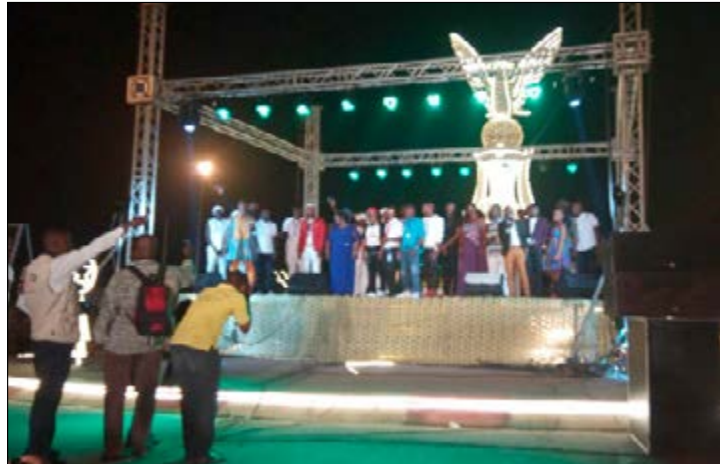
La scène installée à l'occasion de Calienté

Beaucoup de Togolais ont répondu présents le 31 décembre 2016 à la place de la colombe de la paix au rendez-vous devant accueillir la nouvelle année 2017. C'était à l'occasion de l'événement socioculturel annuel dénommé « Calienté ».