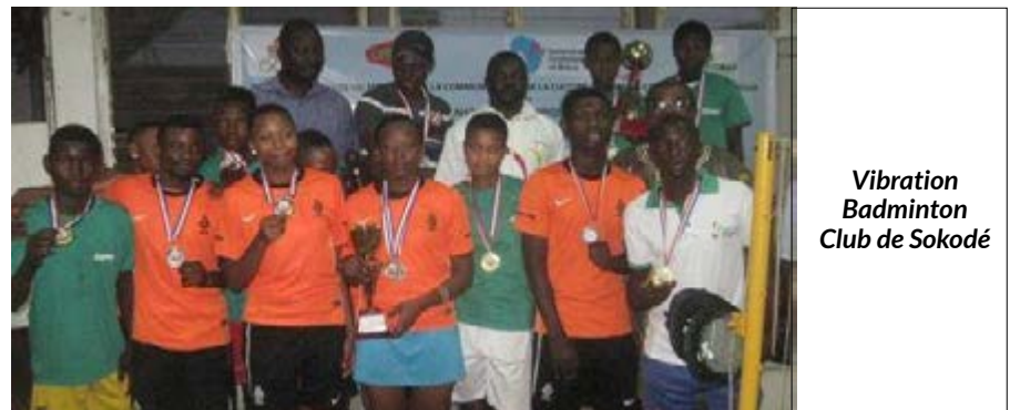
Vibration Badminton Club de Sokodé

Vibration Badminton Club (VBC) de Sokodé est vainqueur de l'édition 2016 du championnat national de badminton disputé les 27 et 28 décembre à Lomé, avec 3 matchs gagnés contre 2 pour Rangers Badminton Club (RABAC) de Lomé.