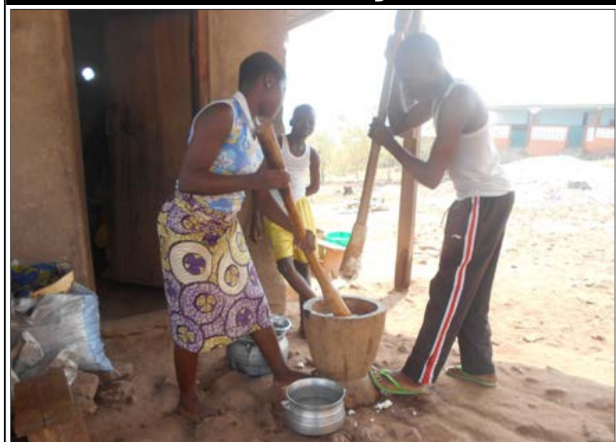
Commentez cette photo