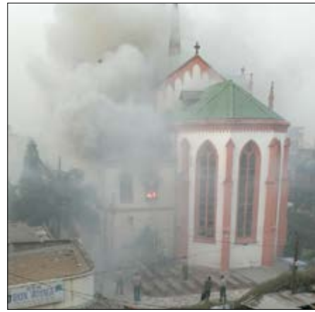
Vue de la Cathédrale de Lomé en feu

Pour le travail effectué par ses hommes sur le terrain, le Chef corps des sapeurs-pompiers a déploré que qu'il y a « Trop d'encombrement, fait que les secouristes n'arrivent pas à exécuter le travail qu'il faut.