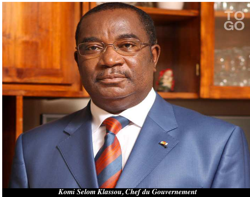
Komi Selom Klassou, Chef du Gouvernement