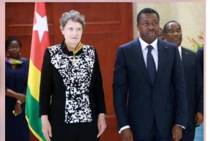
Mme Helen Clark (g) et Faure Gnassingbé (d)

L'administrateur du PNUD a passé en revue les appuis de son institution au Togo P.1