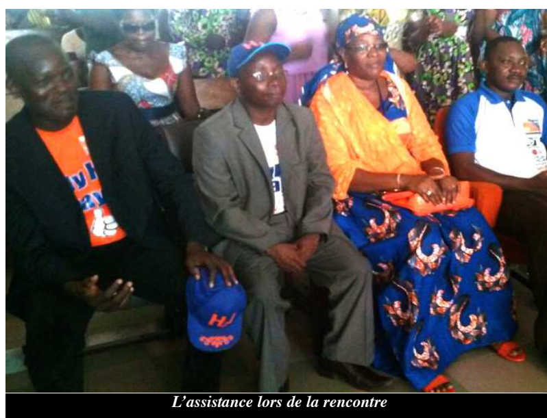
L'assistance lors de la rencontre

Notons que ces deux types de financement sont traduits par un plan de