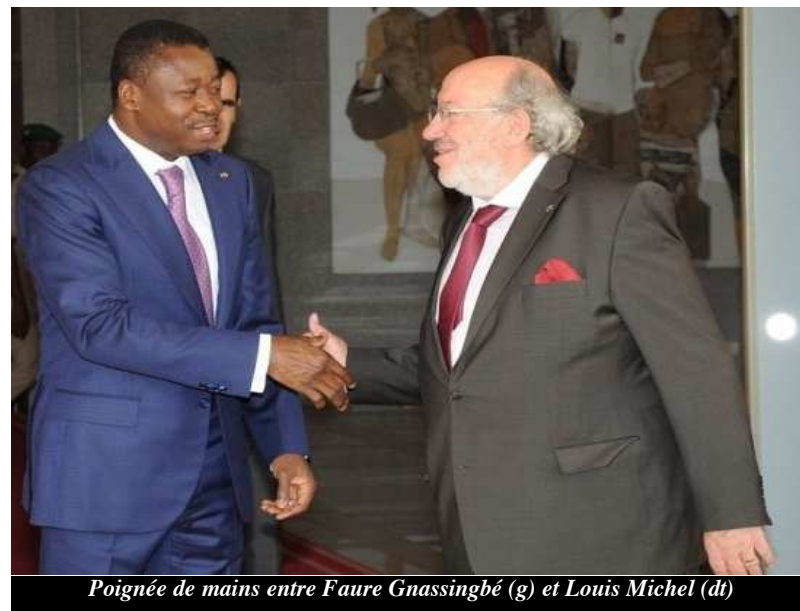
Poignée de mains entre Faure Gnassingbé (g) et Louis Michel (dt)

Selon le communiqué rendu public à l'issue de la rencontre, M. Louis Michel, émissaire de la Commission de l'Union Européenne est à Lomé pour recueillir les avis et contributions du Président de la République dans la perspective de la renégociation des Accords de Cotonou qui pren-