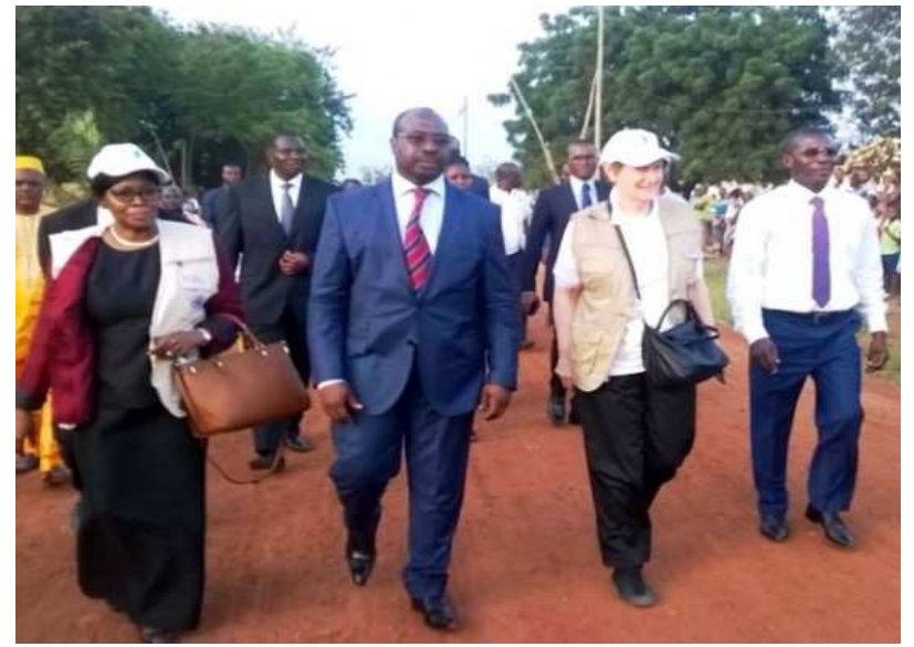
Mme Helen Clark en visite à Kovié

La visite de Mme Helen Clark à Kovié était destinée à lui permettre de constater de visu l'état d'avancement de la construction de la piste reliant les villages de Davié, Assomé, Kovié, et Noépé. Cette infrastructure est financée sur le budget du PUDC. " Le PUDC va aider à construire des hôpitaux, des centres de santé, des écoles. C'est un plaisir de voir que pas si loin de Lomé, un pro-