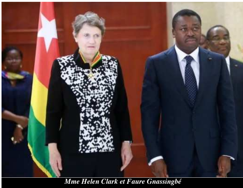
Mme Helen Clark et Faure Gnassingbé

Au cours de cet entretien avec le PM Klassou, on notait la présence de plusieurs membres du gouvernement ainsi que des diplomates en poste au Togo, des partenaires en développement et des responsables locaux du