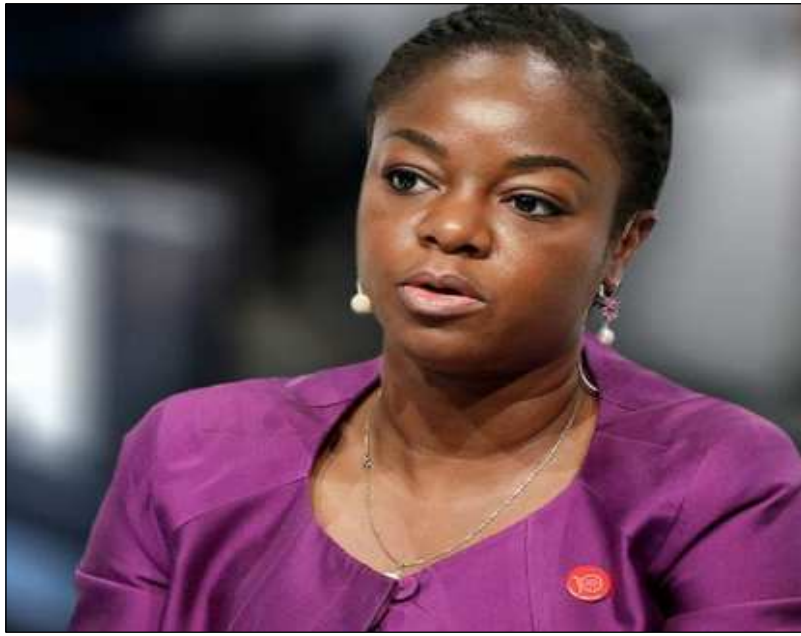
Mme Cina Lawson, ministre des Postes et de l'Économie numérique

Signé depuis le 03 janvier dernier à Dakar, le protocole d'accord à l'initiative du " free roaming " est enfin rentré en vigueur le vendredi 31 mars dernier. C'est le Ministère des Postes et de l'Économie Numérique et l'Autorité de Régulation des secteurs des Postes et des Télécommunications (ART&P) qui a officiellement annoncé cette bonne nouvelle. Free roaming soulagera un grand nombre des togolais qui engagent plus de frais pour communiquer avec leur proche quand ils se déplacent au Sénégal, en Côte d'Ivoire, au Burkina-Faso, au Mali, en Sierra-Leone ou en