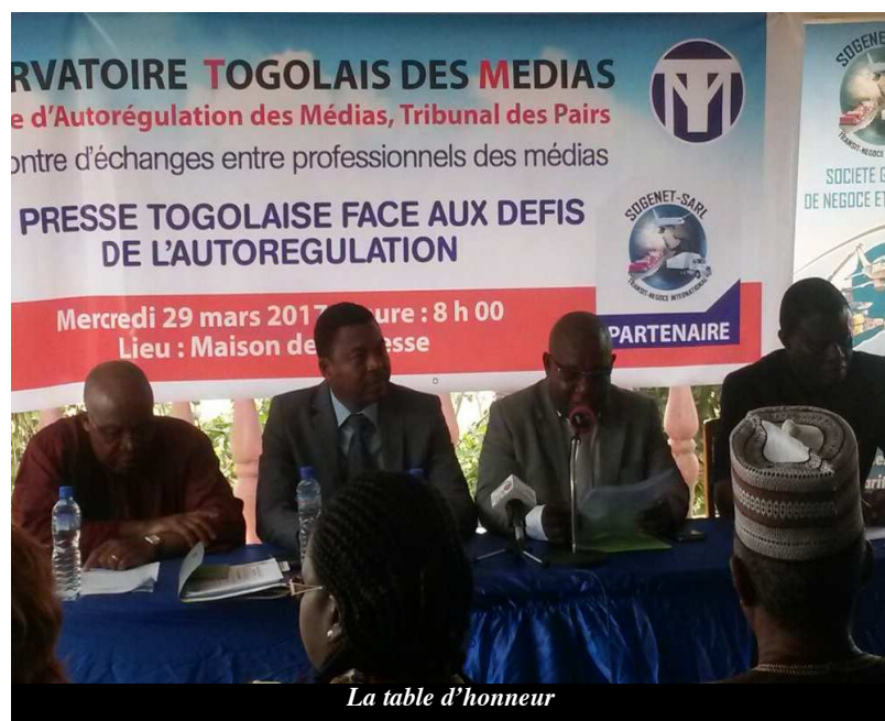
La table d'honneur

Après la mise en place de l'Observatoire Togolais des Médias, il y a une dizaine d'années, bien de questions continuent toujours par traverser l'esprit des professionnels et acteurs de la presse. L'on se demande si le respect