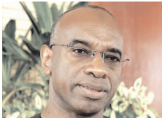
attention particulière aux foyers de tension qui prévalent sur le continent, dont celui en Guinée Bissau.

A sa prise de fonction le 04 juin dernier, le Chef de l'Etat togolais s'est engagé auprès de ses pairs à porter une