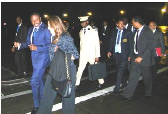
Faure Gnassingbé à son arrivée à Addis Abeba