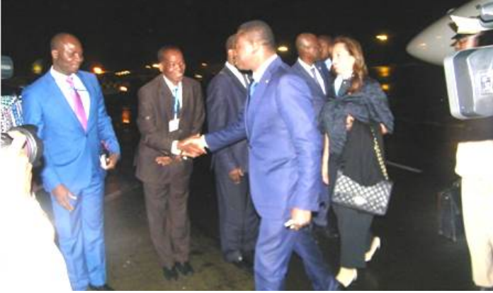
Arrivée du Chef de l'Etat à Addis Abeba