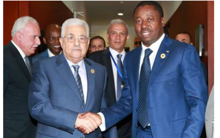
Poignet de main entre Mamoud Abass et le Pdt Faure