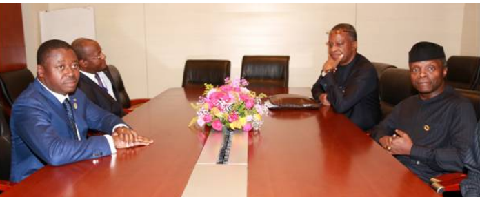
Le Vice-président nigérian chez le Pdt Faure