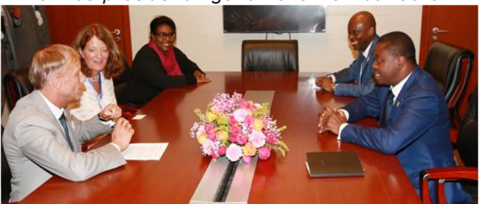
Une délégation du Fonds Mondial chez le Pdt Faure N° 152 - Jeudi 06 Juillet 2017