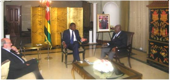
Le Président Ghanéen et Louis Michel chez le Pdt Faure