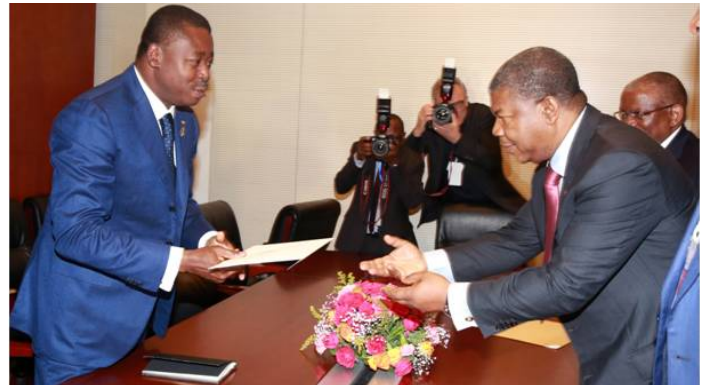
Le Ministre angolais de la défense nationale remettant la lettre du Pdt Do Santos au chef de l'Etat