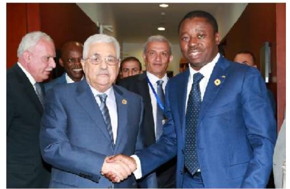
Poignet de main entre Faure Gnassingbé et Mahamoud Abass

En marge des travaux du sommet, le Chef de l'Etat a