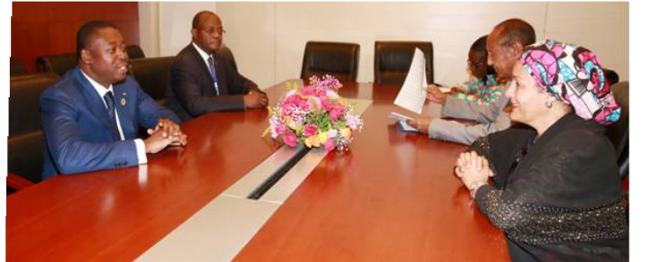
Mme Amina Mohamed fière de rencontrer le Pdt Faure