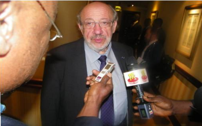
Louis Michel face à la presse