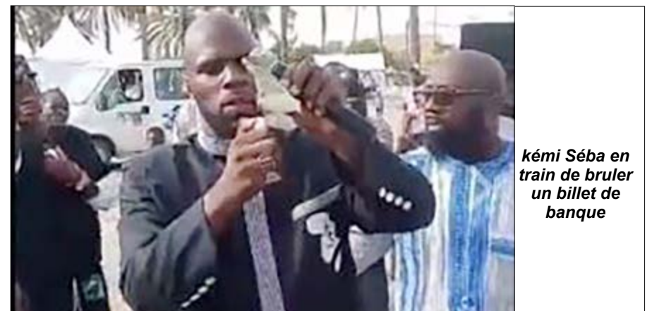
Kémi Séba en train de brûler un billet de banque

Selon nos confrères du site jeuneafrique.com, « dans la nuit de jeudi à vendredi, avant son interpellation, l'activiste a posté un message sur sa page Facebook,