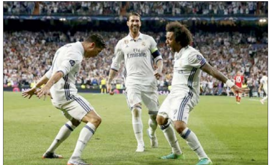
Ronaldo célébrant un but avec ses coéquipiers

Le footballeur portugais, Cristiano Ronaldo lauréat du prix de meilleur joueur de l'UEFA pour sa troisième fois dont deux consécutives, se pose désormais en favori du prochain Ballon d'or, le trophée individuel suprême.