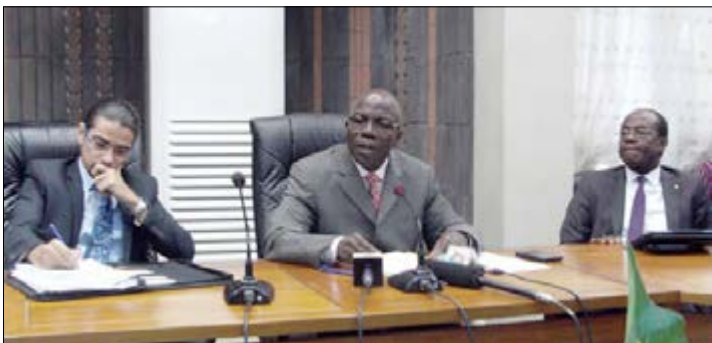
Les trois intervenants au cours de la présentation

Le Ministère de l'Economie et des Finances, à travers son secrétariat permanent pour le suivi des politiques de réformes et des programmes financiers au Togo a organisé le 24 août 2017 la revue nationale de la performance des réformes du premier semestre de l'année 2017 dans les départements ministériels et institutions de l'Etat.