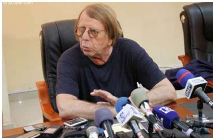
Claude le roy

« À mon avis nous allons voir émerger de nouvelles nations qui pourraient créer la surprise et valider leurs billets pour la Russie, même si pour moi les Sénégalais sortent du lot car ils possèdent d'énormes qualités au sein de leur effectif. J'en fais mes favoris pour aller au Mondial, avec mon ancienne équipe de la RD Congo qui