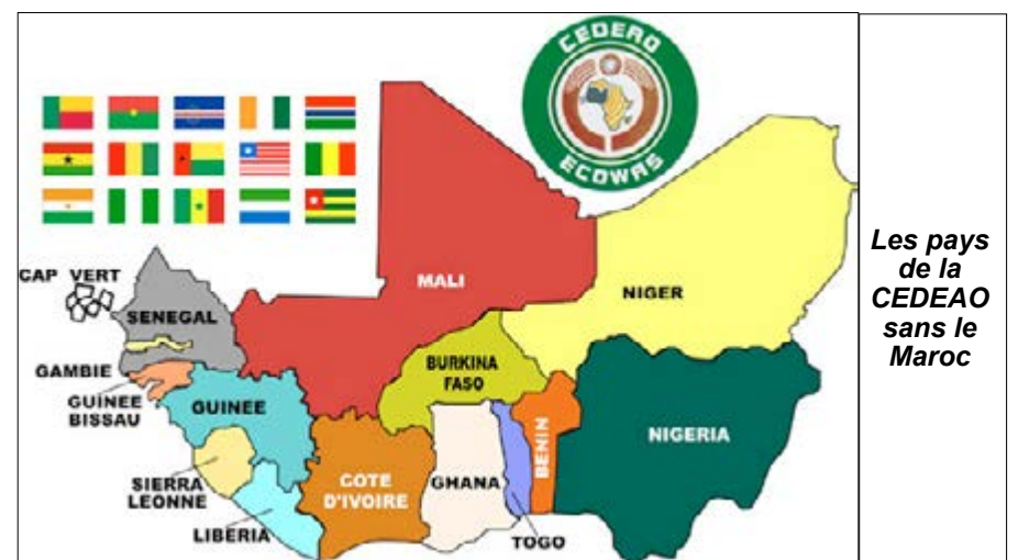
Les pays de la CEDEAO sans le Maroc

politique de libre circulation. Et surtout à l'intégration financière et macroéconomique en son sein. Sa croissance enregistrée ces dernières années attire. Son PIB a augmenté de 6,3 % entre 2007 et 2012, il est de 5,7 % en 2013 ou encore 6 % en 2014, avant une chute brutale due à différentes crises en 2015, atteignant 3,1 %. En somme, l'Afrique noire constitue pour le Maghreb un terrain fertile pour faire fleurir son économie, face à une Europe dont l'économie est en berne. Mais le risque, que nous soulevons ici est celui de la concurrence. L'Afrique noire saura-t-elle bénéficier en retour de cet élargissement géographique et géoéconomique à des Etats qui ont atteint un niveau de développement