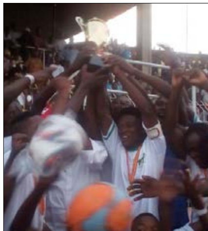
Les joueurs de Dynamic soulevant leur trophée