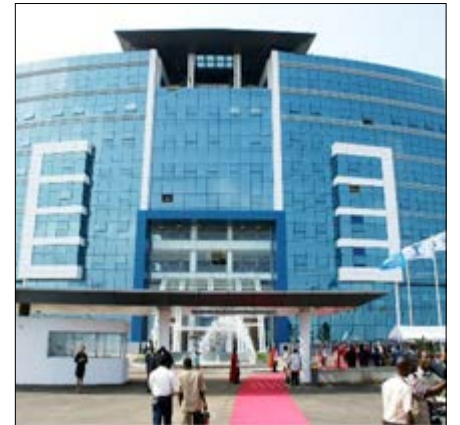
Siège d'Ecobank au Togo