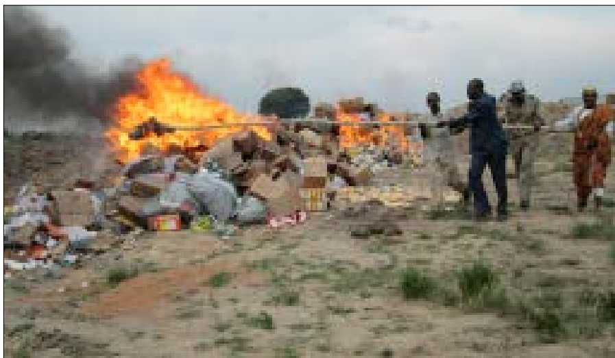
Destruction-faux-médicaments (image archive)

Dans le cadre de cette opération, plus de 41 millions de cachets et 13.000 cartons de produits médicaux et pharmaceutiques à savoir: les compléments alimentaires, des analgésiques, des antibiotiques, des médicaments anti-malaria et de contrebande ont été saisis, représentant une valeur marchande d'environ 21,8 millions de dollars près de 18,5 M d'euros. Dans la plupart des pays comme le