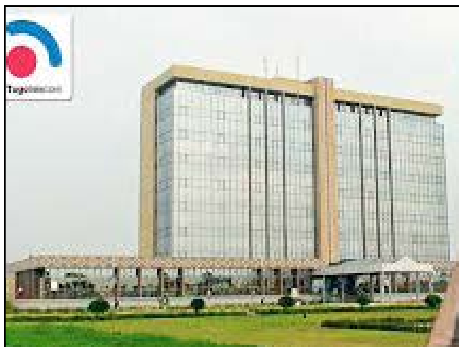
Le siège du groupe Togotélécom

Les clients, les entreprises, etc. trouveront tireront sans doute partie via une meilleure couverture du territoire en services de téléphonie fixe et mobile, des prix très bas, une qualité irréprochable dans le service, la multiplication des offres qui seront convergentes au packagées.