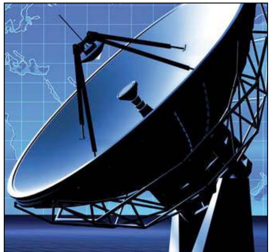
Des installations d'une société de télécom

le programme de transformation s'est pourtant déroulée de manière participative avec des propositions émanant des cadres et experts des deux sociétés. Elle a pour objectif de refonder le groupe dans le sens d'une