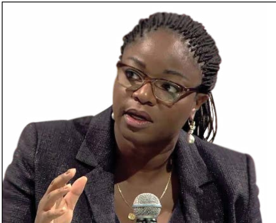
Le ministre Cina Lawson

En effet, une Holding de Télécommunication moderne et forte est source indéniable d'efficacité,