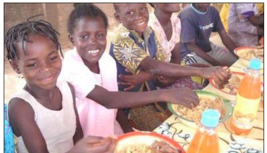
Des enfants en train de prendre leurs repas

Du côté du Ghana, qui était classé en 2008 comme parmi les 36 pays du monde ayant le plus fort taux de dénutrition infantile chronique, l'Organisation souligne que de nombreux progrès ont été accomplis depuis lors, à la faveur d'une bonne intégration de la question nutritionnelle dans les politiques