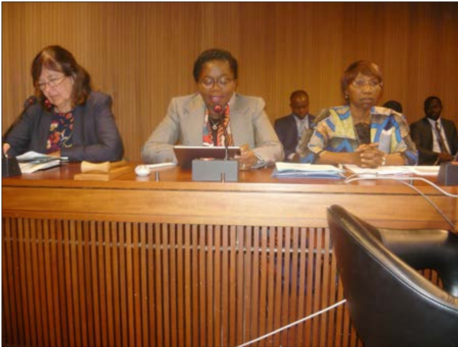
Mme Victoire Dogbé (au milieu) lors de la présentation du Togo

Le Togo qui est membre du Conseil des droits de l'homme de l'Organisation des Nations Unies, a été très actif à la 36ème session du Conseil qui a cours à Genève. « ODD : Pour ne laisser personne derrière, Commençons le développement à la base », tel est le thème autour duquel la délégation du gouvernement, conduite par le Ministre du Développement à la Base, Victoire Dogbé a convié hier jeudi 14 septembre au siège du Conseil, le gotha des participants au Conseil et surtout de la diplomatie sur la place de Genève. Le Togo a voulu partager et valoriser son expérience de développement à la base via cette rencontre - débat et donner la preuve vivante de son slogan « Ne laisser personne derrière », qui reflète en bonne partie les dix-sept objectifs du développement durable. La salle N° 27 du Palais des Nations unies comble, une assistance très admirative et plusieurs lauriers recueillis par le Togo pour une présentation qui n'a laissé justement aucun technicien, aucun programme ou aucun concept du développement inclusif togolais sur le bas-côté.