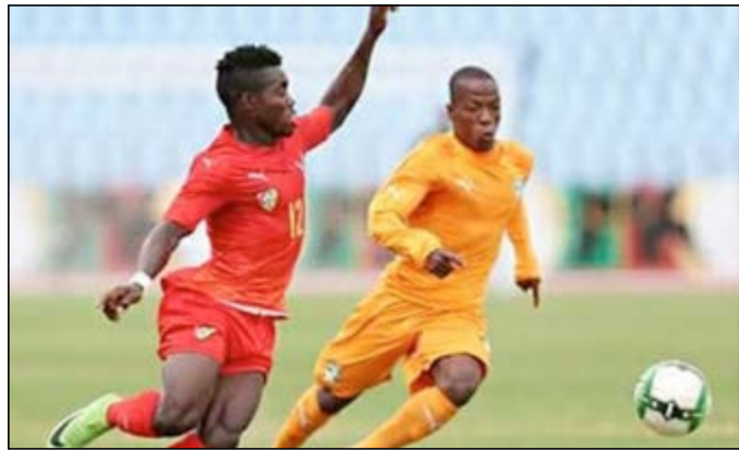
Une action de jeu entre un joueur togolais et un ivoirien

La Côte d'Ivoire s'est qualifiée pour la phase de poule du tournoi de l'UFOA qui se dispute au Ghana. Les Eléphants se sont imposés devant les Eperviers du Togo à l'issue des séances des tirs au but 4-3, temps réglementaire 0-0.