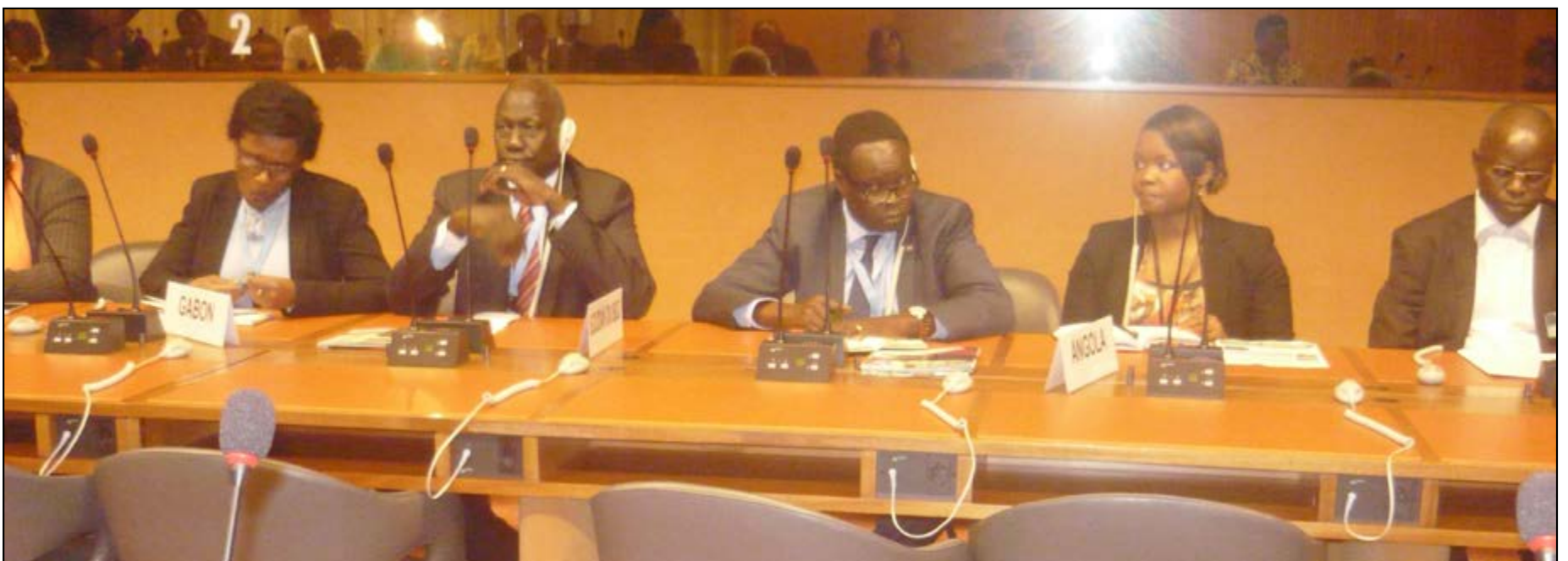
Une partie de l'assistance attentive à la présentation

En tant qu'acteurs et bénéficiaires ces CVD reçoivent des formations de leurs actions de développement, par les AGAIB en cinq modules à savoir : Organisation et Dynamique Communautaire (ODC) passation de marchés communautaire (PMC) Gestion transparente des fonds