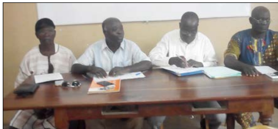
Les responsables de l'association Sublima International lors de la conférence

Faute de consensus, l'affaire traîne depuis plusieurs années (3 ans) et les multiples réunions des cadres du milieu et des responsables du ministère en charge de l'administration territoriale et des