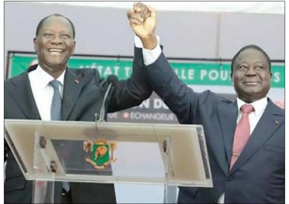
Alassane Ouattara et Henri Konan Bédié

Parvenu au pouvoir en 2011 grâce à une alliance entre le PDCI de l'ancien président Henri Konan Bédié et les Forces nouvelles de Guillaume Soro, le RDR du président Alassane Ouattara a aujourd'hui du mal à mobiliser ses anciens alliés. Au 3ème congrès du RDR la semaine dernière, les deux grandes figures de proue de l'alliance de 2010 ont brillé par leur absence. Un fait qui n'est pas passé inaperçu, même si Henri Konan Bédié s'est fait représenter.