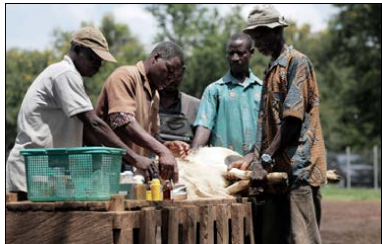
Des techniciens d'élevage aux petits soins d'un bélier de race améliorée à Kolokopé.