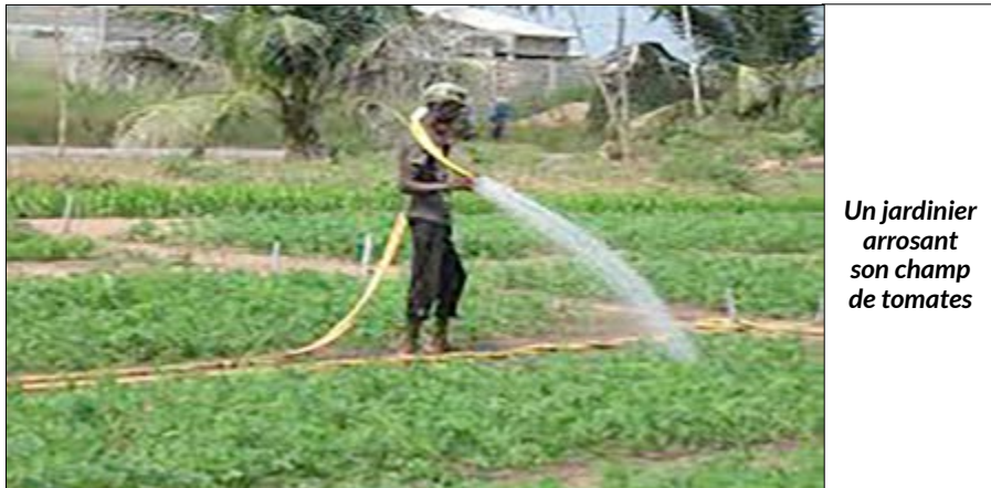
Un jardinier arrosant son champ de tomates

Des jeunes agronomes togolais ont élaboré à base de neem et d'autres produits végétaux, un insecticide naturel et efficace capable de protéger les cultures, les plants contre des envahisseurs comme les insectes et autres qui pèsent souvent sur les récoltes.