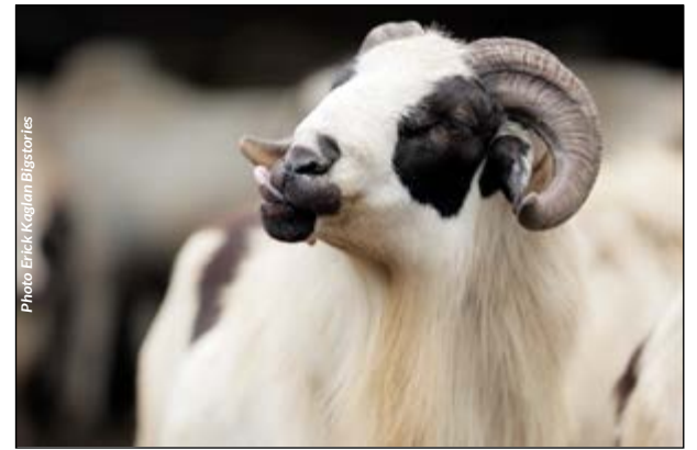
Un bélier de la race améliorée Djalonné au centre de production de Kolokopé

'Ce bélier m'avait séduit à première vue. Son vendeur m'avait dit qu'il me ferait beaucoup de petits et je l'ai même surnommé +Zodédé+, c'est-à-dire 'puissance'. Mais je me rends compte que je me suis trompé à son sujet. Franchement je suis déçu par ses performances. Il ne m'arrange pas du tout', se plaint Yao. D'après lui, il arrive que +Zodédé+ fasse preuve