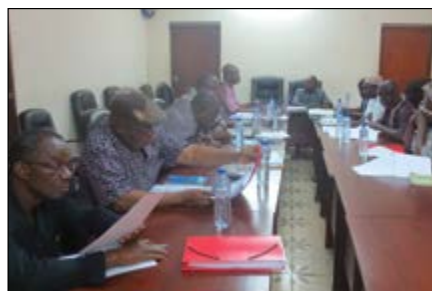
Les participants en plein travaux

Facilités par une personne ressource du ROPPA, les travaux de cet atelier