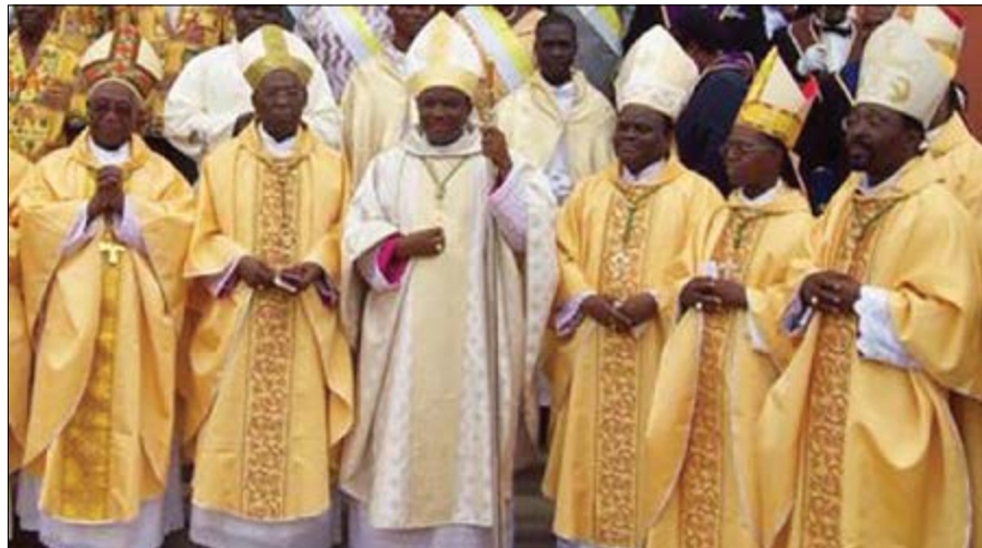
Des Evêques du Togo

L'ouragan politique - pareil à l'ouragan meurtrier Irma - que des leaders de l'opposition togolaise annoncent depuis l'éclatement des événements du 19 août dernier ne s'est guère produit. Dieu merci! S'il y a une prière à adresser à Dieu aujourd'hui, c'est de toujours nous garder à l'abri de tout cataclysme politique qui viendrait à ébranler socialement, religieusement, culturellement, etc. notre pays. Mais le message que proposent des représentants de Dieu, des Evêques, de notre pays au cœur de cette crise, s'éloigne de la voie médiane. Leur propos est bien loin de rassembler un tant soit peu les positions divergentes et éparses. Avouons-le tout de suite, le message de la Conférence des Evêques du Togo du dimanche 14 septembre dernier, n'est qu'un parfum qui s'étourdit de la propre odeur entêtante d'une frange de la classe politique du Togo, ce n'est pas un parfum de suave odeur, pareil à l'encens, qui apaise les esprits, les âmes et atténue les passions en rendant fraternels les uns envers les autres et en élevant les esprits et les cœurs.