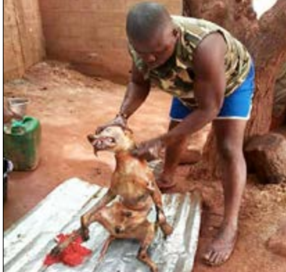
Légendez cette photo