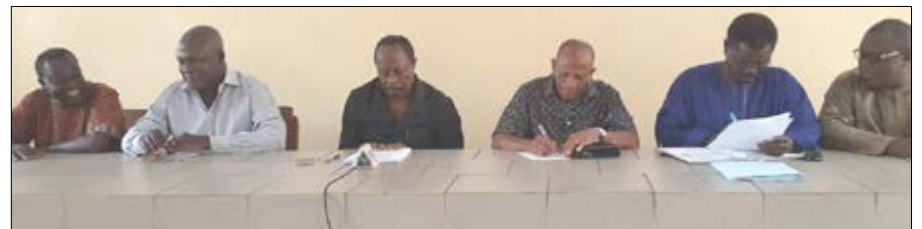
Des responsables de RAD Golfe