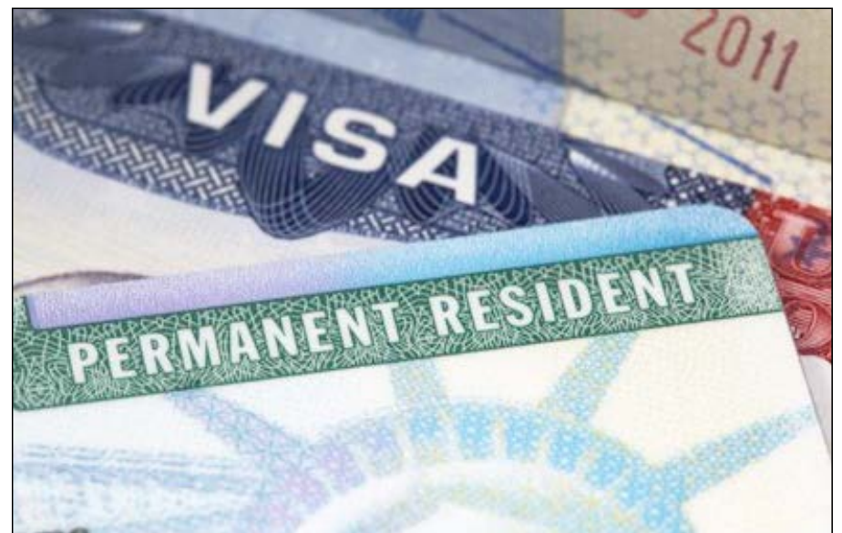
Un visa d'immigration

Cette mesure a été suivie d'application immédiate dans certaines ambassades des Etats-Unis en Afrique comme c'est le cas en Erythrée où l'ambassade a cessé