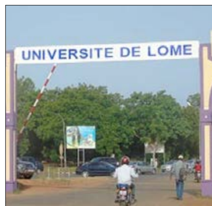
L'entrée principale de l'UL

inscription, l'UL invite les nouveaux bacheliers à prendre part à des séances d'informations sur les conditions d'accès aux différents parcours et les nouvelles modalités d'inscription les 3 et 10 octobre 2017 à partir de 09 heures dans