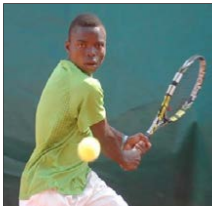
TM Un jeune joueur de tennis

Seront présents des joueurs juniors d'Afrique de l'Ouest et Centrale, mais aussi d'Europe, d'Asie et d'Amérique du Nord qui veulent améliorer leur classement mondial.