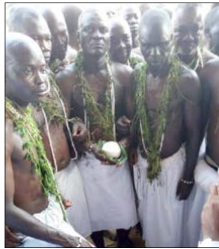
Présentation de la pierre prise

Les festivités de cette année ont démarré le 12 juin dernier avec les