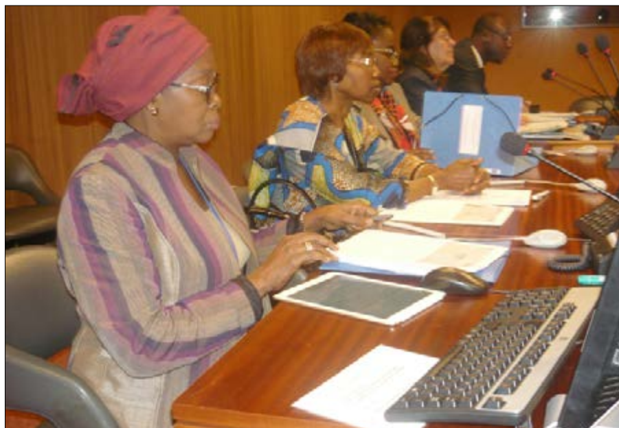
La délégation des autorités togolaises et la représentante résidente du PNUD au Togo

Au total, 57,1 milliards de FCFA, (soit 107,8 millions de USD) ont été mis à la disposition des PSF Partenaires par le FNFI sous forme de lignes de crédits pour octroyer 1 299 115 micros crédits (nouveaux et renouvellements et produits spéciaux), pour un montant total de 61,7 milliards de FCFA (soit un peu plus de 100 millions de USD). Nos difficultés c'est la rareté et