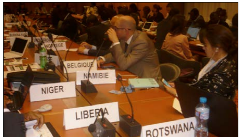
L'assistance composée de diplomates et autres invités

Une attention particulière est accordée aux questions environnementales dans la réalisation des activités des projets/programmes à la base avec l'élaboration des