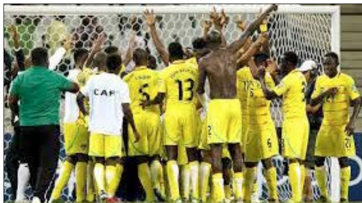
Les Eperviers célébrant un but

Les Eperviers du Togo croiseront les crampons en match amical avec l'Iran. Cette rencontre qui s'inscrit dans le cadre de la Journée FIFA d'octobre 2017 se tiendra le 05 Octobre prochain.