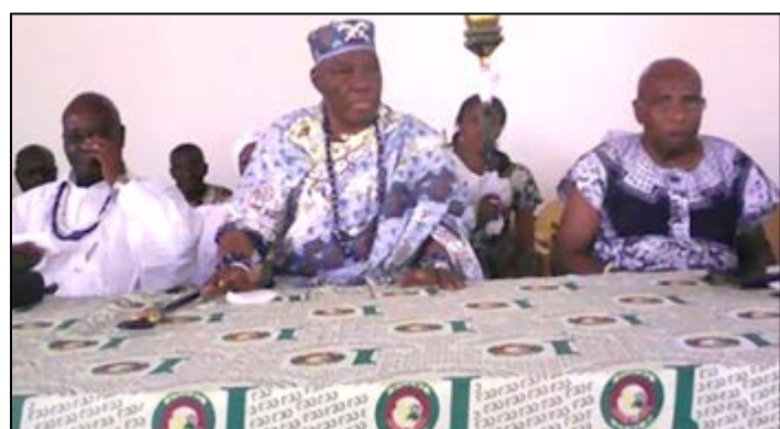
Nana Anè Ohiniko Quam Dessou XV au milieu

Après avoir consulté les ancêtres sur la question des réformes pour les cérémonies de veuvage dans le clan Adjigo et Alliés, la communauté a rendu public les résultats obtenus. C'était le samedi dernier au cours d'une cérémonie au palais royal Flamani des Adjigo et alliés à Aného.