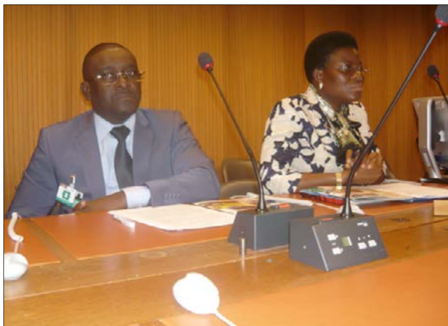
Le DG du FNFI et la DG de l'ANADEB

- maintenir le cap et assurer la pérennité de la mise en œuvre des produits et services financiers de