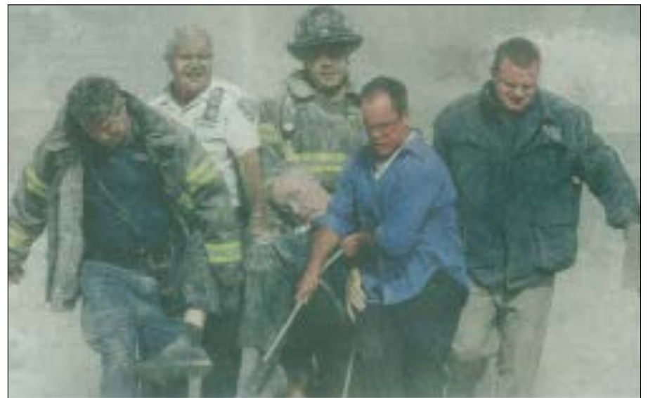
Ce cliché montrant le corps de Mychal Judge sorti des décombres est parfois qualifié de « pietà moderne ».

C'est le prêtre argentin Luis Escalante, vivant à Rome, qui, le premier, a proposé le nom de Mychal Judge au début du mois de juillet dernier. Il