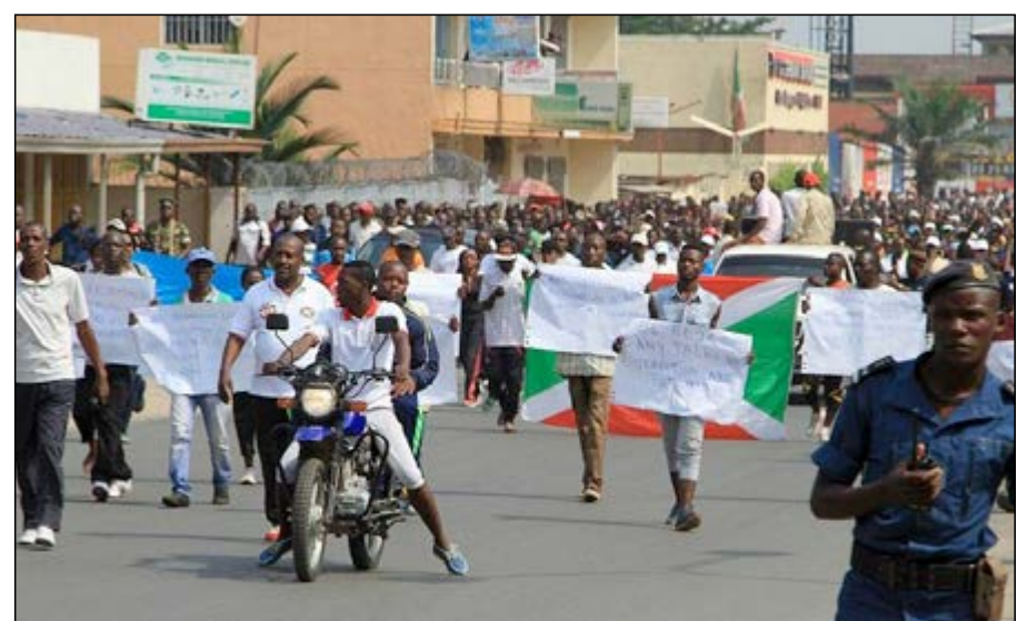
Des manifestants du parti au pouvoir

L'Union européenne, bête noire du pouvoir burundais depuis les sanctions prises contre lui après son refus de négocier avec l'opposition, est accusée d'être "l'instigatrice" des rapports de l'ONU et des ONG, qui dénoncent les graves violations des droits de l'homme dans le pays. « Je mets en garde l'ONU, si elle approuve, si elle adopte ce rapport des experts, elle sera détruite », a lancé le général Ndayishimiye aux manifestants rassemblés sur un terrain de football de Bujumbura. Des dizaines de camions ont acheminé les manifestants de l'intérieur du pays