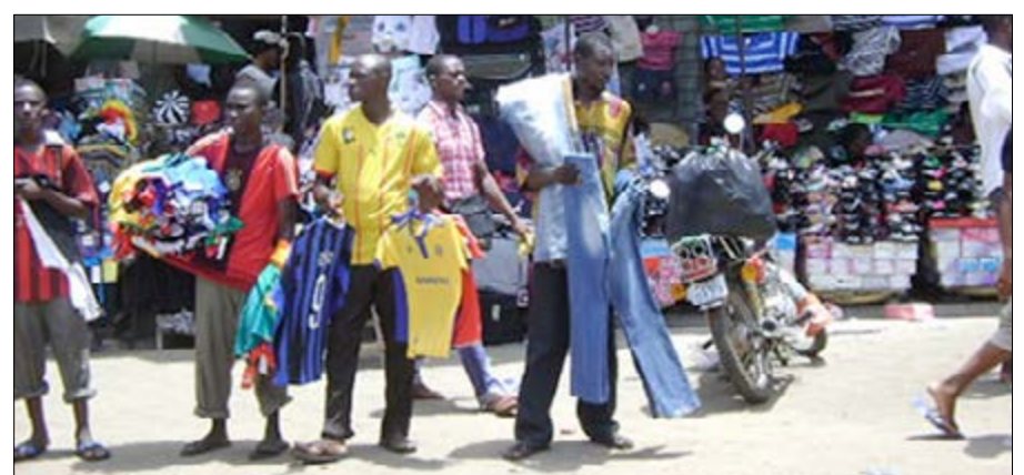
Des commerçants au marché d'Assigamé à Lomé

Depuis, les allocations de capitaux, qui se sont concentrées sur quelques grandes d'entreprises dans le cadre de méga-fusions ou acquisitions, ont permis à la finance internationale de générer plus de profits qu'il n'en était nécessaire. Une situation qui a installé un grand fossé