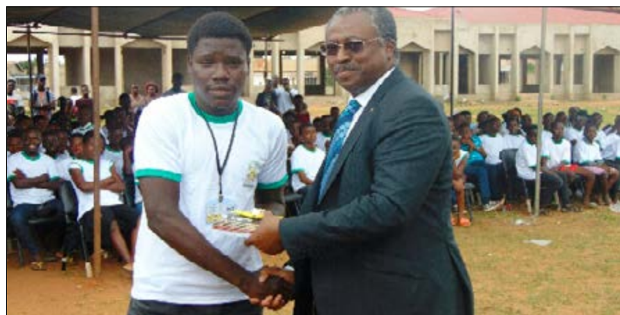
Le ministre Guy Lorenzo remettant un lot de fournitures à l'un des jeunes

Pendant 11 jours (04 au 15 septembre), 532 jeunes vacanciers ont à travers des petits ateliers appris des métiers qui pourront leur servir dans leurs vies professionnelles futurs. C'était dans le cadre du projet vacances utiles et citoyennes qui a connu son apothéose le vendredi 15 septembre dernier à la Maison des jeunes d'Amadahomé.