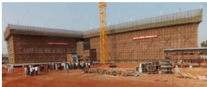
Le chantier du nouveau siège il y a quelques semaines

C'est le souhait exprimé par le président de l'Assemblée nationale, le ministre des Transports et des travaux publics et l'Ambassadeur de Chine au Togo, lors de la toute dernière visite du site de construction du nouveau siège de l'Assemblée nationale togolaise, ce 28 novembre 2017. Après celle de juin dernier. Le chronogramme est respecté ; le taux d'avancement des travaux est "satisfaisant" et le nouveau siège devrait accueillir les députés fin avril 2018. Plus précis, Darna Dramani