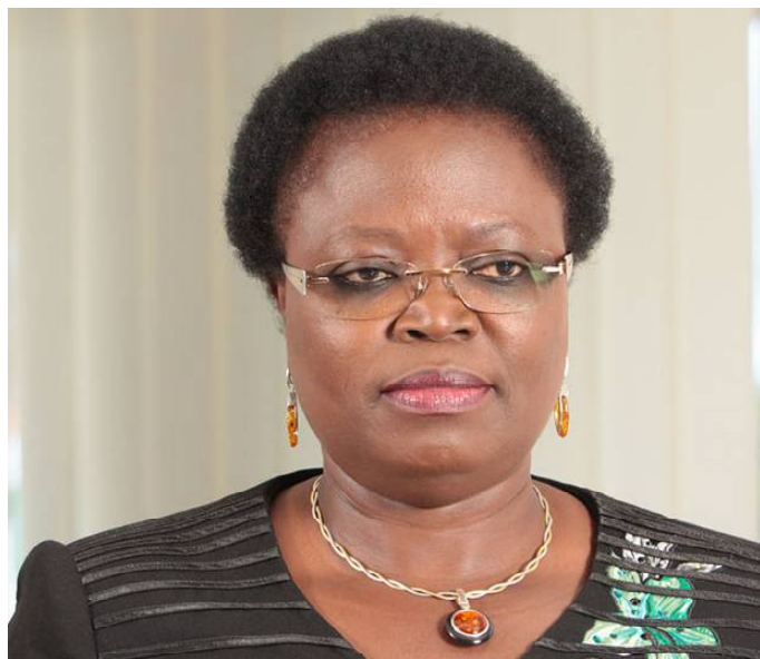
Bernadette Legzim-Balouki, Ministre du Commerce et de la promotion du secteur privé

"Pour atteindre de meilleures performances dans ce domaine, notre pays doit relever le défi de la communication stratégique qui sera varié en fonction du groupe cible, mettre l'accent sur l'amélioration de l'in-