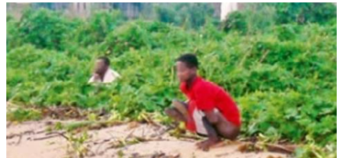
Des poches de défécation à l'air libre à éradiquer

Au Togo, le secteur de l'hygiène et de l'assainissement est caractérisé par un important déficit en infrastructures d'assainissement et un manque de bonnes pratiques d'hygiène et d'assainissement au sein des populations. Seulement 35,6% des ménages utilisent des installations sanitaires améliorées au niveau national et 12% des ménages en milieu rural et semi-urbain, selon un rapport de 2015. Entre-temps, le gouvernement a bénéficié d'un programme du Fonds mondial pour l'assainissement ou Global Sanitation Fund (GSF) pour la promotion de l'hygiène et l'assainissement dans les régions des