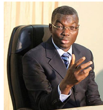
Yark Damehame, Ministre de la Sécurité

Du 21 au 23 novembre à Lomé, la session ordinaire des experts a porté sur le thème "la lutte contre la cybercriminalité dans les Etats de l'espace Entente : expérience ivoirienne pour susciter le partage et la duplication des bonnes pratiques". A la fin, ceux-ci ont été unanimes que l'expérience de la Côte d'Ivoire est une réussite dans la lutte contre la