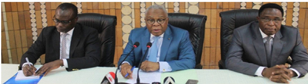
La table d'honneur lors de l'atelier

Au terme du projet de Renforcement des Capacités Nationales et Décentralisées de Gestion de l'Environnement (PRCNDGE), le taux de réussite de ce projet est, officiellement, de 85%. Pour la circonstance les autorités locales, les ONGs et les autres parties prenantes ont pris part à un atelier, présidé le 24 novembre à Lomé par le ministre André Johnson de l'Environnement est des ressources forestières, qui a mis plus l'accent sur les expériences acquises qui doivent être portées à échelle. Débuté le 18 avril 2014 avec l'appui technique et financier du Programme des Nations unies pour le développement (Pnud), le PRCNDGE a pris fin le 31 octobre 2017. Il a permis durant sa phase exécutoire de faire une analyse institutionnelle sur les nouvelles structures de gestion de l'environnement, notamment le Fonds