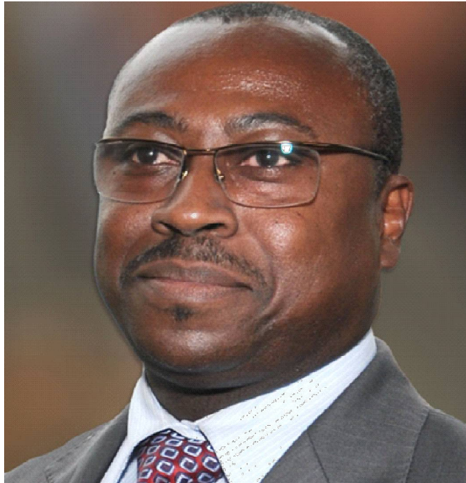
Guy Madjé Lorenzo, Ministre des Sports

En clair, il se pose aujourd'hui la question de la répartition des compétences entre les ministères concernés et la Fédération togo-