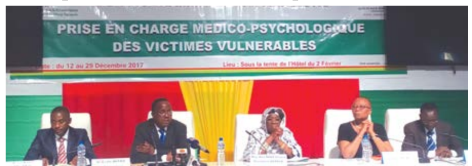
Les premiers responsables de HCCRUN

Des dispositions sont prises avec le Ministère de la Santé afin de faciliter l'accès aux CHU Sylvanus Olympio et Campus, au CHR Lomé-Commune et à l'hôpital de Bè pour les victimes qui nécessiteront des analyses et/ou