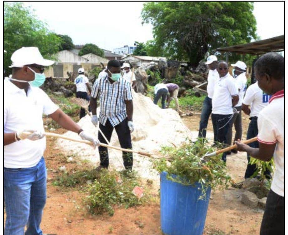
Une partie du staff désherbant la cour de la polyclinique

Quelques jours avant « Atlantique Day », Banque Atlantique a signé avec la Fondation Dr Robert Fiadjoe, une convention portant sur le financement de la rénovation de la polyclinique Gakpodji.