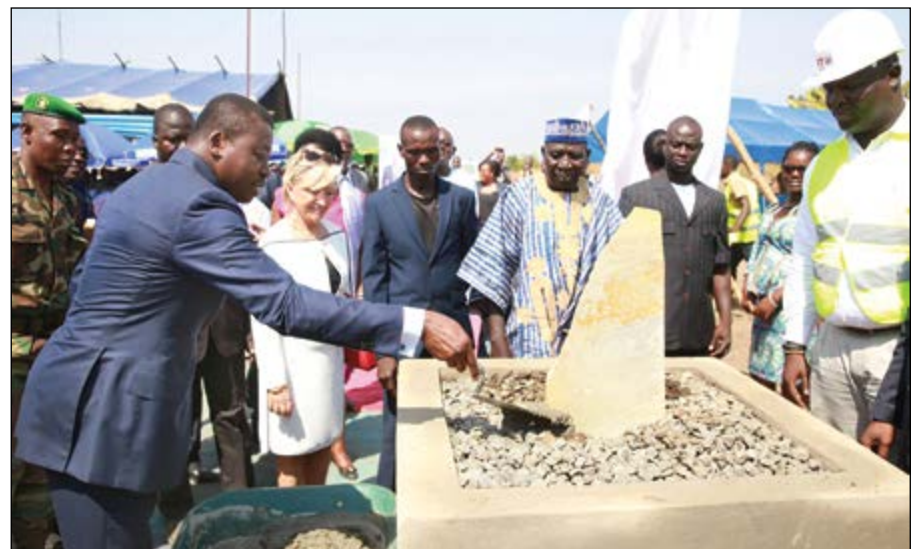
Faure Gnassingbé accomplissant le premier travail de construction de l'IFAD

formation diplômante et des stages de perfectionnement, de doter le pays d'une ressource humaine qualifiée qui participe au développement de l'aquaculture et capable d'entreprendre dans ce domaine.