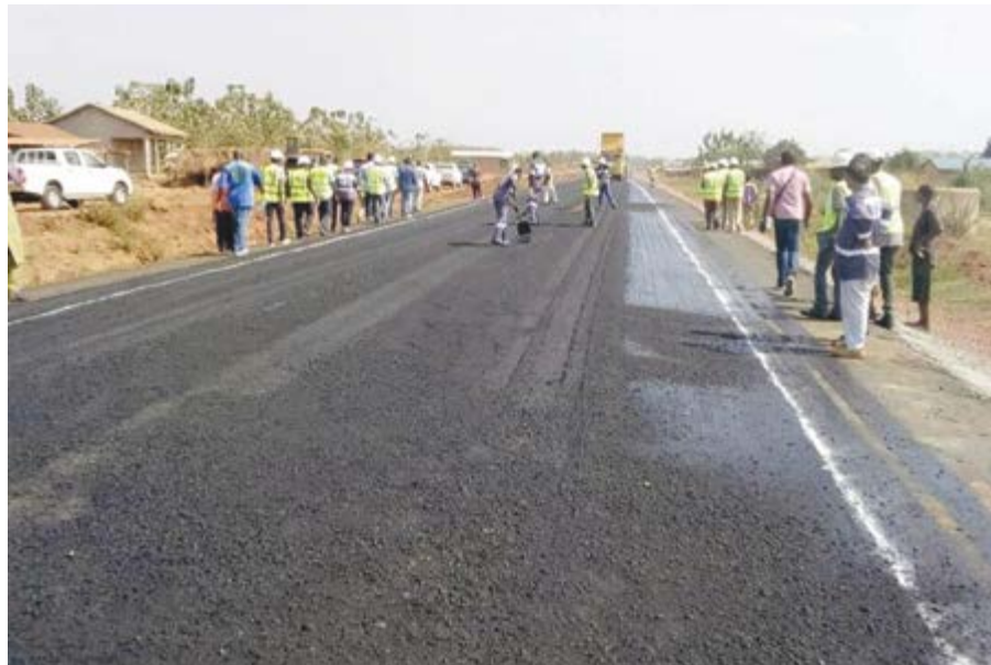
Vue d'une portion de la route

Dans une mise au point, elle condamne « les déclarations de nature à