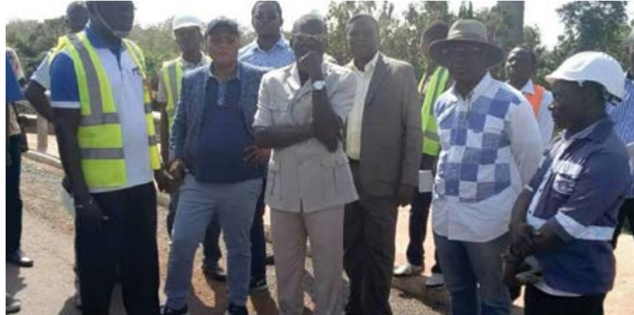
Le ministre Ninsao Gnofam et le patron de MNS entourés de techniciens lors de la visite d'inspection

C'est une affaire qui défraie abondamment la chronique, suscitant de nombreux rebondissements. Il s'agit des polémiques autour de l'exécution des travaux de bitumage du tronçon Notsè-Tohoun-Frontière Benin.