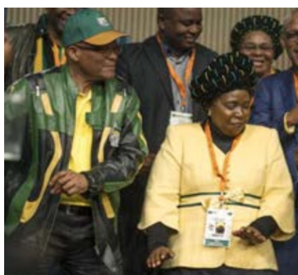
Jacob et Dlamini Zuma

La partie est néanmoins loin d'être gagnée pour Cyril Ramaphosa, qui