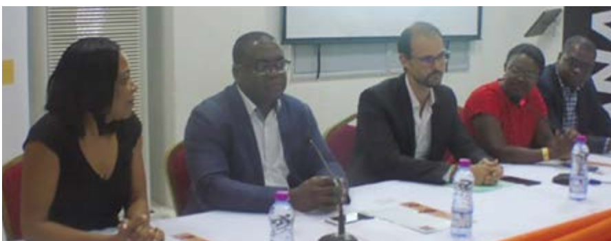
Des responsables de CANAL +

La société Canal+ Togo a lancé une offre promotionnelle devant permettre aux Togolais de s'offrir le décodeur Canal+ à seulement 5 000 F Cfa. L'annonce a été faite le 28 novembre dernier sur le site de la 14e Foire internationale de Lomé.