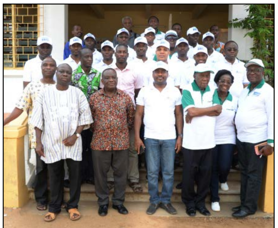
R. Zakari Photo de famille de Banque Atlantique et la Fondation Dr Robert Fiadjoe