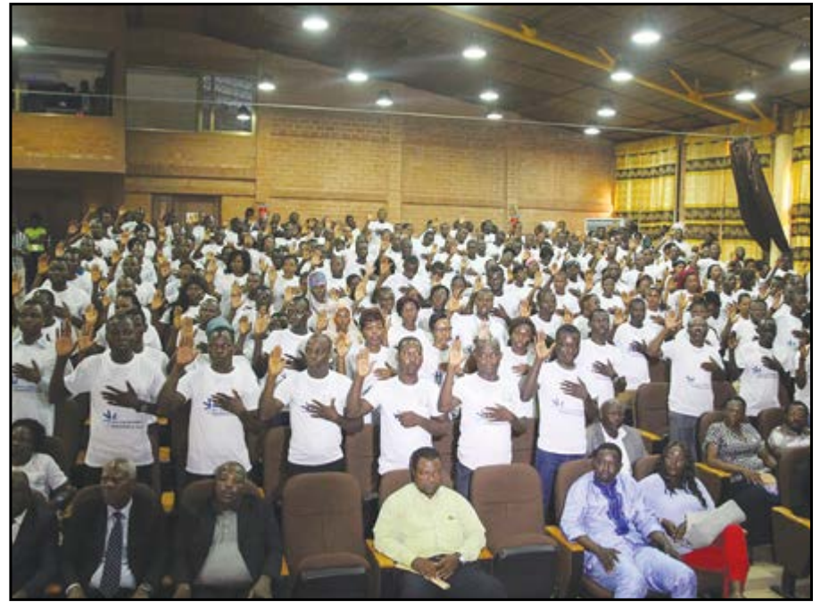
Des volontaires prenant leur serment

L'Agence nationale du volontariat au Togo (ANVT) a accueilli de nouveaux volontaires. En effet, 500 nouveaux volontaires ont prêté serment hier mercredi à Lomé dans le cadre de la cérémonie de la 17ème édition de la journée internationale du volontariat.