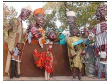
Des marionnettes à fil

Dans son bilan du festival, la promotrice,