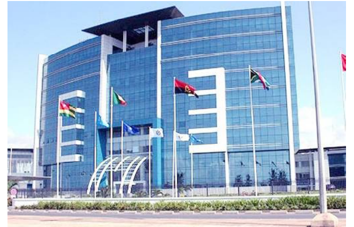
Siège du groupe Ecobank à Lomé

Principal arrangeur de ce prêt syndiqué, FMO a apporté 58,5 millions de dollars tandis que d'autres IFD et investisseurs à impact ont contribué de la manière suivante : DEG – Deutsche Investitions- und Entwicklungsgesellschaft mbH (21 millions d'euros), Proparco (21 millions d'euros), la Société belge d'investissement pour les pays en développement (BIO) (15