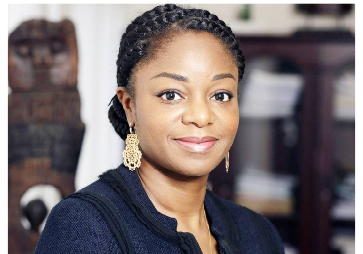
Cina Lawson, Ministre de l'Economie numérique

Les travaux sont répartis en un lot unique clé en main. Pêle-mêle, on y retrouve des travaux de terrassement, voirie et réseaux divers, gros œuvre, étanchéité toiture, menuiserie extérieure, espaces verts et second œuvre (génie civil) ; courants forts et faibles, groupes électrogènes, climatisation et ventilation, plomberie et sanitaires, système de sécurité incendie, plancher techni-