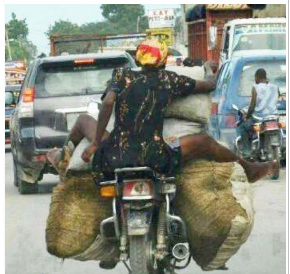
Donnez une légende à cette photo