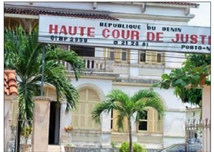
Haute Cour de justice du Bénin

Mais jusque-là, les interprétations de ces actions à l'endroit d'anciennes personnalités du régime de Yayi Boni vont bon train. Pour l'avocat de l'ex-ministre des Finances, « la persécution des hommes politiques continue ». De