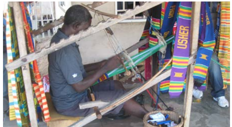
Un artisan au travail

des Zones Franches (SAZOF), a pour objet de faciliter l'installation des unités de production en Zone Franche. Elle assiste les promoteurs dans l'accomplissement des différentes formalités et dans leurs rapports avec les Administrations et les Entreprises de services publics.