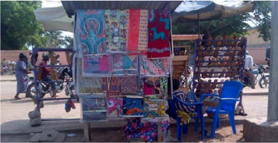
Un point de vente de pagnes et de chaussures

La Zone Franche vise à stimuler au Togo le développement des activités de transformation et de services pour l'exportation en garantissant, aux entreprises opérant sous ce régime, les meilleures conditions de compétitivité.