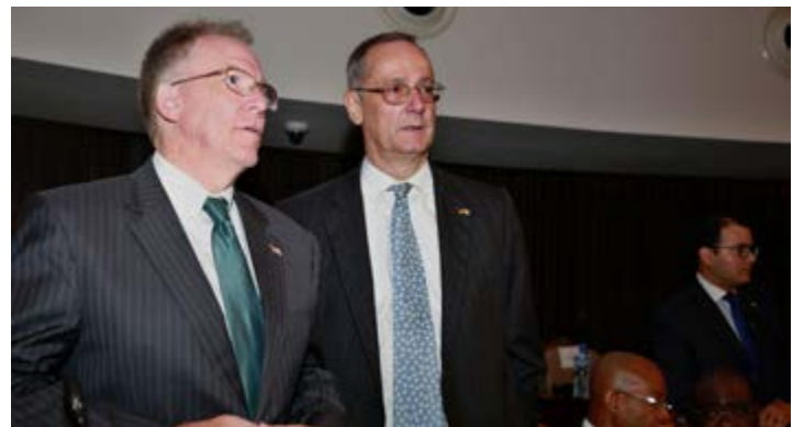
Deux diplomates du groupe des 5