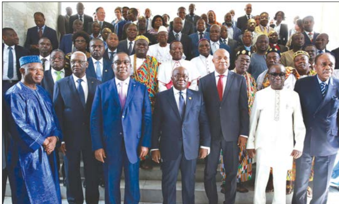
Photo de famille à l'ouverture du dialogue

Aussitôt entamées, aussitôt suspendues. Les discussions inter togolaises qui ont effectivement ouvert leur porte hier lundi 19 février entre les représentants du parti au pouvoir, Union pour la République (UNIR) et ceux de la coalition des 14 parties politiques de l'opposition sous la médiation du président Ghanéen, Nana Akufo-Addo, ont été suspendues hier à 23h00 pour reprendre vendredi prochain à 14h. La raison de la suspension ? Les mesures d'apaisement que l'opposition réclame toujours.