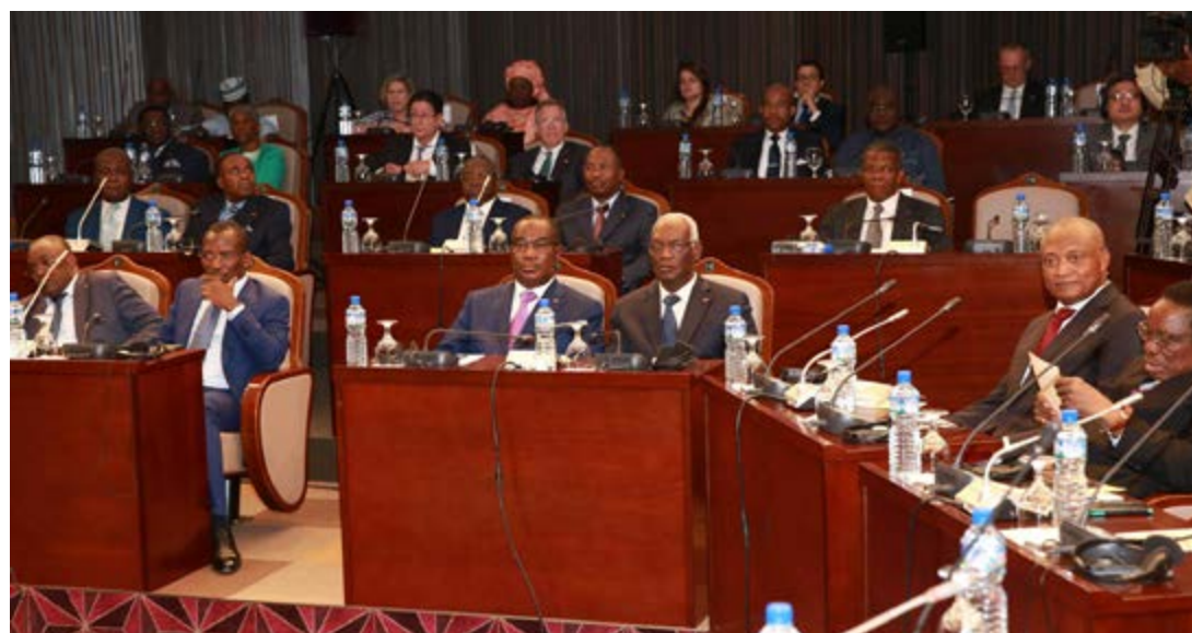
Vue partielle des travaux d'ouverture