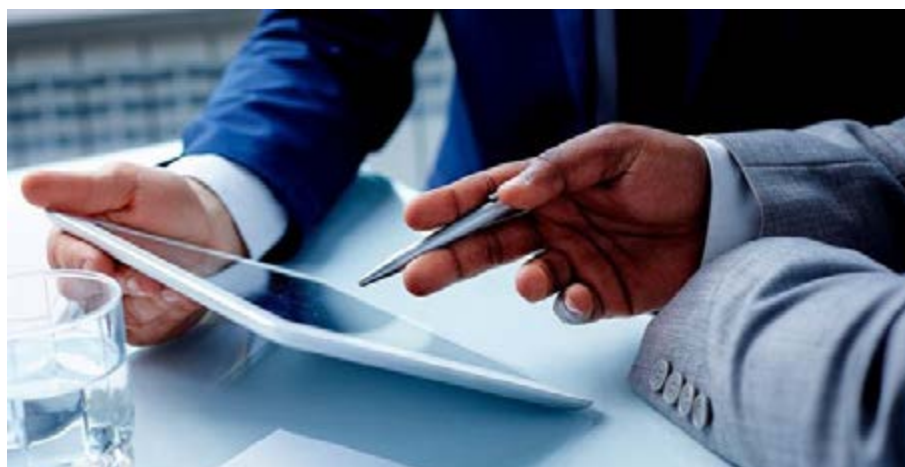
Elaboration d'un projet

Le gouvernement togolais veut se faire une idée précise des entreprises opérant sur toute l'étendue du territoire national, aussi bien dans le formel que dans l'informel, leur répartition par secteur d'activité et par spécialité, le nombre des petites et moyennes entreprises et leur contribution au PIB.