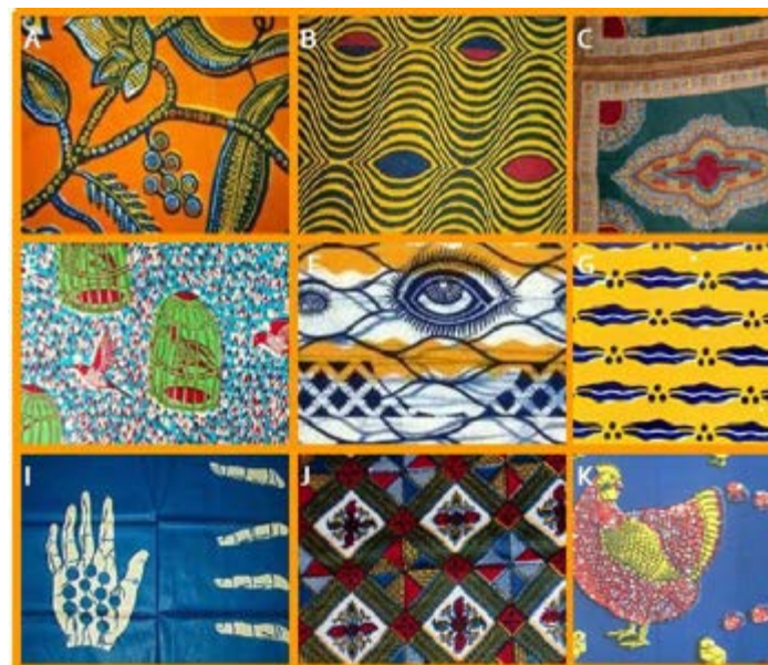
Des motifs de pagne