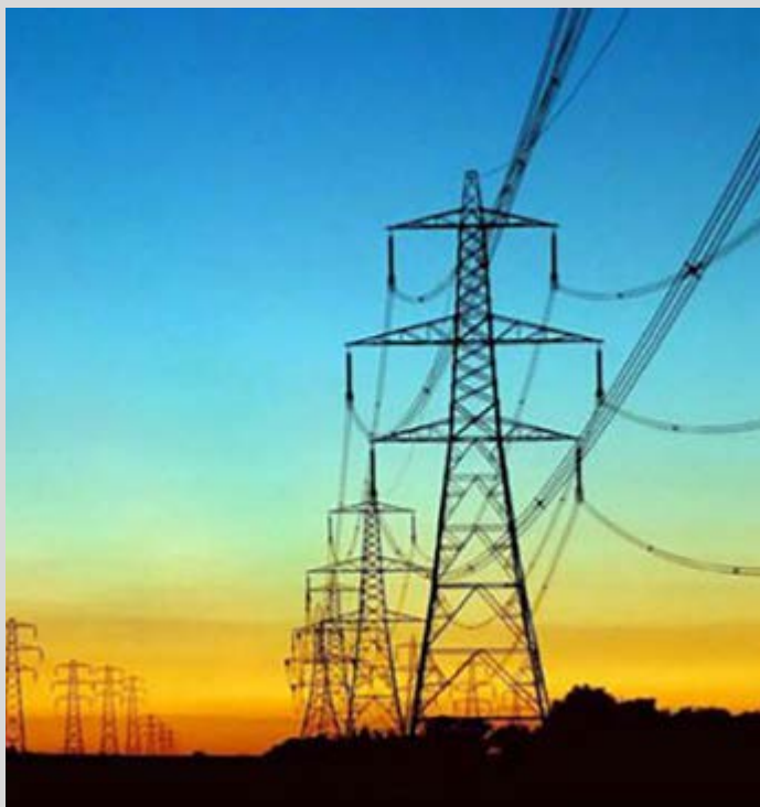
Des hauts lignes de courant électrique

Selon le dernier rapport du forum économique mondial et du cabinet international Accenture Strategy, l'Etat togolais a fait des efforts significatifs dans le classement de couverture nationale énergétique, sur les 10 dernières années. Des résultats obtenus grâce à plusieurs projets mis en œuvre par le gouvernement.