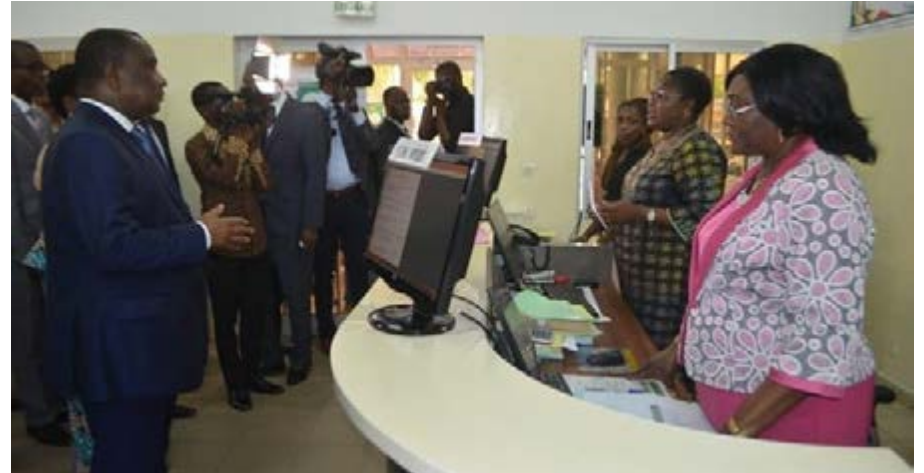
Visite du premier ministre dans une entreprise