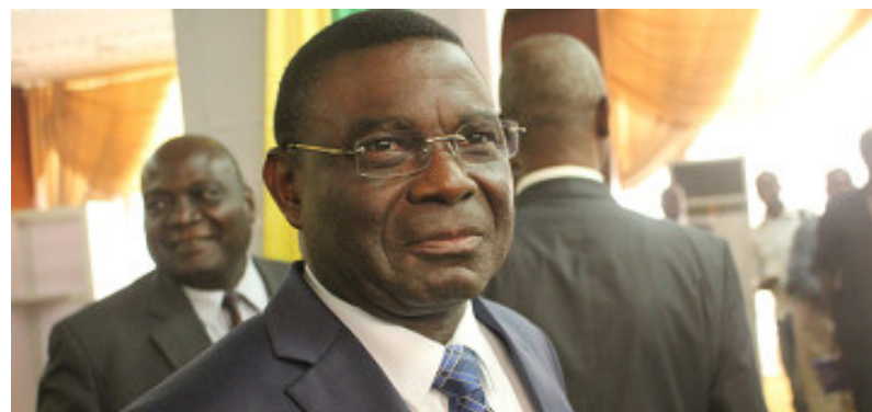
Komi Tchakpélé, ministre des enseignements primaire et secondaire

Une grève visiblement jugée de trop par les élèves, finalement des victimes collatérales des appréhensions entre les autorités et leurs professeurs dont ils réclament le