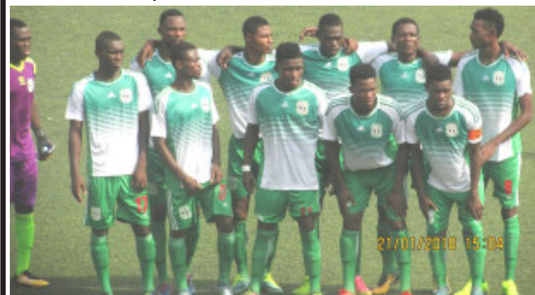
Agaza FC de Lomé

Le championnat national de football de première division est entré dans sa seconde phase décisive. Toutes les formations après la trêve sont revenues avec assez de nouveaux visages dans les différents effectifs, un fait majeur à considérer dans la nouvelle dynamique de la compétition. Pour le 17 ème chapitre, il faut retenir quatre situations notamment l'avance que prend Koroki sur ses poursuivants, la série noire qui continue pour l'Asck, la série rose pour les Anges de Notsè et la descente aux enfers des scorpions noirs de Tokoin.