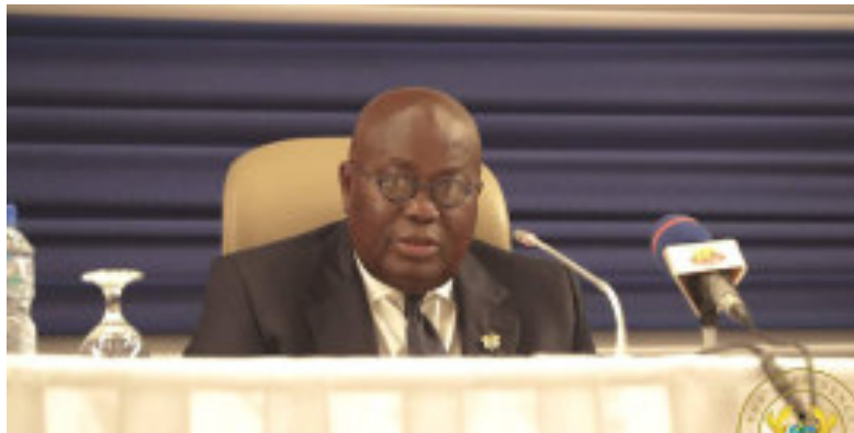
Nana Akuffo Addo, pdt du Ghana

de choisir leurs dirigeants, d'une manière transparente et libre... », a lancé, d'entrée, le Chef de l'Etat ghanéen. Et de clarifier sa mission qu'il souhaite fructueuse : « Je ne suis pas togolais et donc, je