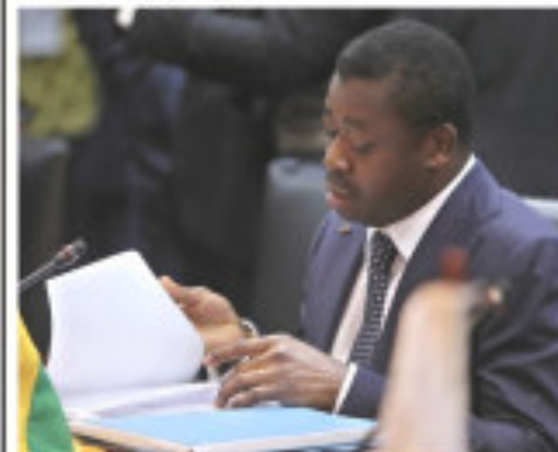
Faure Gnassingbé, pdt en exercice de la CEDEAO