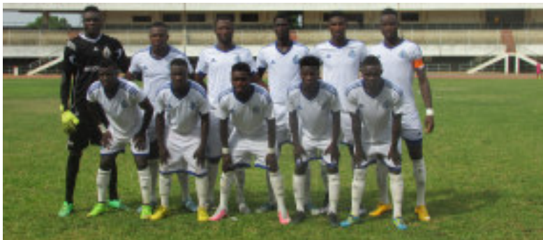
L'As Togo-port