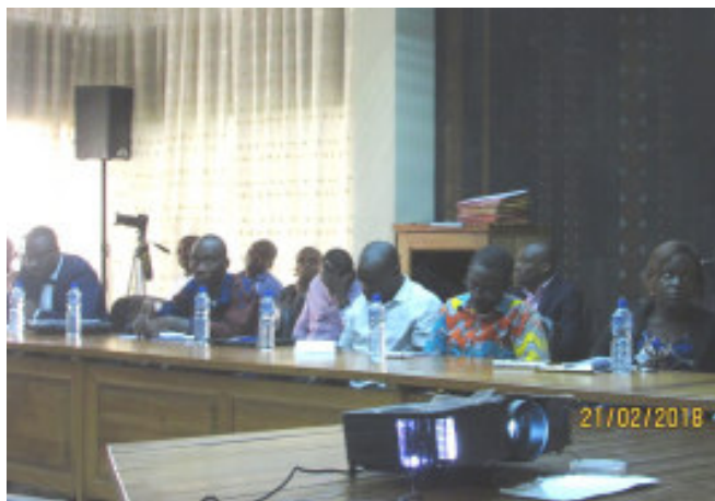
Vue partielle des participants à l'atelier

L'amélioration du climat des affaires au Togo est un cheval de bataille du gouvernement qui multiplie les réformes. C'est donc pour assurer une meilleure coordination de son action que La cellule Climat des Affaires(CCA) a été mise en place par décret du 29 septembre 2017. En vue de cerner tout le contour des réformes mises en œuvre, la cellule organise depuis hier un atelier de formation et d'information à l'attention des médias sur le thème « Climat des affaires au Togo : concepts, réformes et perspectives.