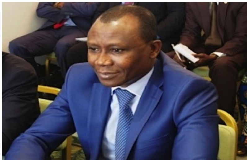
Sani Yaya, ministre de l'Economie et des Finances

La dette extérieure totale se chiffre à 497,8 milliards de francs Cfa en 2017, représentant 25,2% du portefeuille de la dette totale. Un repli de 21,0 milliards de francs Cfa par rapport à fin décembre 2016.