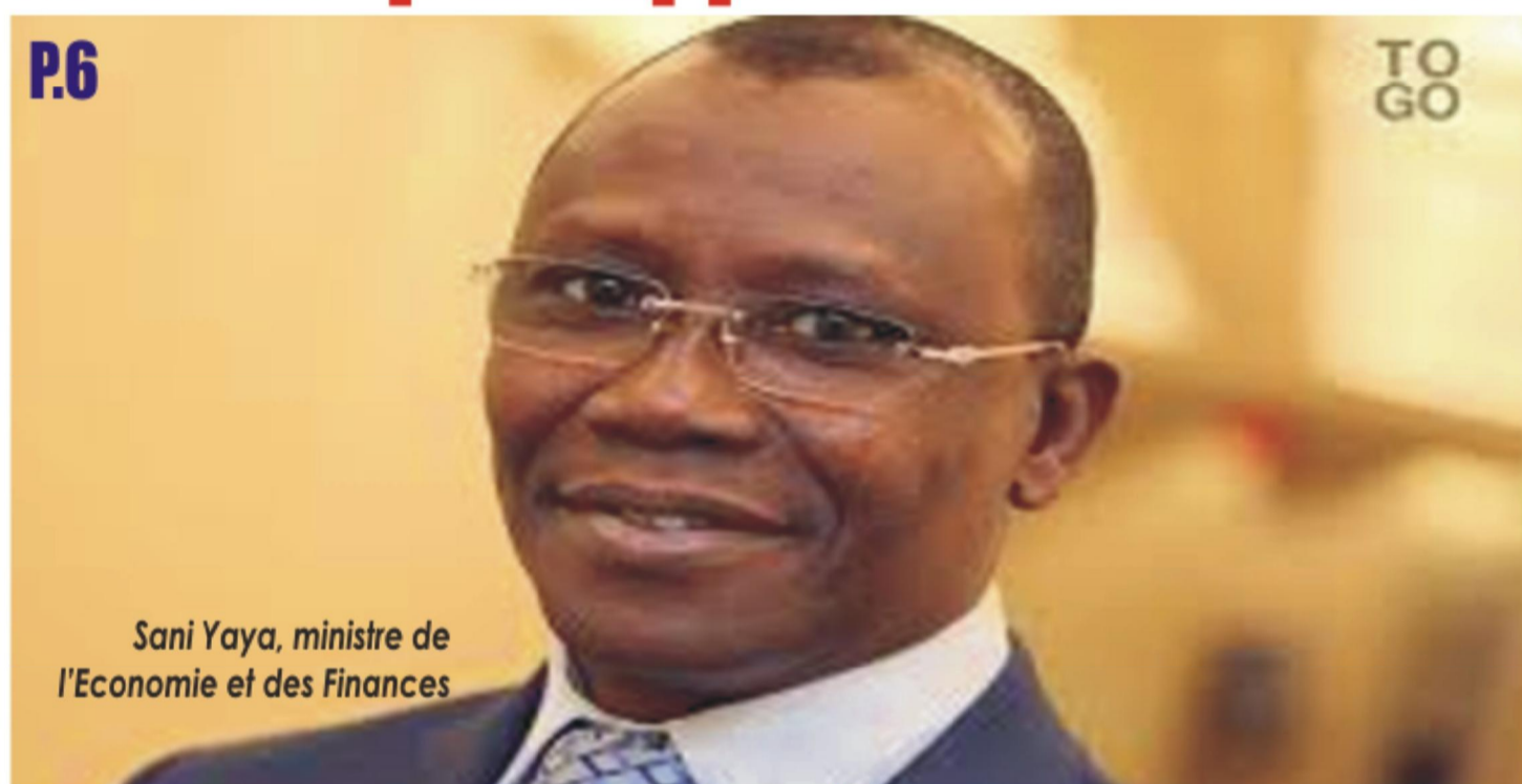
Sani Yaya, ministre de l'Economie et des Finances