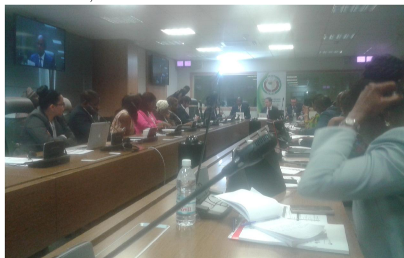
Une vue de la salle lors de l'atelier au siège du Groupe de la BAD.

Notons que le Ghana, la Côte d'Ivoire, le Nigéria et le Sénégal représentent une part importante de l'ensemble de l'infrastructure énergétique régionale, des consommateurs et des entreprises énergétiques dirigées par des femmes.