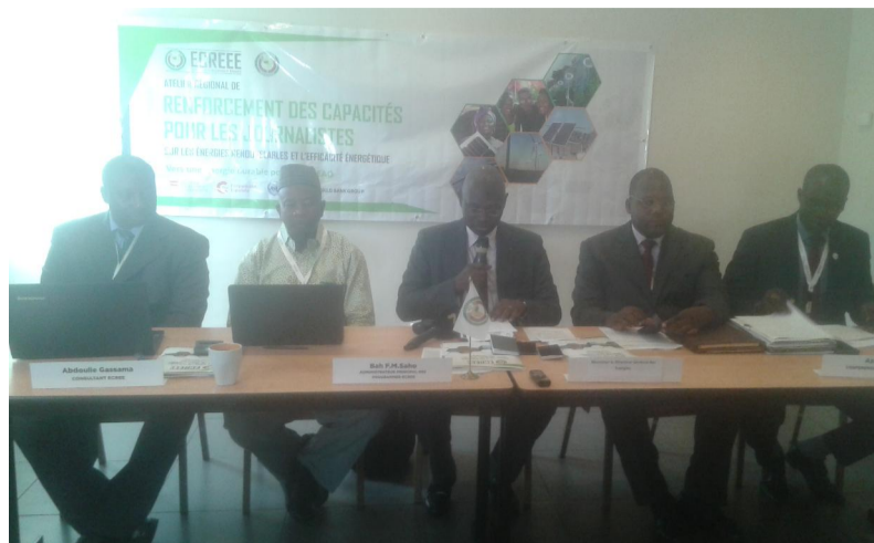
La table d'honneur lors de l'ouverture de l'atelier à Abidjan.