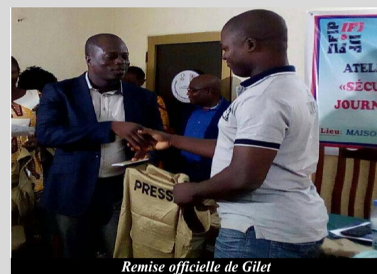
Remise officielle de Gilet

Cette rencontre de deux jours a permis à plus d'une vingtaine de journalistes togolais de se familiariser avec les textes fondamentaux régissant leur profession sans oublier les notions en lien avec le genre et la sécurité sur lieu de travail, notamment en période électorale. Plusieurs modules à savoir : " Accepter la différence, faire face à la discrimination ", " Droit des journalistes et sécurité de genres ", " Exercice sur l'intégration du genre : Faire notre propre analyse du genre ", " Le travail du journaliste en période électorale au regard de la loi électorale et des textes fondamentaux des médias ", " Médias et forces de sécurité n période électorale