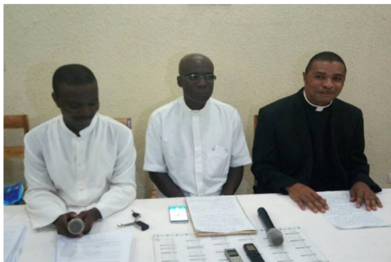
Les Prêtres frondeurs lors de leur conférence de presse à Lomé.

Mais il fait noter que dans l'Église, la sanction est vraiment le dernier recours, lorsque le délinquant persiste dans son état. Au