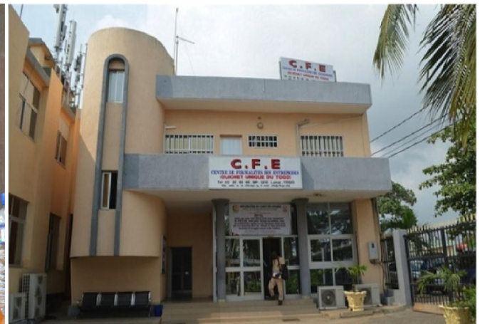
Le siège du CFE à Lomé.