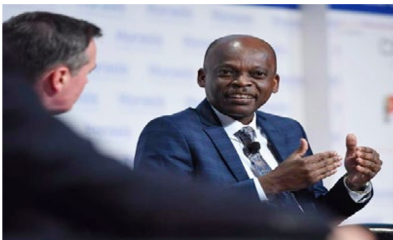
Le ministre togolais des affaires étrangères, Robert Dussey, participe du 5 au 8 mai à Cascais