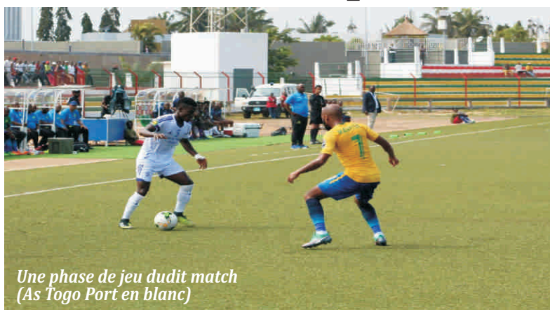
Une phase de jeu dudit match (As Togo Port en blanc)

A près sa défaite à Lomé, contre Horoya de la Guinée, (1-2) et celle à Casablanca contre Wydad Athletic Club (0-3), l'équipe togolaise de l'AS Togo Port s'est reprise cet après-midi lors de la réception de Mamelodi Sundowns d'Afrique du Sud au stade municipal de Lomé.