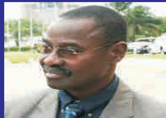
Prof Moustapha Mijiyawa, ministre de la Santé