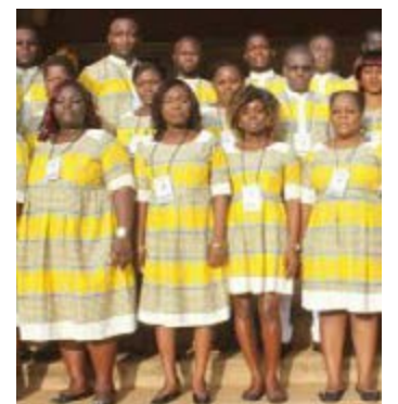
Le groupe la Renaissance

Au départ, le groupe « La Renaissance » était