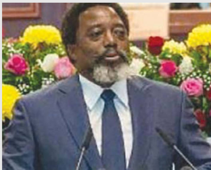
Joseph Kabila, président de la RDC

Par ailleurs, il n'a pas évoqué son avenir politique. Comme dans ses précédents discours, Kabila a affirmé que le cap vers les élections de décembre reste maintenu : « Notre engagement à respecter la Constitution demeure lui aussi non équivoque. »