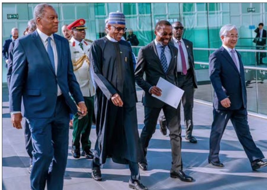
Visite de Buhari à la CPI

accusés poursuivis, ce sont des Africains. Et cela porte atteinte à son universalité. Ce caractère sélectif des personnes africaines qui sont accusées constitue à mon avis un des talons d'Achille de la CPI », reprend Nicolas Tiangaye. « La Cour se penche maintenant sur des dossiers qui vont au-delà de l'Afrique et il faut tenir compte du fait que la plupart des situations africaines dont la cour est saisie, c'était les Etats africains eux-mêmes qui ont décidé qu'ils avaient besoin de l'aide et de l'appui de la Cour parce qu'ils n'avaient pas la