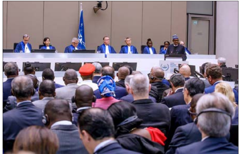
Buhari à la CPI

États souverains qui ont ratifié le Statut de Rome. Le Statut de Rome est le traité international