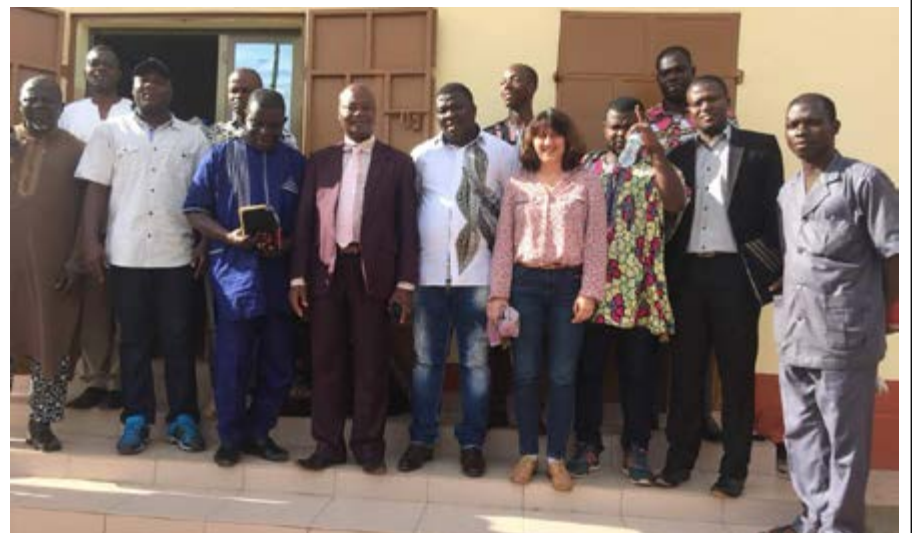
Photo de famille du conseil et acteurs de la filière soja

production, transformation, et exportation de la filière, d'échanger sur le meilleur système de contractualisation à envisager pour le compte de la campagne en cours et pour les années à venir. Le système devrait, d'après les experts du ministère du Commerce, permettre aux différents acteurs de tirer profit des opportunités de commercialisation sur le marché local et international. Plusieurs points clés de développement de la filière ont meublé les échanges entre les participants à Kpalimé. Au menu des discussions, il était question pour les acteurs du secteur de plancher sur le mécanisme approprié de fixation des prix du soja graine, face aux enjeux du