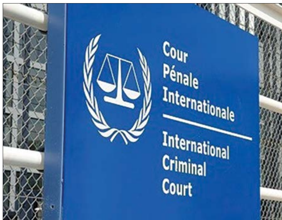
Enseigne de la CPI

Les Américains, tout comme les Russes et les Chinois, ont refusé d'adhérer au Statut de Rome au nom de la conservation de leur souveraineté. Même les Etats qui ont accepté de se soumettre à la justice de la Cour ont amendé leurs codes pénaux pour assurer que leurs ressortissants ne soient convoqués à La Haye qu'en dernier recours. Car si aucun