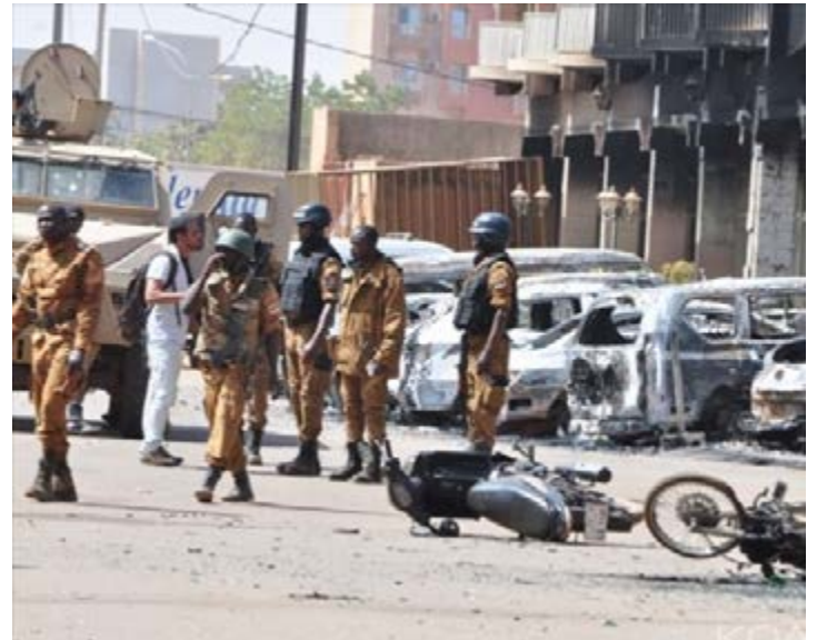
Une opération militaire à Ouagadougou (Photo d'archive)

Les Forces de défense et de sécurité ont entrepris le ratissage de la région à la recherche des « criminels ». Un pasteur et quatre membres de sa famille, enlevés début juin à Bilhoré, un village du Nord de la province de Soum, par des individus armés, sont toujours