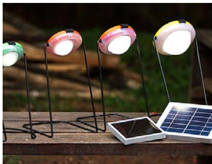
Des kits de Greenlight Planet

La société britannique BBOXX, chargée de l'opérationnalisation du projet d'électrification du gouvernement togolais œuvre fortement en faveur de l'extension de l'énergie électrique pour les ménages qui ne sont pas encore desservis. Un peu plus six mois après le lancement officiel de ses activités au Togo, la société annonce avoir doté 12 mille Togolais en énergie solaire à travers la mise en service de 2400 kits.