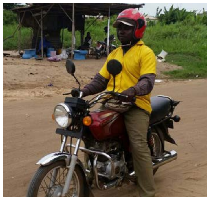
Un conducteur de taxi moto

L'application qui n'est pas encore lancée au grand public, fait l'objet de test, afin de corriger les dernières imperfections, souligne