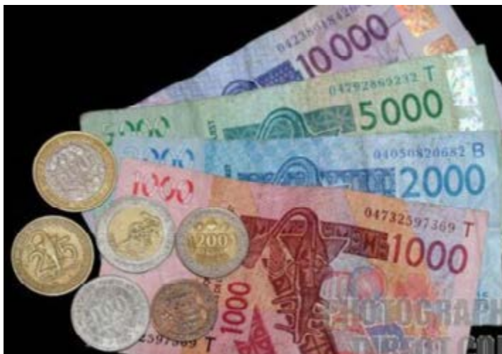
Pièces de monnaie et billets de banque

C'est tellement devenu agaçant, des commerçants, surtout les femmes qui rejettent des pièces et billets pour leurs aspects. Des clients qui rejettent aussi de l'argent, parce que craignant de ne pas pouvoir le dépenser. Le phénomène a tellement pris de l'ampleur que désormais avant d'accepter une pièce ou un billet quelconque, chacun scrute minutieusement l'argent qui vient de lui être remis avant de le mettre dans sa poche. A un moment donné, la situation a commencé à inquiéter sérieusement la population et les autorités qui de leur côté jusque-là n'ont pu rien faire, malgré les dénonciations. Malgré des sensibilisations et le comportement correct de certains citoyens qui ont décidé de ne pas rejeter les pièces et billets d'argent, quels que soient leurs aspects,