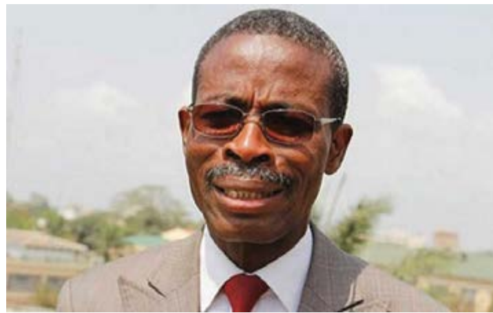
Me Fiatuwo Kwadjo Sessenou, ministre de l'Urbanisme, de l'Habitat et du Cadre de vie

même temps qu'elle rassure le propriétaire sur son investissement, la réforme restaure donc la confiance entre les clients et les banques, en permettant à ces dernières de s'investir davantage dans le financement des opérations à long terme, en l'occurrence des opérations de crédit au logement décent et autres formes d'hypothèques », a