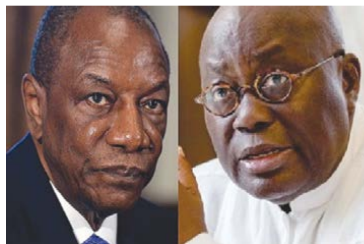
Les présidents Condé et Akufo-Addo, les facilitateurs

C'est d'ailleurs le visage qu'affiche la classe politique dans son ensemble. Face à cette situation, la facilitation elle-même