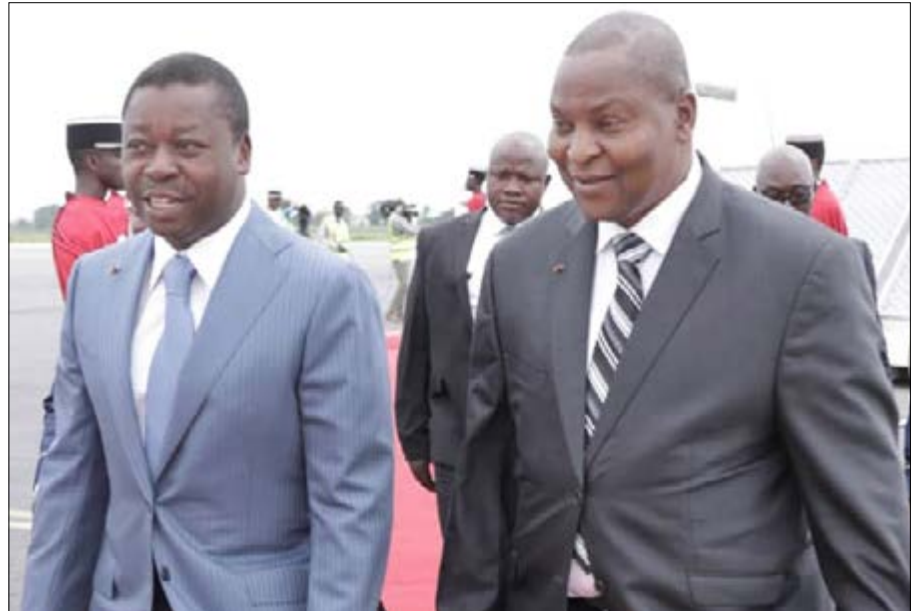
Faure Gnassingbé accueillant Faustin-Archange Touadera

Lomé les 30 et 31 juillet 2018 a démarré hier à l'aéroport international Gnassingbé Eyadéma.