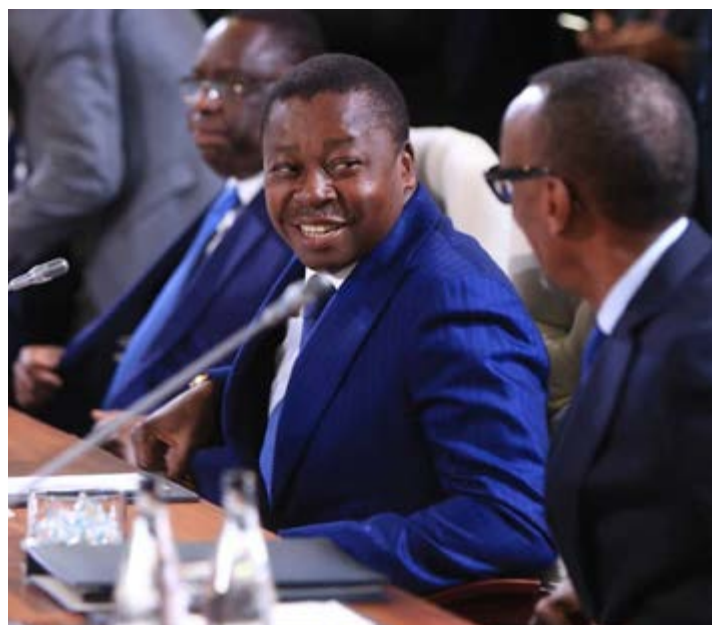
Faure Gnassingbé entouré de ses pairs

Moins de trois mois après son lancement à Shanghai, la NBD a annoncé avoir émis