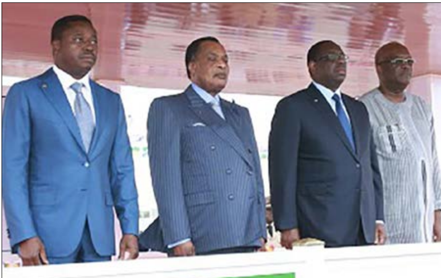
Faure Gnassingbé, Sassou N'guesso, Macky Sall et Roch Christian Caboré

Tenue de trois sommets en deux jours au Togo Lomé, capitale africaine de la diplomatie de la paix et du développement