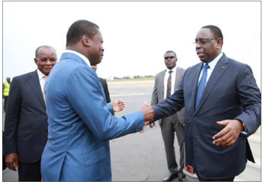
Le président togolais et Macky Sall du Sénégal

Le chef de l'Etat sénégalais, SEM Macky Sall est aussi arrivé hier à Lomé où il assistera avec ses homologues de la sous-région au sommet conjoint Cedeao - CEEAC consacré à la paix, la sécurité, la stabilité et la lutte contre le terrorisme et l'extrémisme violent. Il a été accueilli à sa descente d'avion