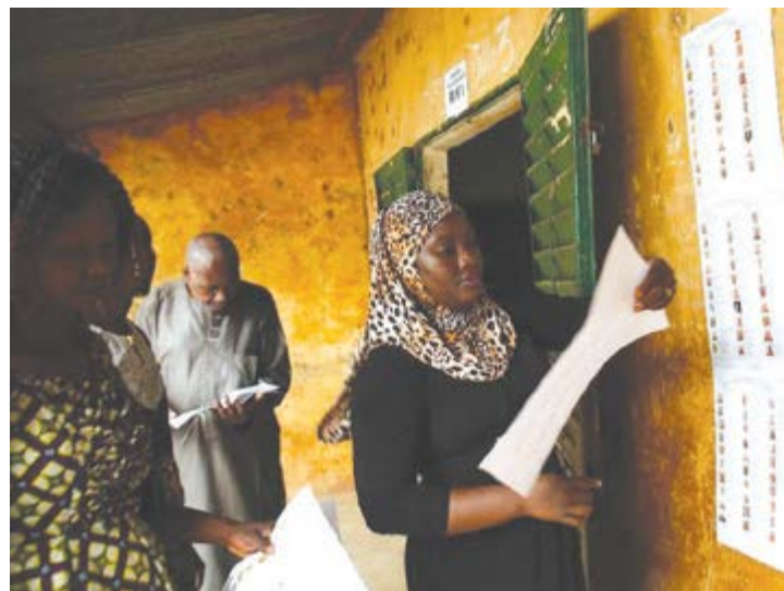
Des électeurs devant un bureau de vote

Plus de 8 millions de Maliens étaient appelés aux urnes hier dimanche pour élire celui qui devrait diriger leur pays pour les 5 prochaines années. Ils sont au total 24 candidats. Mais selon plusieurs analystes, le prochain président du Mali pourrait être le président sortant candidat à sa propre succession, Ibrahim Boubacar Keita (IBK) ou le chef de file de l'opposition, Soumaïla Cissé.