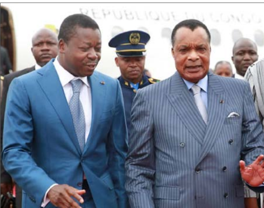
Accueil du président congolais, Sassou N'guesso

Sur le tarmac de l'aéroport de Lomé, les avions se sont succédé. Juste après le président burkinabè, c'est l'avion de la République du Congo s'est immobilisé.