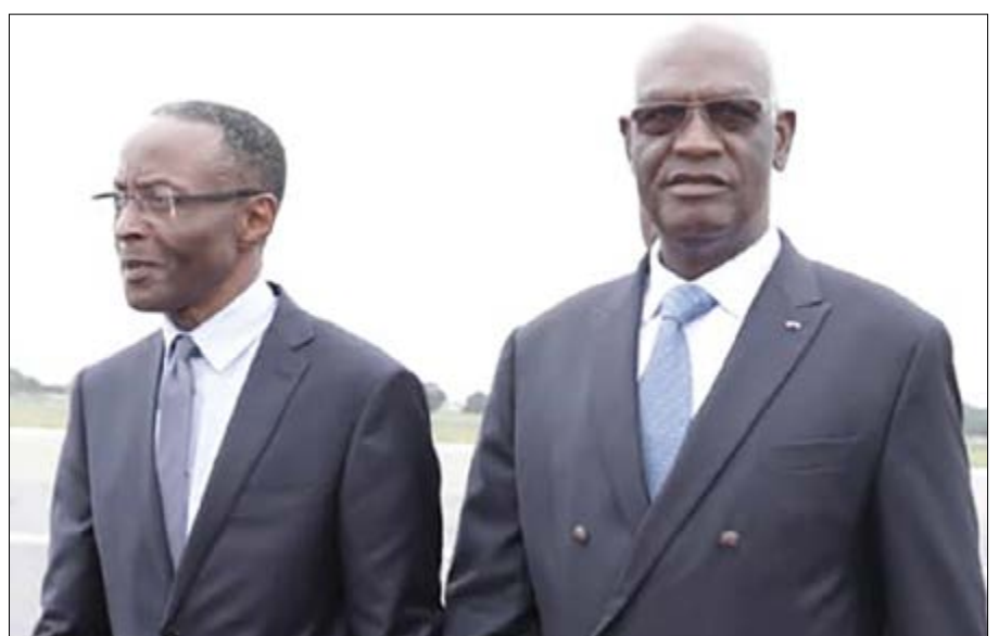
Le Vice-président de l'Angola Bornito De Souza accueilli par le PA Dramani

La lutte contre le radicalisme et l'extrémisme violent en Afrique de l'ouest et en Afrique centrale ne se fera pas sans l'Angola. Son Vice-Président Bornito de Sousa est arrivé dans la capitale togolaise hier dimanche matin pour