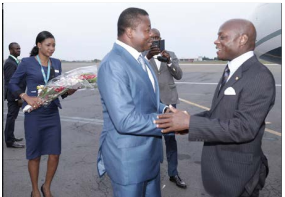
Le président Bissau guinéen, José Mario Vaz à son arrivée à Lomé

La Guinée Bissau est l'un des pays à qui le mandat du président Faure Gnassingbé à la tête de la Conférence des Chefs d'Etat et de gouvernement de la Cedeao a concrètement et directement profité.