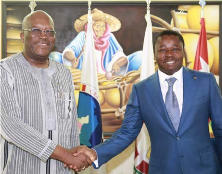
Poignée de main entre Kaboré et Faure Gnassingbé

Accueilli à sa descente d'avion par son homologue togolais et Président en exercice de la Conférence des Chefs d'Etat et de Gouvernement de la Cedeao Faure Gnassingbé, le Président burkinabè Roch Kaboré a