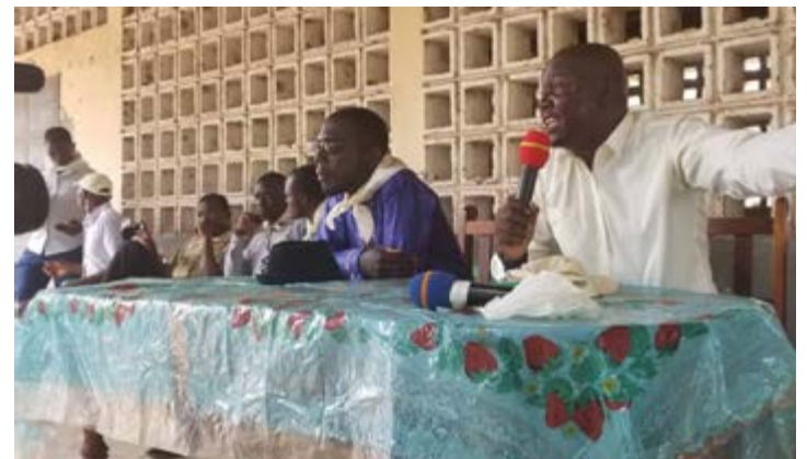
Capture d'écran 2018-07-29 à 23.06.41