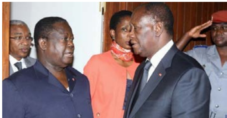
Bédié et Ouattara

18 personnalités se retrouvent, après affichage des listes des candidats pour les municipales d'octobre prochain, aussi bien sur la liste du PDCI-RDA et du RHDP, nouveau regroupement politique boycotté par le PDCI. Convoqués pour s'expliquer sur ce cas, les intéressés n'ont pas voulu s'exprimer sur la question devant la presse et ont préféré entretenir le flou autour de la question.