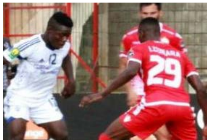
Une action de jeu du match d'hier