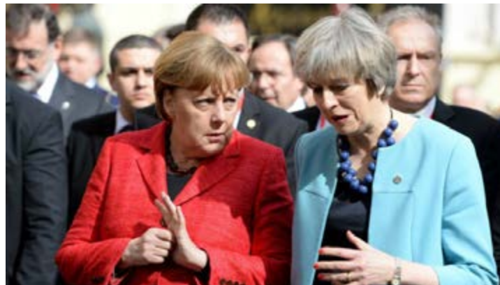
Merkel et May

Et pourtant, à y voir de près, la Première ministre britannique cherche de nouveaux alliés commerciaux avec qui