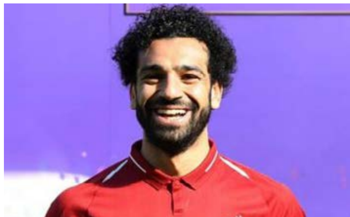
L'Égyptien Mohammed Salah

M ohamed Salah : le plus grand pharaon du foot Mohamed Salah, de son vrai nom Mohamed Salah Ghaly est un footballeur égyptien né le 15 juin 1992 à Basyoun en Egypte. Il évolue actuellement au poste d'ailier droit au FC Liverpool. Sacré Ballon d'or africain 2017 par la CAF, il est actuellement l'un des meilleurs joueurs de la Premier League et actuellement nommé dans la catégorie meilleur joueur Uefa 2017, derrière Cristiano Ronaldo et Lucas Modric. En 2012, il est le seul représentant africain au Golden Boy, trophée qui récompense