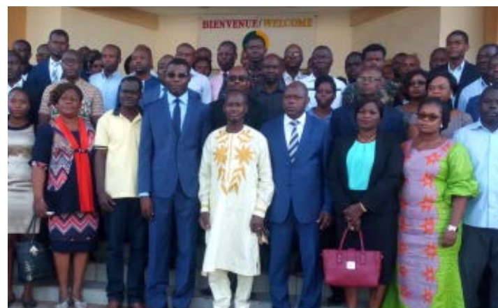
Photo de famille des participants au séminaire

En organisant cet atelier lundi dernier, l'objectif de la CNSS était de convier les entreprises privées à prendre à bras le corps, leurs obligations en matière de sécurité et de santé sur les lieux de travail. Pour la CNSS,