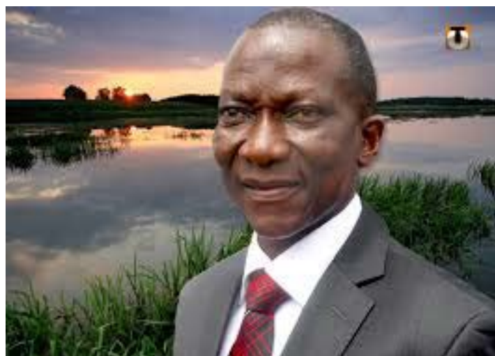
Ouro-Koura Agadazi, Ministre de l'agriculture

Ce financement a permis d'accorder un appui de 3 500 000 FCFA à chacun des 48 éleveurs retenus dans la région Maritime. Ils font partie des 304 éleveurs qui vont développer plusieurs activités sur toute l'étendue du territoire