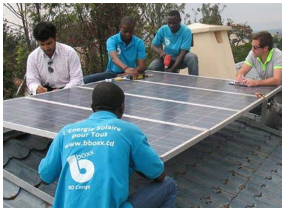
Installation d'un panneau solaire par BBOXX

Le projet vient de d'obtenir également le soutien de l'Union Européenne à travers le programme de financement Distributed Energy Service Companies (DESCO) avec l'installation très prochaine de 10.000 systèmes solaires