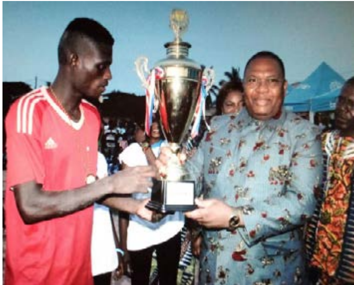
Remise de la coupe à Juventus

Pour ce qui est du spectacle, cette finale en a offert. L'équipe de la Juventus conduite par Amavi Agboti s'est montrée plus joueuse et réaliste que celle de Racine club de Yokoè entraînée par Homon Didier. Après plus d'un quart d'heure de jeu quelque peu