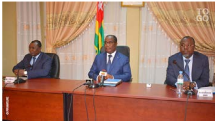
Le Premier ministre (au milieu) entouré du ministre de l'économie et des finances et celui des mines

entreprises minières dans le développement social et régional, l'opérationnalisation des organes de mise en œuvre de l'Itie, la modernisation du code minier togolais conformément aux directives de l'Union économique et monétaire ouest africaine (Uemoa). Ces initiatives de l'Etat ne vont pas s'arrêter là. A cette rencontre Selon Klassou a souligné qu'«