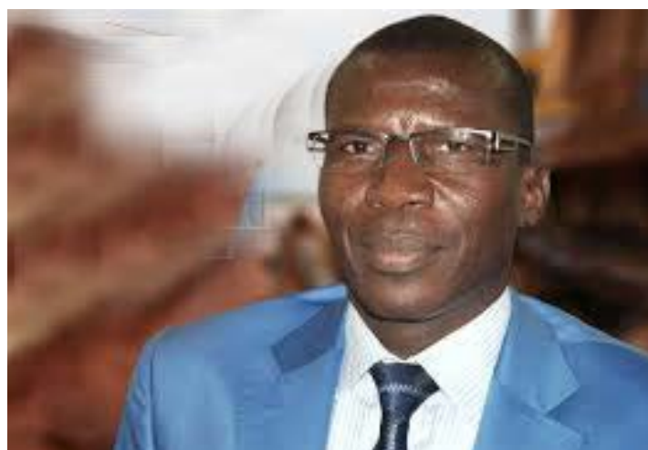
Ninsao Gnofam, ministre des Infrastructures routières et du Transport

par les usagers de la route. Certains déplorent l'insuffisance des gares routières. Pour d'autres, l'Etat doit construire de nouvelles gares pour leur permettre de mieux mener leurs activités génératrices de revenus. « Cette mesure est une bonne chose, mais tout le monde n'a pas été sensibilisé à ce sujet. Il faut que l'Etat construise ou aménage d'autres points de stationnement