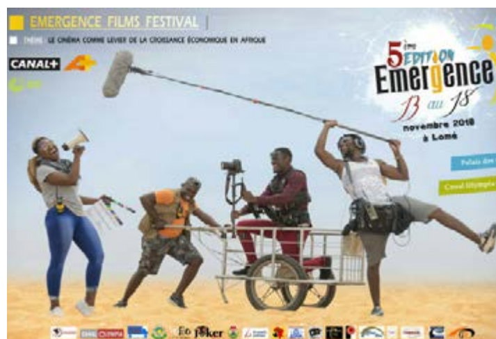
Affiche Festival Émergence

A la précédente édition, vingt-trois films étaient