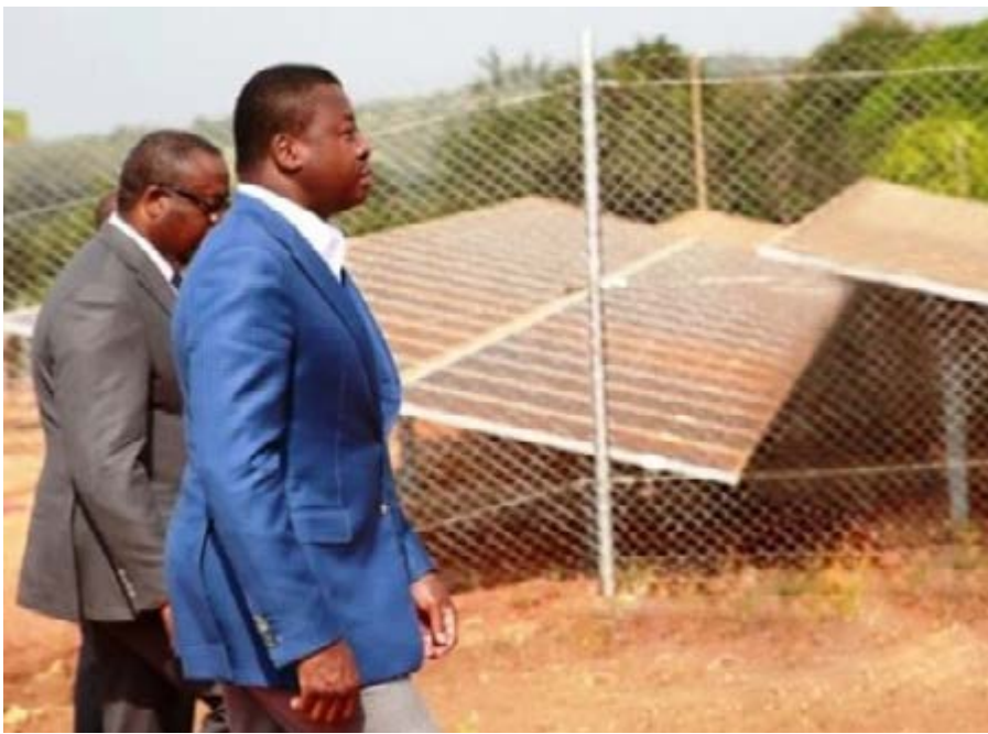
Faure Gnassingbé lors de l'inauguration d'une centrale à énergie solaire (archives)

Awagomé, localité située dans la préfecture de l'Ogou (175 km au nord de Lomé) est le choisi par le Chef de l'Etat, Faure Gnassingbé, pour lancer officiellement le projet présidentiel d'électrification rurale par kits solaires individuels, dénommé «CIZO » (allumer en Ewé-Mina). La cérémonie a eu lieu samedi 02 décembre dernier. S'inscrivant dans la politique du gouvernement visant à fournir de l'électricité à toute la population togolaise grâce à des partenaires privés, le projet permettra à 2500 habitants d'Awagomé d'avoir accès à une électricité propre, de qualité et à moindre coût. Le principal partenaire sur ce projet est le britannique, BBOXX, un des leaders mondiaux de l'électrification solaire décentralisée. L'Etat togolais a conclu avec cette société un partenariat dans lequel BBOXX s'engage à installer 300 000 systèmes solaires domestiques dans le pays sur les cinq prochaines années. Plus de 5.000 emplois directs et 4.000 indirects vont être créés et le