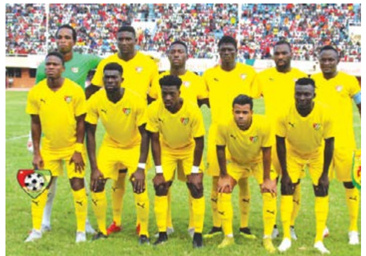
Les Eperviers du Togo

Si les Éperviers ont vraiment l'ambition de participer à la CAN Total Cameroun 2019, ils sont dans l'obligation