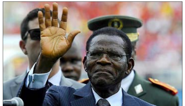
Téodor Nguema Obiang

Cette purge, au sein du parti au pouvoir, a fait réagir l'opposition. Le parti Convergence pour la