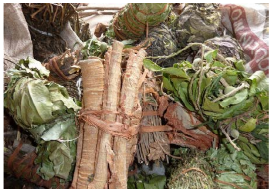
Des plantes médicinales

plante très demandée et utilisée sur le plan spirituel: pendant des cérémonies de purification, lors d'un décès. En pays Guin, c'est une plante bien en usage lors de la fête de Epé- Ekpé à Glidji. Elle est