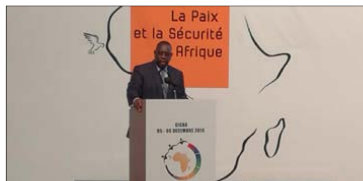
Macky Sall lors de son discours au Forum de Dakar

péril la justice et les droits humains fondamentaux ». C'est une nouvelle stratégie : désormais, un cadre de l'Agence française de développement (AFD) accompagne les éléments de la force Barkhane pour tenter de relancer, le plus vite possible, des projets de