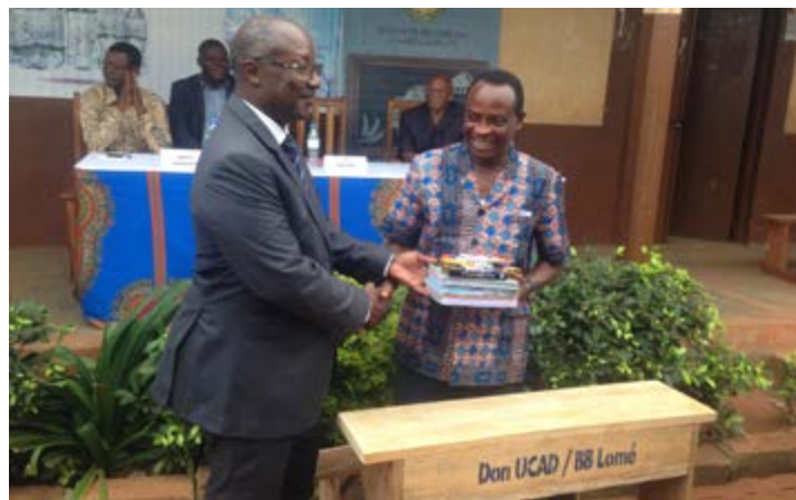
Remise symbolique d'un kit par le SG de la Brasserie au directeur de l'EPP Agoè Nyivé centre

Le besoin dans les établissements scolaires est assez important. Au niveau de l'EPP Agoè Nyivé centre, les élèves devaient auparavant s'asseoir jusqu'à 4 ou 5 par banc. Mais ce don de 400 tables viendra soulager les élèves. Les 600 kits scolaires