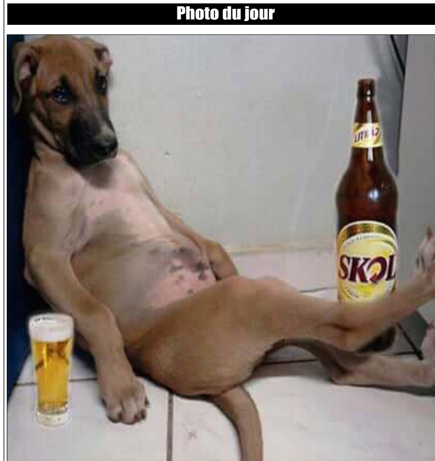
Commentez cette photo