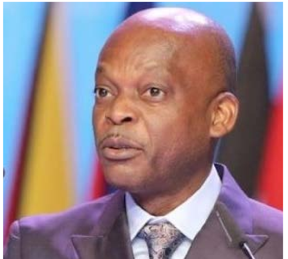
Prof Robert Dussey

Les pays ACP ou pays d'Afrique, Caraïbes et Pacifique sont l'ensemble des pays signataires de la convention de Lomé en 1975 et de l'Accord de Cotonou en 2000.