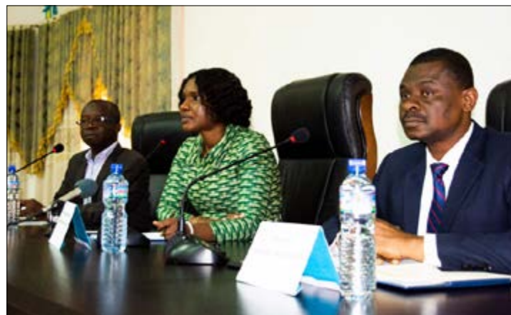
La table d'honneur lors de la conférence de presse

Pour le raccordement à l'électricité, le Togo occupe la première place dans la zone Uemoa et la 105 ème place dans le classement Doing Business 2019. Dans ce domaine, le Togo a mené deux réformes. Il s'agit de l'amélioration