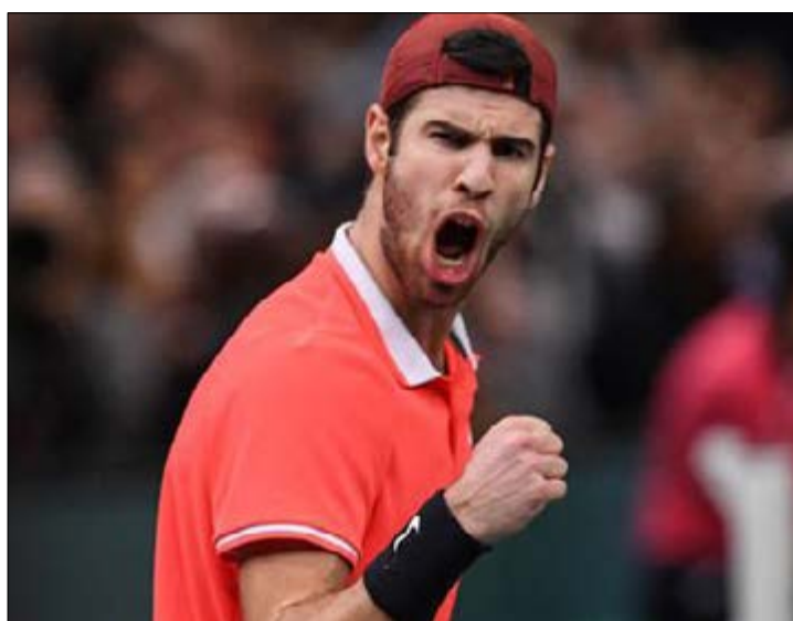
Karen Khachanov enragé de joie après victoire

Le Russe, encore impressionnant, cré la sensation en battant le futur numéro 1 mondial, Djokovic, en deux sets (7-5, 6-4), dimanche dernier en finale des Masters 1000 à Paris. Il remporte ainsi le premier Masters 1000 de sa carrière.