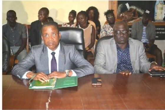
Le Ministre Kossivi EGBETONYO à la table d'honneur

Au Clap Ivoire, un concours de courts métrages-vidéo des jeunes techniciens et réalisateurs des huit pays de l'Union Econo-