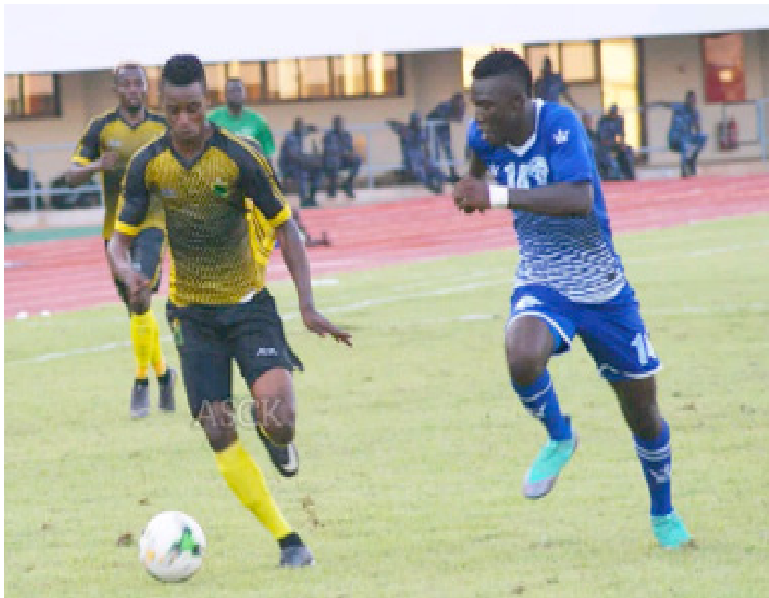
Action de jeu lors du match entre l'ASCK et l'AS Vita Club