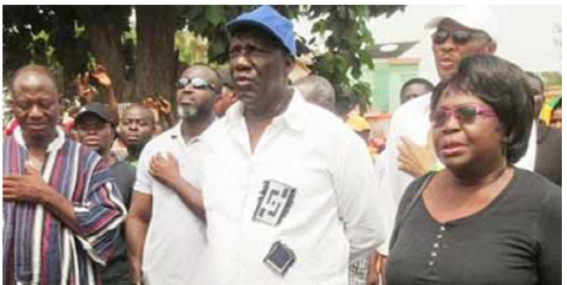
Quelques derniers fidèles de la C14

Alliance nationale pour le changement (ANC), le Parti des Togolais, le Comité d'action pour le renouveau (Car), le Mouvement citoyen pour la démocratie (MCD) sont