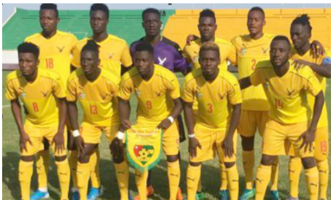
Les Eperviers du Togo à l'Ufoa

Après l'écroulement au Togo face aux Eperviers (4-1) le 22 septembre 2019, dans le cadre du premier match des préliminaires du Championnat d'Afrique des nations (Chan), les Super Eagles s'effondrent à nouveau face aux Eperviers, hier 29 septembre 2019, au Sénégal, lors de la Coupe de l'Ufoa.