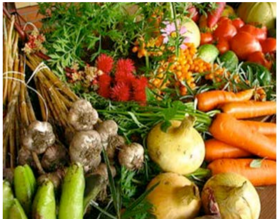
Produits issus de l'agriculture

C'est l'ensemble des industries ayant un lien direct avec l'agriculture. Cela comprend donc l'ensemble des systèmes de productions agricoles et s'étend à toutes les entreprises qui fournissent des biens à l'agriculture (engrais, pesticides, machines) ainsi qu'à celles qui transforment les produits agricoles et les conditionnent en produits commercialisables. En ce sens, le secteur agro-industriel ne se limite pas aux seuls produits alimentaires, domaine exclusif au secteur agroalimentaire, mais englobe aussi tous les secteurs parallèles de valorisation des agro-ressources : papiers, bioénergies, biomatériaux, cuirs, textiles, huiles essentielles, cosmétiques, tabac, etc.