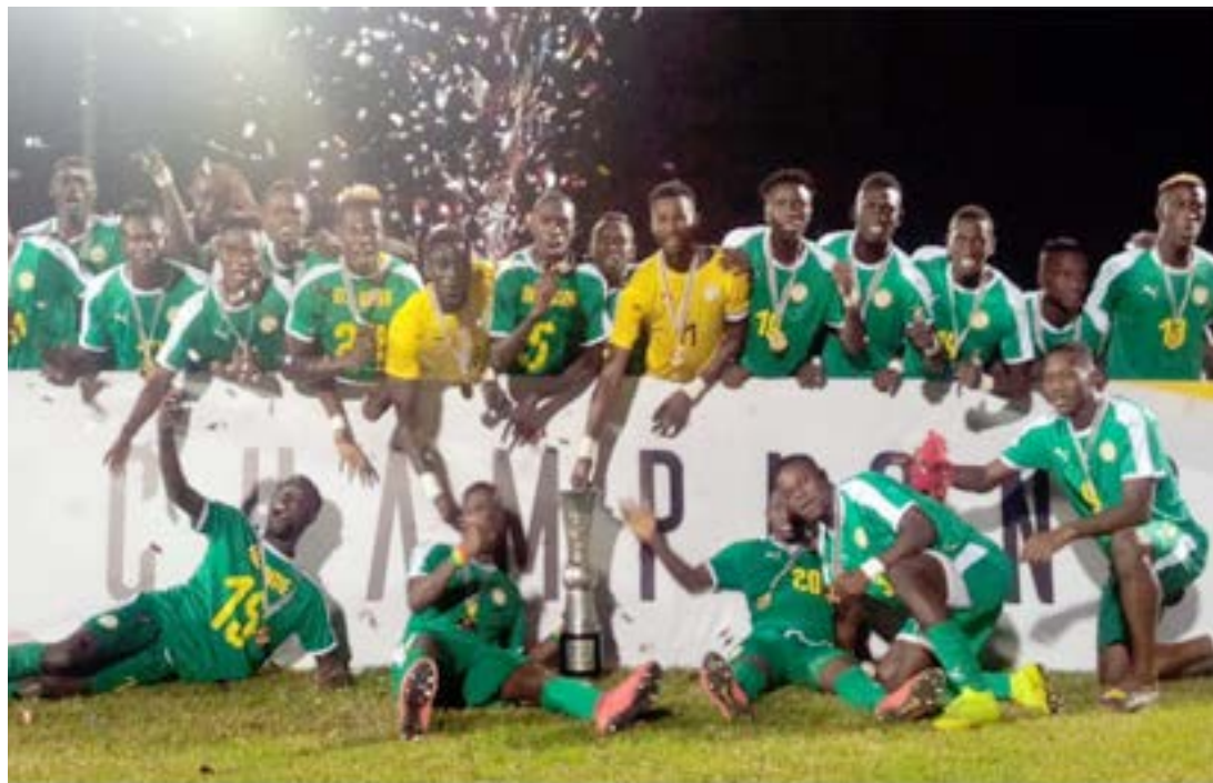
L'équipe sénégalaise championne de l'Ufoa 2019

Le Sénégal est désormais le patron du tournoi des 16 Nations de l'Union des fédérations ouest-africaines de football (Ufoa). Sur ses installations dimanche 13 octobre 2019 au stade Dior de Thiès, le Sénégal a détrôné le Ghana, au bout d'un match âpre.