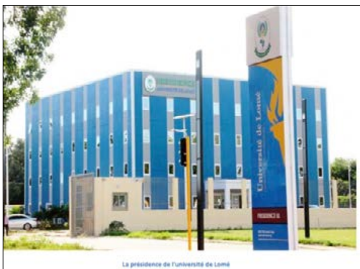
La présidence de l'université de Lomé

Certains étudiants venus en début de semaine à l'université pour des activités ont été surpris. Au lieu des raccourcis habituels, ceux-ci ont été obligés de faire le tour de la clôture. Heureusement que cette situation n'est