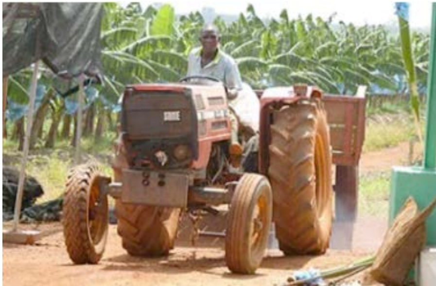
Méthode semi-moderne agricole

Système de production agricole qui ne maximise pas la productivité à court terme du sol en ne faisant pas appel à des intrants chimiques, à l'arrosage ou au drainage, mais plutôt aux ressources naturellement présentes sur place. Pratiquée généralement sur de vastes étendues, elle se caractérise par des rendements à l'hectare relativement faibles et par un plus grand nombre d'emplois par quantité produite, mais avec des revenus parfois très bas, dans les pays pauvres. C'est une agriculture qui permet souvent une certification « Agriculture biologique » quand elle est accompagnée de la non-utilisation d'intrants chimiques mais tous les agriculteurs ne la revendiquent pas. On distingue généralement plusieurs formes d'agriculture extensive : une forme traditionnelle rencontrée