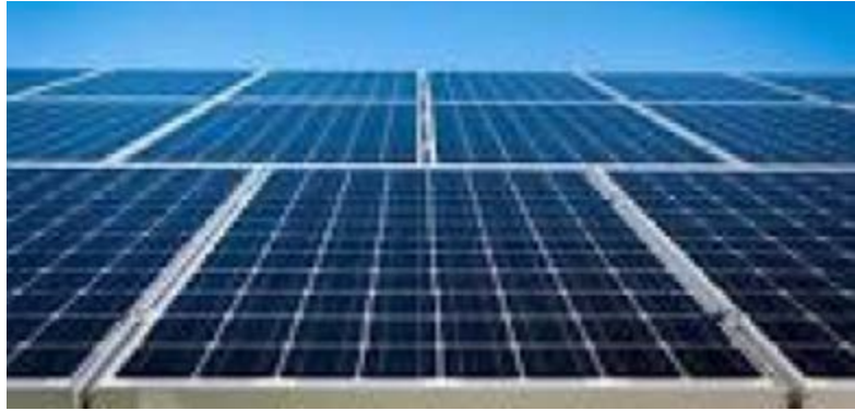
Des panneaux solaires

Le Conseil de l'entente veut contribuer à la stratégie d'électrification entreprise par les autorités togolaises. Pour ce faire, l'organisation envisage de financer 14 villages situés dans trois régions différentes à savoir la Kara, les Savanes et la Centrale.