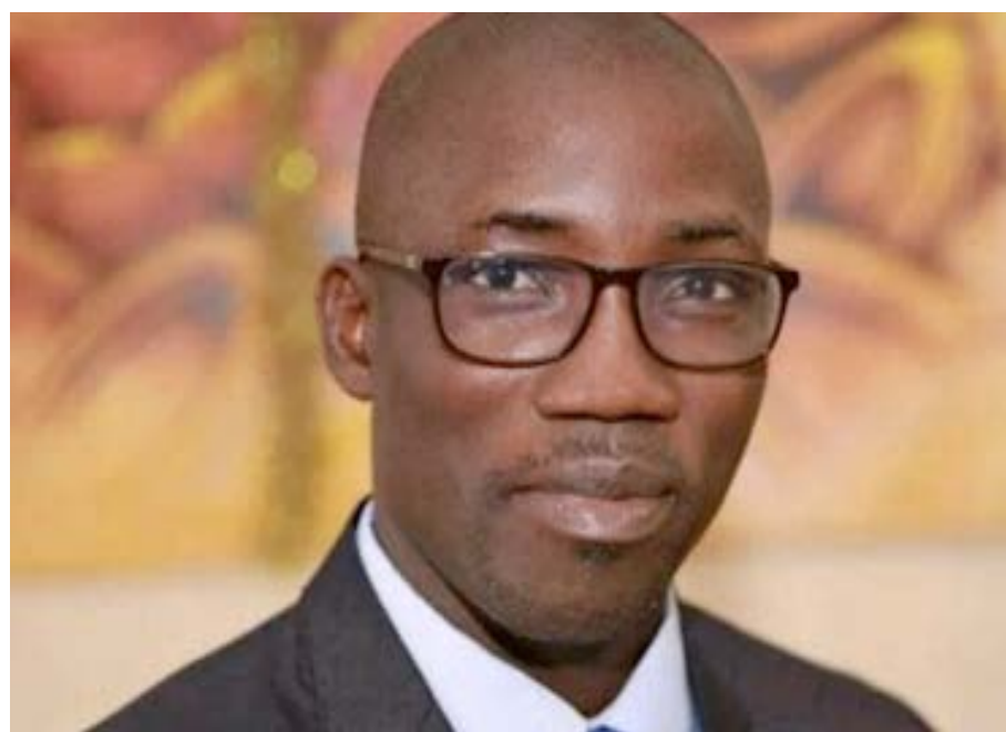
Noël Koutera Bataka, ministre togolais de l'Agriculture