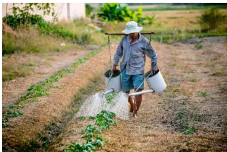
Un paysan usant de la méthode traditionnelle