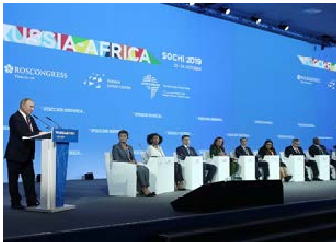
Vladimir Poutine au sommet de Sochi

Sochi est depuis ce 23 octobre 2019, la capitale d'une grande rencontre historique entre la Russie et l'Afrique. Plus de 40 chefs d'Etat, environ 3000 participants, Sochi s'est mis à l'heure et aux couleurs africaines pour booster ses relations avec ce continent, berceau d'opportunités. Un sommet tout à fait « inédit », selon certains observateurs qui parlent même du « grand retour » de cette Russie que l'on croyait disparue des radars de l'Afrique. Mais avant tout, la Russie avait-elle vraiment quitté l'Afrique ? N'était-ce pas plutôt une stratégie de prospective adoptée intentionnellement pour mieux rebondir comme elle semble le faire à ce sommet de Sochi