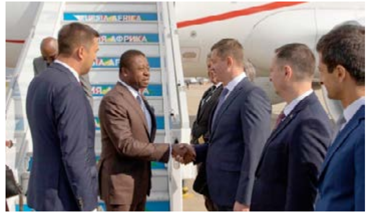
Faure Gnassingbé à son arrivée en Russie

cours des dernières années les échanges bilatéraux ont presque doublé pour atteindre 20 milliards de dollars, c'est très peu car le potentiel de développement est très important et nous espérons doubler lors des prochaines cinq années nos échanges commerciaux », a-t-il précisé. Au cours du Forum économique Russie-Afrique, trois axes principaux seront abordés. Il s'agit du développement des relations économiques entre la Russie et l'Afrique, la création de projets communs et la coopération dans les domaines humanitaire et social. Ces sujets sont déclinés à travers plusieurs conférences. L'objectif étant