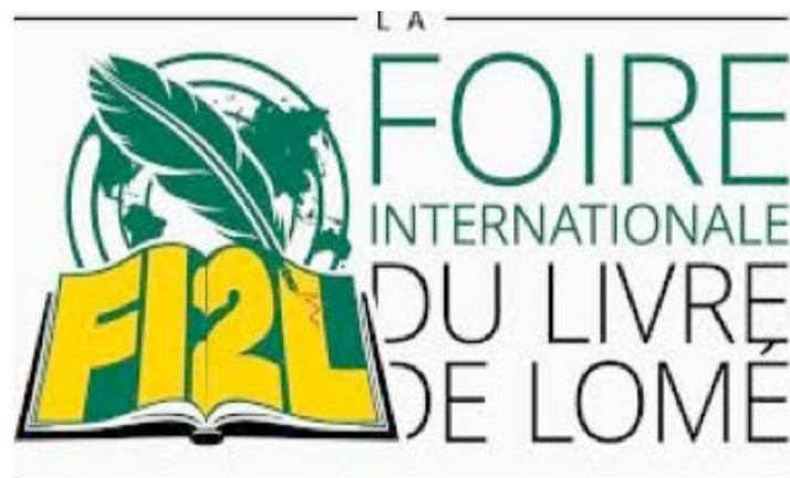
Le Logo de la FI2L

Des participants venus d'ailleurs comme le Cameroun, le Bénin, la Côte d'Ivoire, le Burkina Faso, le Niger, le Sénégal, la France, l'Allemagne, la Belgique prendront part à cette