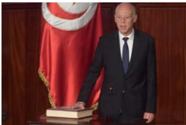
Kaïs Saïed, nouveau président tunisien

son discours d'investiture, a proposé que les Tunisiens fassent don d'une journée de travail pendant cinq ans pour contribuer à résoudre le problème de l'endettement. Il a également insisté sur la condition des femmes, qui ont besoin de voir leurs droits renforcés, selon lui, notamment les droits économiques et sociaux. Il a déclaré que « la dignité d'un pays se [voyait] à celle de ses hommes et de ses