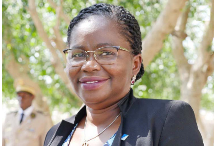
Victoire S. Tomégah-Dogbé, Ministre du Développement à la Base

Un taux moyen d'exécution de la lettre de mission 2019 estimé à 100% contre 94% en 2018 ; un taux d'exécution financière de 79,47% à fin novembre ; 45 700 ménages bénéficiaires de l'extension du programme des transferts monétaires, près de 95 000 élèves touchés par les cantines scolaires et 690 groupements d'intérêt économique financés ; plus de 120 000 emplois temporaires créés au profit des personnes vulnérables et 8500 volontaires nationaux mobilisés sur des missions de développement ; l'alphabétisation de 1420 membres de