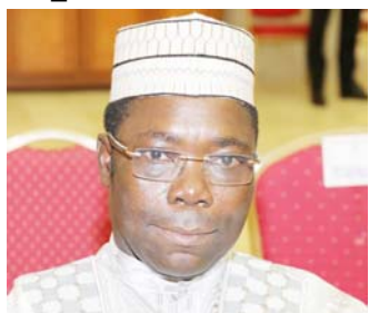
Foli-Bazi Katari, Ministre de la Communication

Si la non-contrainte au corps reste la règle, il faut tout de même faire remarquer que le législateur semble épouser l'idée du gouvernement de frapper les indécents journalistes à la poche avec des amendes jugées un peu élevées par certains représentants du peuple. Ainsi, on indique que les amendes ont été mises en harmonie avec celles prévues par le code pénal. Est donc constitutif de délit d'omission et puni d'une amende de dix mille (10 000) à cent mille (100 000) francs CFA, tout manquement aux prescriptions relatives à la déclaration, à l'impression et au dépôt légal en ce qui concerne la presse écrite, à l'enregistrement et à la conservation des émissions radio-diffusées ou télévisées. Tout man-