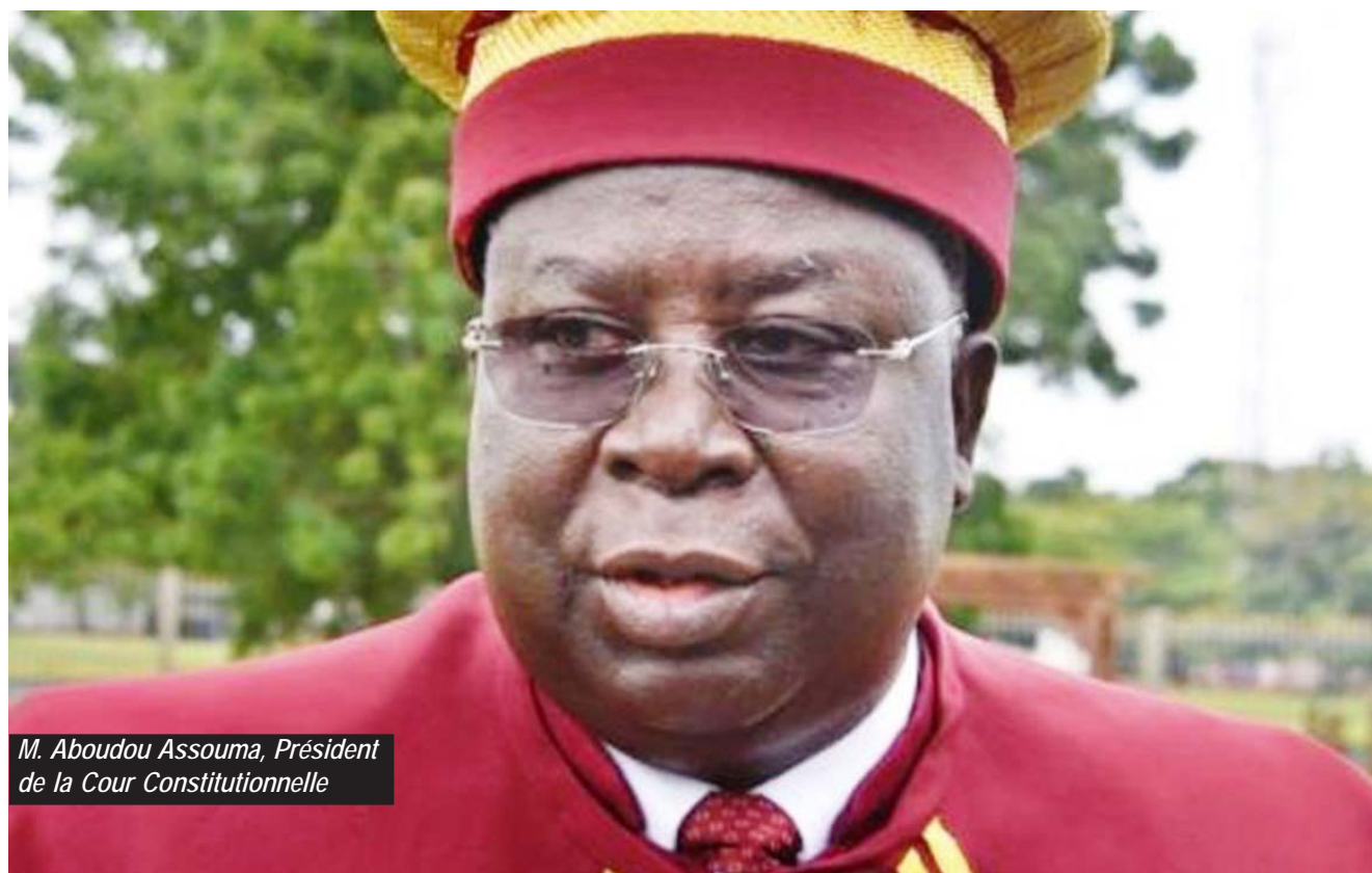
M. Aboudou Assouma, Président de la Cour Constitutionnelle

LES 7 DE LA COUR CONSTITUTIONNELLE ENTRENT EN FONCTION