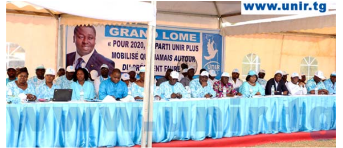
Une vue partielle des responsables d'Unir dans le Grand Lomé

dent Tairou Bagbiègue a lancé aux militants Unir de la région septentrionale : «...le président de notre grand parti, Faure Essozimna Gnassingbé, nous a également instruit de vous témoigner sa satisfaction pour les résultats obtenus lors des élections législatives du 20 décembre 2018 et tout récemment les municipales du 30 juin 2019, grâce à votre loyauté,