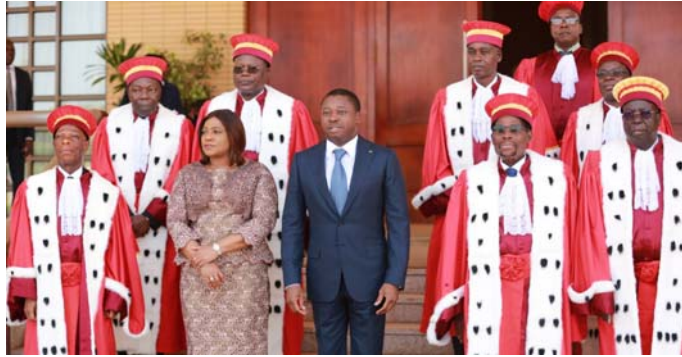
Les membres de la Cour, aux côtés du Président de la République et de la Présidente de l'Assemblée nationale

En attendant la désignation des deux autres membres par le Sénat qui sera bientôt mis en place, les sept récipiendaires ont, à tour de rôle, juré de bien et fidèlement remplir leurs fonctions et de les exercer en toute impartialité dans le respect de la Constitution. Le Chef de l'Etat