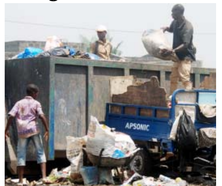
Une image de collecte d'ordures à Lomé

Dans son projet de société 2020-2025, Faure Gnassingbé a promis le renforcement de la sécurité de l'écosystème digital par l'opérationnalisation dès 2020 de l'Agence nationale de la cybersécurité (ANCy) et de l'Instance de protection des données à caractère personnel (IPDCP) afin d'établir la confiance entre les acteurs et protéger le pays et la population des intentions malveillantes. Le décret portant attributions, organisation et fonctionnement de l'Agence nationale de la cybersécurité a été adopté par le Gouvernement le 13 février 2019. Il définit le statut, les missions et attributions de l'ANCy, fixe le cadre de sa gouvernance et donne des précisions sur sa gestion et le contrôle de ses comptes. Il fait de l'Agence l'autorité en matière de sécurité et de défense des systèmes d'information au niveau national. Il met sous sa responsabilité la prévention des cyberattaques et la protection des ressources informationnelles contre celles-ci et lui confie la détection des attaques, ainsi que l'élaboration des actions de riposte visant à les éradiquer.