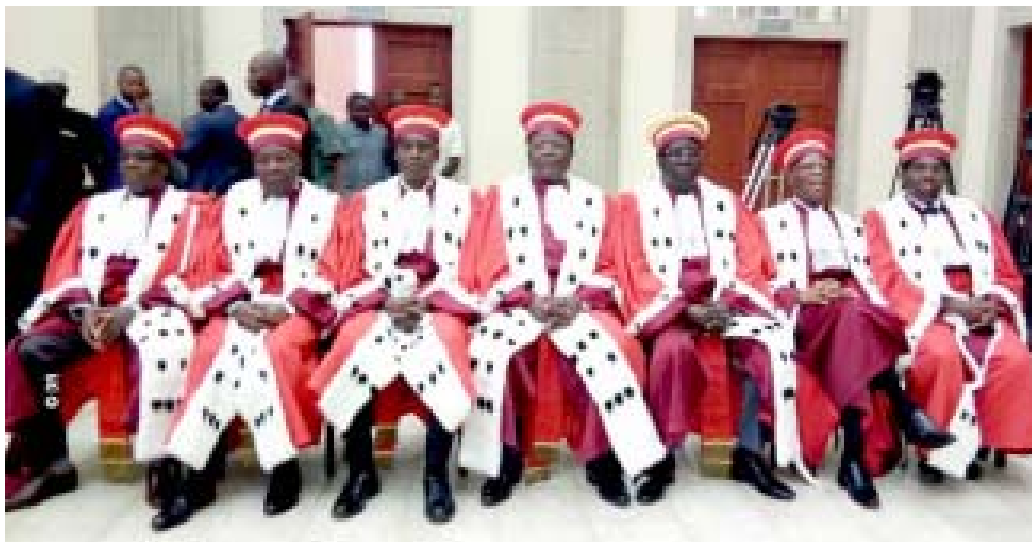
Les juges de la Cour Constitutionnelle du Togo

Se prononçant sur les deux ordonnances qui portent sur le même objet, c'est à dire la prorogation de l'état d'urgence, la Cour Constitutionnelle, se référant à la loi d'habilitation adoptée par l'Assemblée nationale, promulguée le 30 mars 2020, qui autorise le gouvernement « à prendre par voie d'ordonnances, dans un délai de six (06) mois, à compter du 16 mars 2020, toute mesure relevant du domaine de la loi pour lutter contre la propagation du coronavirus