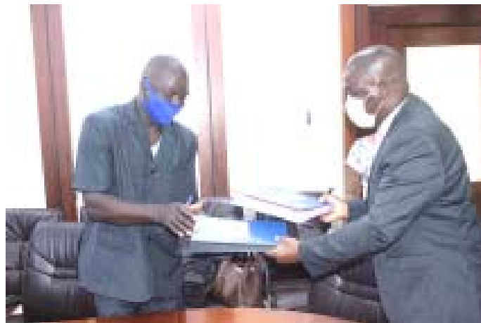
Echange des documents d'accord entre les deux parties

Pour la deuxième fois, l'Organisation des Nations Unies pour l'alimentation et l'agriculture (FAO) au Togo et organisations des producteurs forestiers et agricoles du Togo ont signé, le 25 juin 2020 à Lomé, un protocole d'accord qui accorde à ces acteurs nationaux une subvention de 130.857.250 francs Cfa dont 15 à 20% seront déployés pour des actions de riposte contre la pandémie au nouveau coronavirus (Covid-19). Il s'agit de la coordination togolaise des organisations paysannes et de producteurs agricoles (CTOP), du laboratoire de botanique et d'écologie végétale, de l'Université de Lomé, de la coopérative Choco-Togo, de l'union régionale des organisations de producteurs de céréales de la Maritime (UROPC-Maritime), du forum national des agriculteurs et éleveurs du Togo (FNAET), de l'association paysanne pour la communication des ruraux (APCR) et de la fédération des unions de producteurs de café cacao du Togo (FUPROCAT). L'acte est motivé par les résultats satisfaisants enregistrés dans la mise en exécution d'un premier accord. Objec-