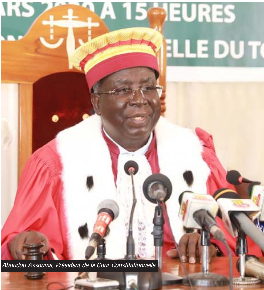
Aboudou Assouma, Président de la Cour Constitutionnelle

La Cour Constitutionnelle donne un avis favorable à la prorogation de l'Etat d'urgence