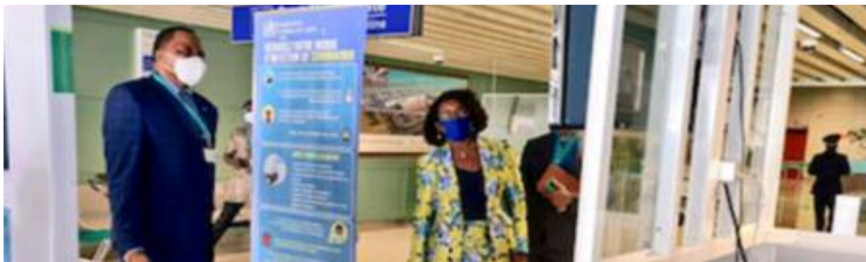
Le col. Latta Gnana, DG de l'ANAC et Mme Zouréhatou Kassa Traoré, ministre des infrastructures et des transports

Les autorités sanitaires, aéroportuaires et gouvernementales peaufinent les derniers détails avant la reprise officielle du trafic passager, interrompu depuis le 20 mars. Une ordonnance a d'ailleurs été dévoilée il y a une dizaine de jours, et précise les nouvelles