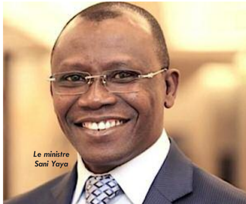
Le ministre Sani Yaya

« Si cette prévision se confirme comme nous le craignons, ce sera le taux de croissance le plus faible de l'histoire de l'histoire économique du Togo au cours de ces dix dernières années. Je rappelle que le taux de croissance économique au cours de la décennie passée s'est établi à