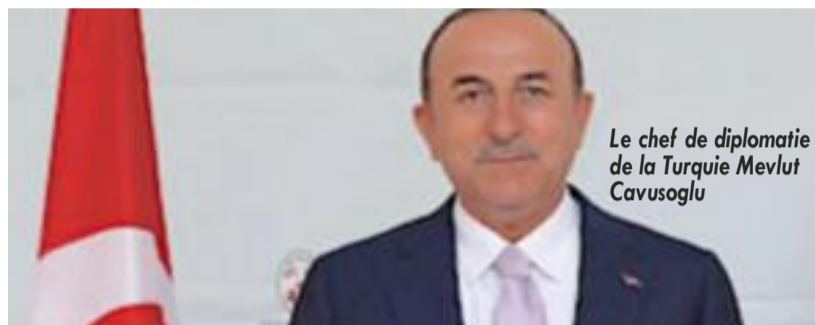
Le chef de diplomatie de la Turquie Mevlut Cavusoglu

Les autorités togolaises ont accepté que ces établissements dénommés