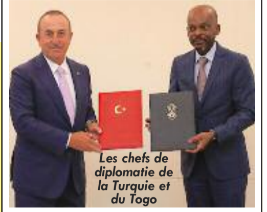
Les chefs de diplomatie de la Turquie et du Togo

Le Togo et la Turquie renforcent leur coopération par 3 accords P.4