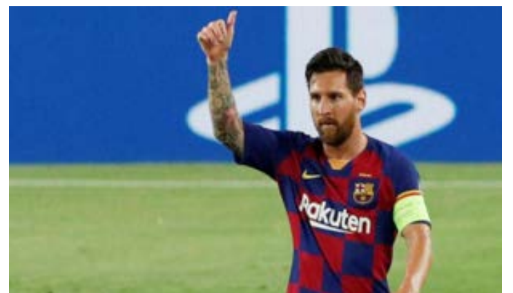
Léo Messi, lors de la victoire face à Naples

Toutes les séries sont faites pour être brisées. Alors qu'il n'avait jamais été éliminé de la Ligue des champions sur le banc du Real Madrid avant ce vendredi, Zinedine Zidane a perdu son talisman à l'Etihad Stadium. Son Real, orphelin de Sergio Ramos (suspendu), a été étouffé d'entrée par un Manchester City parfaitement accordé par Pep Guardiola, et n'a pas pu remonter son retard de l'aller (2-1, 2-1), dans un match intense. Cette rencontre restera à jamais celle où le roc Raphaël Varane a craqué, offrant les deux buts aux Citizens. City, guidé par un De Bruyne stupéfiant, affrontera l'OL le 15 août en quarts de finale, à Lisbonne.