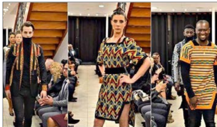
A une soirée Fashion Mode