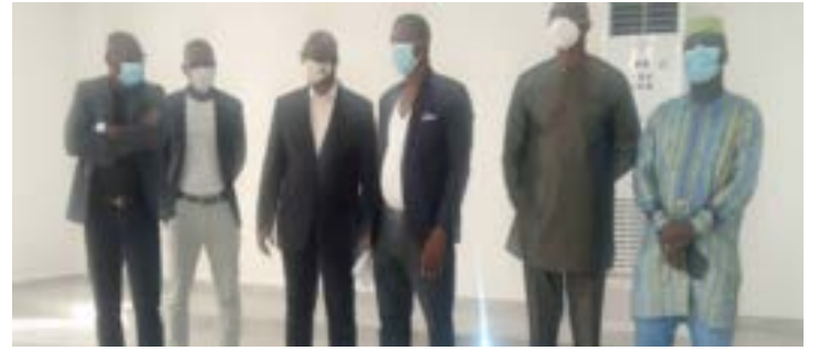
Le Comex de la FTF

C'est dans le cadre du projet Fifa Forward, que la FTF a bénéficié d'une subvention en vue de l'extension de son siège dans le but de décongestionner les bureaux actuels et de mettre les différents membres dans de meilleures conditions de travail. C'est