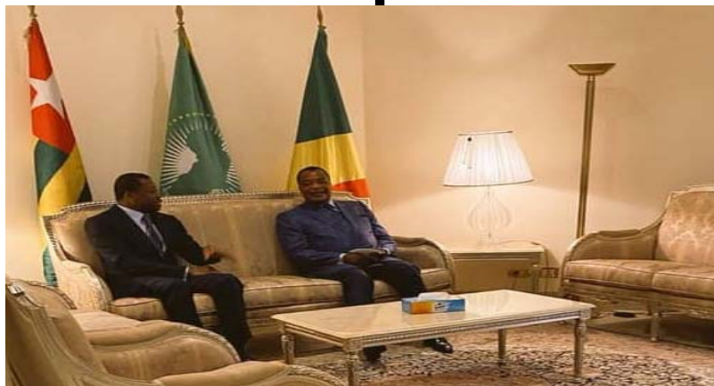
Les Présidents Faure Gnassingbé (g) et Denis Sassou Nguesso (dt)

Le Jeudi 27 Août dernier, le président de la République Faure Gnassingbé a effectué au Congo, une visite de travail de 24 heures chez son homologue Denis Sassou Nguesso.