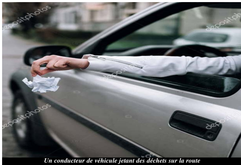
Un conducteur de véhicule jetant des déchets sur la route

Il est de notoriété publique que jeter ou abandonner ses déchets ou ordures dans la rue est formellement interdit. Il existe des règles de collecte des déchets définies par la municipalité. C'est pourquoi de même, il est interdit de déposer les déchets dans la rue sans se conformer à ces règles. Mais au mépris de ces règles qui doivent régir la collecte des ordures, certains citoyens indécents le font sans aucune mesure. Or ne pas respecter l'interdiction de déposer les déchets sur la voie publique est puni