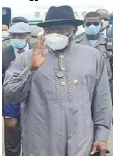
L'émissaire de la CEDEAO au Mali

dernier ne souhaite pas retourner au pouvoir.