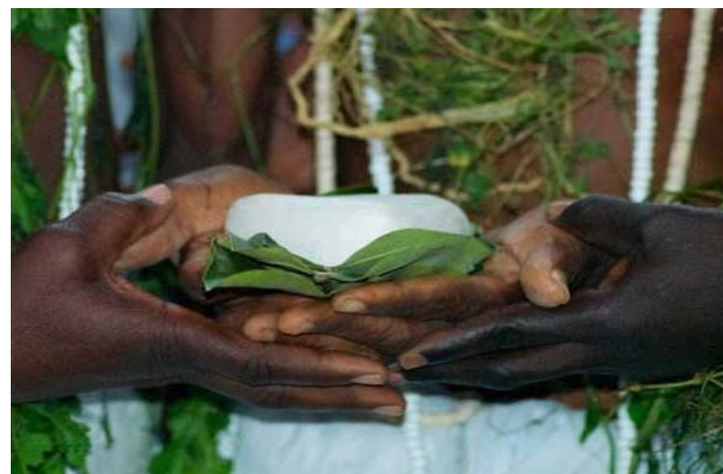
La cérémonie Kpéssosso

Au regard de cette pandémie qui évolue crescendo, les autorités traditionnelles des lacs ont pris la décision