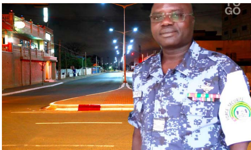
Le Commandant de la FOSAP, Col Amana Kodjo

Des nouveaux cas contaminés au Covid-19 ont été découverts dans certaines préfectures du pays à l'instar de Tchoudjo, Tchamba et Sotouboua.