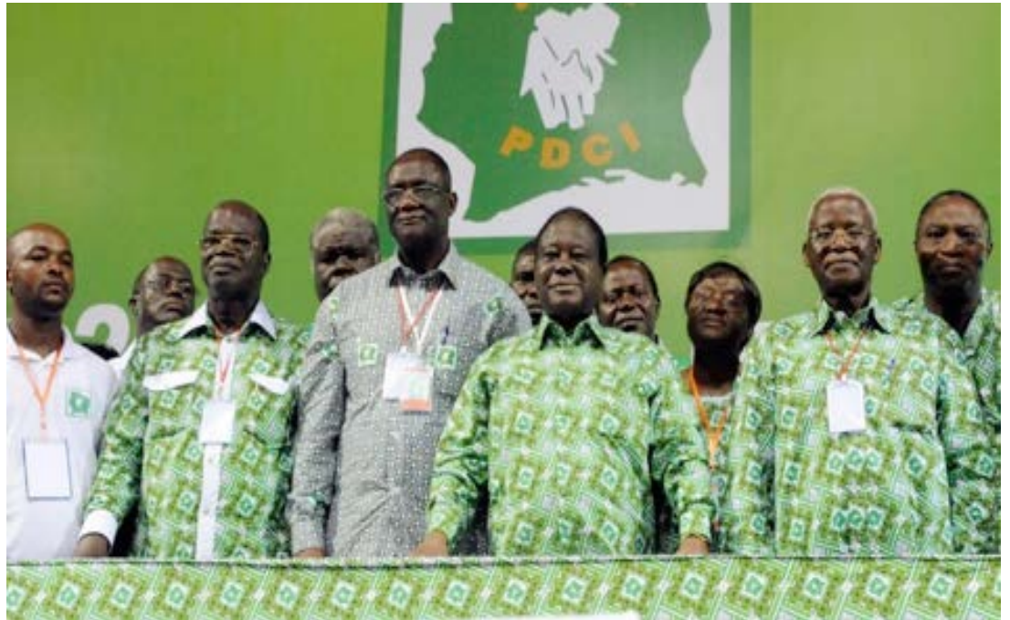
Henri Konan Bédié et les militants du PDCI

Samedi 3 octobre 2020, le PDCI a encore précisé ses idées d'empêcher l'organisation de la présidentielle du 31 octobre prochain en Côte-d'Ivoire. De-puis Cocody, le parti a lancé un appel aux militants pour une désobéissance ci-vile pacifique avec pour prochaine étape, le stade Houphouët-Boigny le 10 octobre prochain.