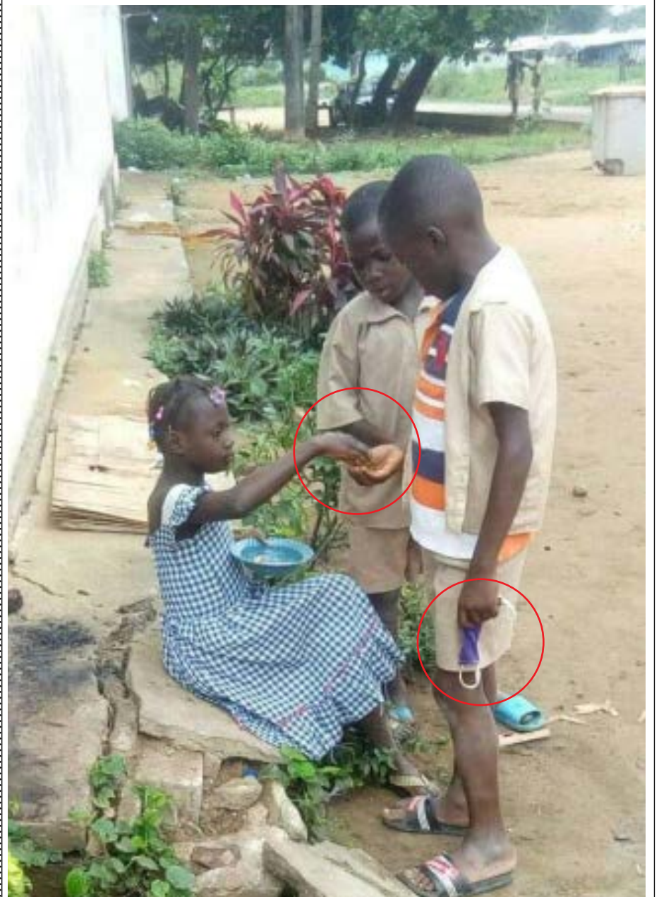
Commentez la photo ci-dessus