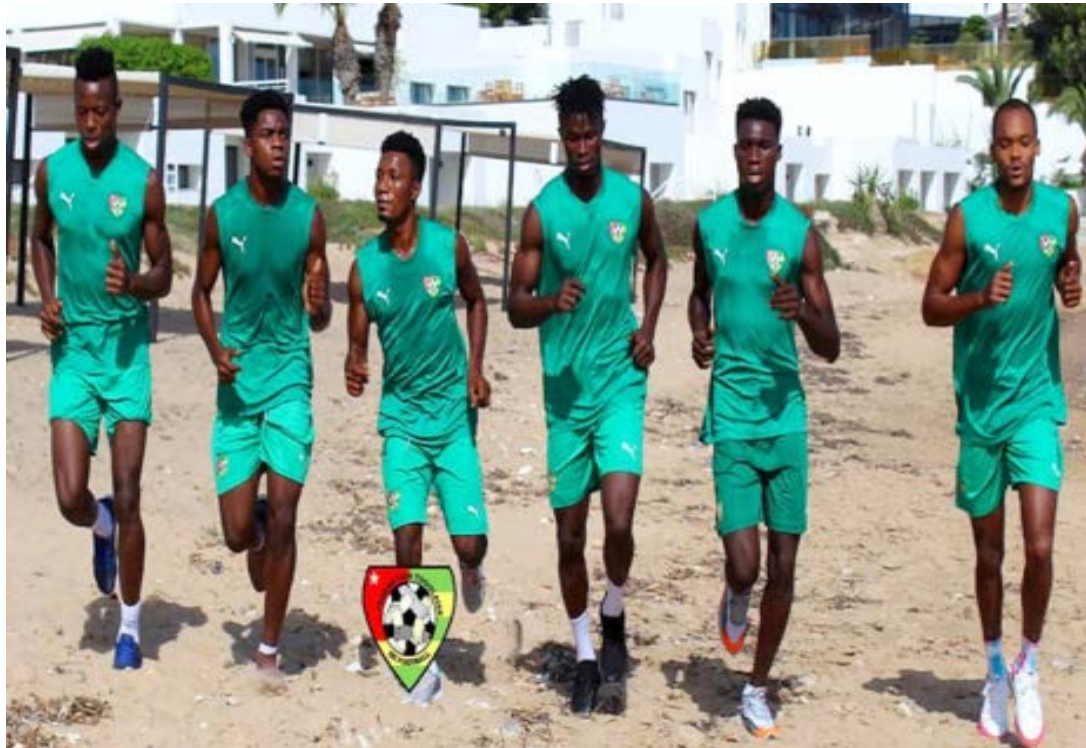
Éperviers du Togo en Tunisie

Dans le cadre de la journée Fifa, les Éperviers du Togo sont, depuis le 03 octobre, en terre tunisienne pour un stage qui sera sanctionné par deux rencontres amicales le 08 octobre contre la Libye et le 12 octobre prochain face au Soudan. Pour l'heure, l'effectif appelé par Claude Le Roy pour les confrontations a été remanié.