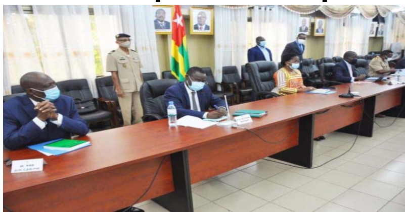
Une vue des membres du Conseil scientifique

Elle n'a pas manqué de les exhorter à poursuivre avec professionnalisme leur mission pour une lutte efficace contre ce virus invisible et mortel.