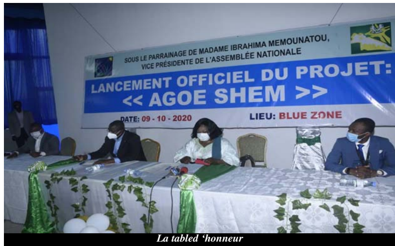
La table d'honneur

Financé par la société CACESPIC-IF Sarl à hauteur de 50 000 000 FCFA, le projet va se dérouler sur une période de trois mois. " AGOE CHEM " aura pour vocation de former 400 jeunes de la commune d'Agoè-Nyivé 1 à raison de 10 par village.