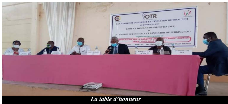
La table d'honneur

Le mardi 6 octobre dernier à Cinkassé, à l'extrême nord du Togo, les acteurs du trafic sur le corridor Togo-Burkina-Faso ont été sensibilisés sur la " Garantie unique du transit routier inter-Etats de la CEDEAO ". C'est une initiative de la Chambre du Commerce et d'Industrie du Togo (CCIT), en partenariat avec l'Office Togolais des Recettes (OTR) et la Chambre du Commerce et d'Industrie du Burkina Faso (CCI-BF).