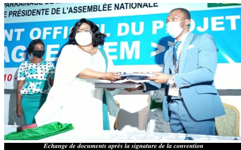
Echange de documents après la signature de la convention

Une fois rédigé, il sera présenté à un jury qui ensuite sélectionnera les 5