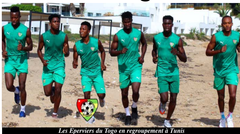
Les Éperviers du Togo en regroupement à Tunis

Plus de doute, après l'annulation du premier match amical des Éperviers qui devait se tenir le 8 octobre dernier contre la Libye, la fédération tunisienne donne le feu vert à la délégation togolaise, pour disputer son match face à la sélection soudanaise menée par