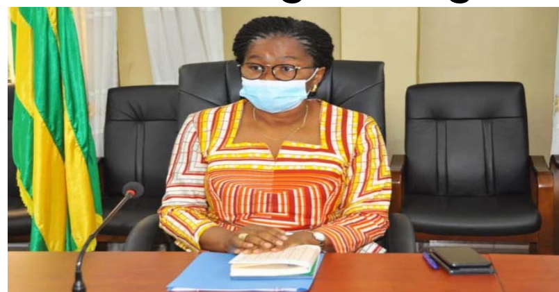
Mme le Premier ministre Victoire Tomégah-Dogbé

Le président du conseil scientifique a également fait savoir que les échanges ont porté sur des prochains défis auxquels le Conseil est confronté, en l'occurrence la rentrée scolaire 2020-2021 et la question de l'ouverture des lieux de culte.