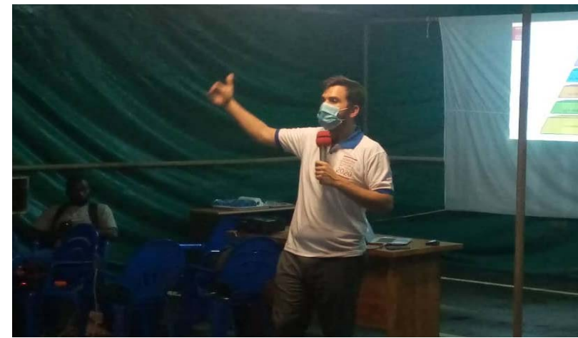
Le DG SOGEA SATOM lors de la sensibilisation

au niveau du Togo, c'est de faire en sorte que l'ensemble du personnel puisse s'approprier et communiquer avec les collègues sur les différents risques comme : chute en hauteur, collision engin/piéton, électrocution, levage et rupture des charges et enfin chute d'objet. Allant toujours dans le même sens, le Directeur Générale Pierre-Etienne LATOUR dans sa communication, est revenu sur les cinq étapes de produire en sécurité. Etapes qui se résument par la conception, la procédure d'exécution, le pretask, le prestart et l'exécution des travaux. Parlant de la place qu'occupe la sécurité dans les dispositifs de SOGEA SATOM,