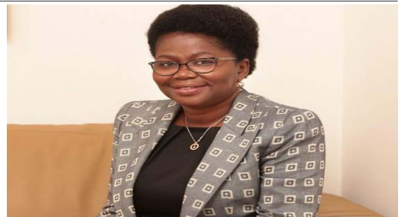
Mme le Premier ministre Victoire Tomégah-Dogbé

ment être question de peaufiner davantage les justes réglages sur les stratégies qui vont permettre aux membres de l'équipe gouvernementale d'avoir plus de succès dans la ges-