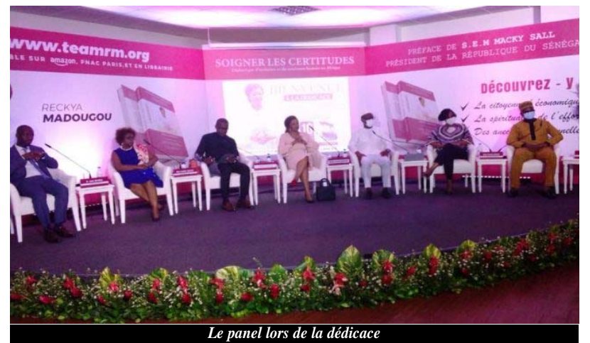
Le panel lors de la dédicace

C'est une méthode que les pays africains ont essayée sur de longues décennies qui n'ont pas porté fruit selon elle. Or