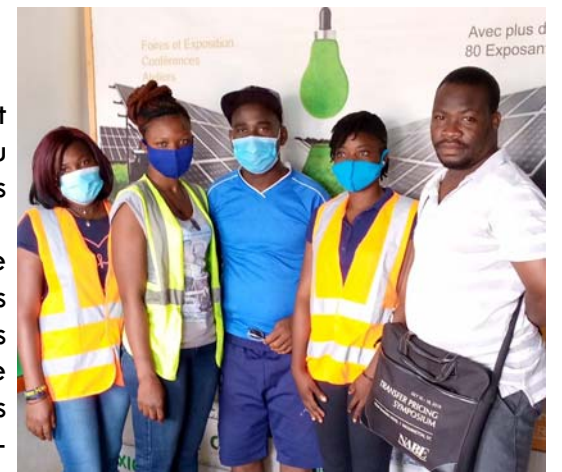
Stagiaires chez Eco Energie

Le projet de formation des techniciennes solaires s'intègre dans les objectifs de UFT de formation solaire. Entre autres, UFT a déjà élaboré un curriculum solaire pour la formation dans les institutions d'enseignement professionnels qui a été reconnu par l'État togolais en 2016. Elle réalise régulièrement des ateliers de formation en collaboration avec des coopérative artisanale du Togo. Actuellement, ensemble avec son partenai-