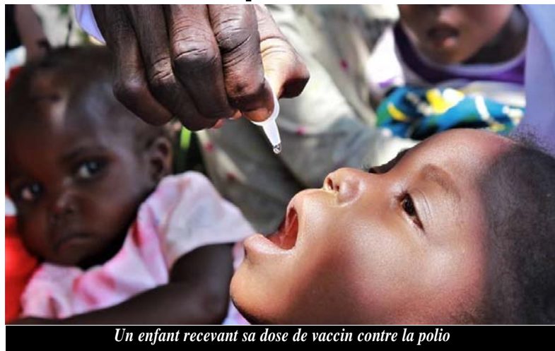
Un enfant recevant sa dose de vaccin contre la polio

Après le succès de la dernière campagne de vaccination de février 2020 avec 80% des attentes satisfaites, l'objectif du gouvernement est de poursuivre sur la