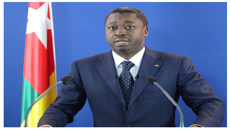
Le Président Faure Gnassingbé

Enfin dans la catégorie de l'investissement dans le capital humain, la moitié des indicateurs sont au vert. Il s'agit des