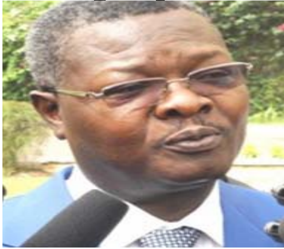
Gabriel Messan Agbéyomé Kodjo

L'opposition togolaise n'arrête pas de s'offrir en spectacle au moment où le gouvernement a amorcé les chantiers de développement du pays. La nouvelle trouvaille pour se tirer encore entre les pattes se trouve être des déclarations à l'emporte-pièce que l'ANC et la DMK ont remis au goût du jour à propos de la dernière présidentielle.