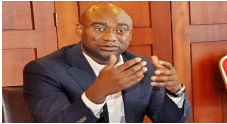
Prof Dodji Kokoroko, ministre des Enseignements primaire, secondaire...

La rentrée scolaire 2020-2021 a démarré depuis la semaine dernière dans le strict respect des mesures barrières édictées par les autorités. Depuis cette reprise des cours, alors que l'on remarque une accalmie au sein des établissements scolaires, les syndicats des enseignants brisent la glace et menacent de rentrer en grève le 16 novembre prochain, en tenant compte du mot d'ordre de grève qu'ils ont déposé le 2 novembre dernier.