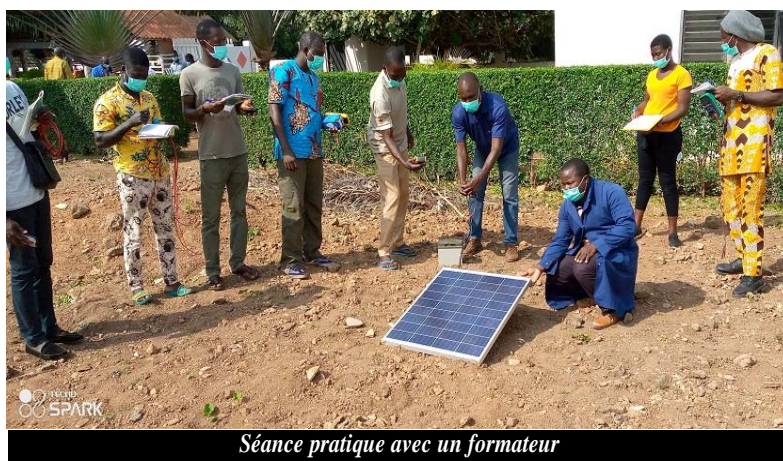
Séance pratique avec un formateur

Entre 17 au 20 août 2020, les participants ont pu suivre avec une attention particulière les modules suivants : Le principe de l'électrification à courant continu, la conversion photovoltaïque, la procédure d'installation solaire photovoltaïque en site isolé, la mise en œuvre des