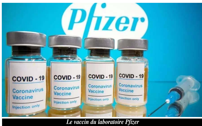
Le vaccin du laboratoire Pfizer

Les laboratoires Pfizer et Bion Tech, associés dans une recherche, ont annoncé lundi 9 novembre 2020, avoir réussi à mettre sur pied un vaccin "efficace à 90%" contre le Coronavirus (Covid-19). Selon les informations, cette annonce officielle fait suite à une première analyse intermédiaire d'essais de phase 3. Cette dernière étape constitue la dernière avant une demande d'homologation de ce vaccin.