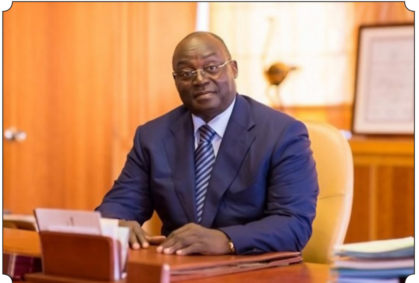
● Tiémoko Meyliet KONE, Gouverneur de la BCEAO

Examinant la conjoncture interne, le Comité a relevé que l'activité économique dans l'UEMOA a légèrement progressé au troisième trimestre 2020, en rapport avec la levée des restrictions de mobilité et les effets des politiques publiques de sou-