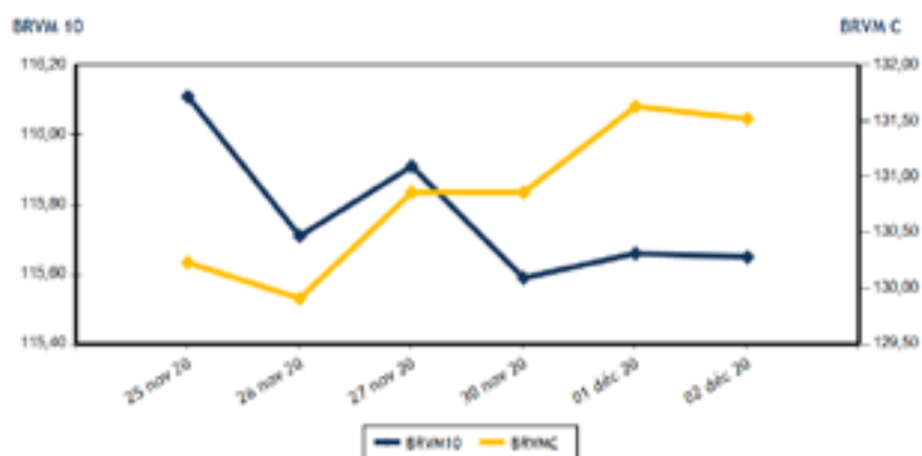
Evolution des indices