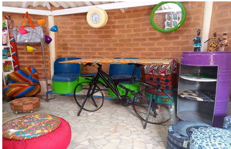
Une vue des oeuvres recyclées

C'est l'occasion de montrer l'importance du recyclage et les différentes activités qui contribuent à une planète stable sur l'environnement et à un avenir plus vert qui profitera à tous.