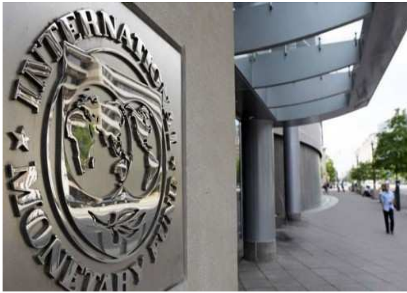
Le siège de la Banque Mondiale

Pour la Banque mondiale, le Togo devrait connaître une croissance de 3% cette année 2021, contre une prévision togolaise de