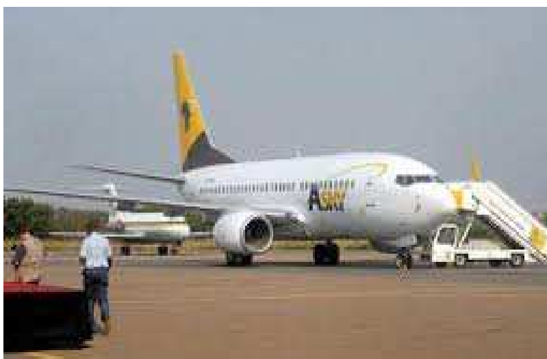
Un avion de la compagnie ASKY

Pour ASKY, l'engagement à adopter et à promouvoir la plateforme Trusted Travel s'inscrit dans une longue série d'actions visant à privilégier le bien public en partenariat avec des institutions panafricaines essentielles, telles que les Centres Africains pour le Contrôle et la Prévention des Maladies (Africa CDC), l'agence principale de l'Union Africaine pour la coopéra-