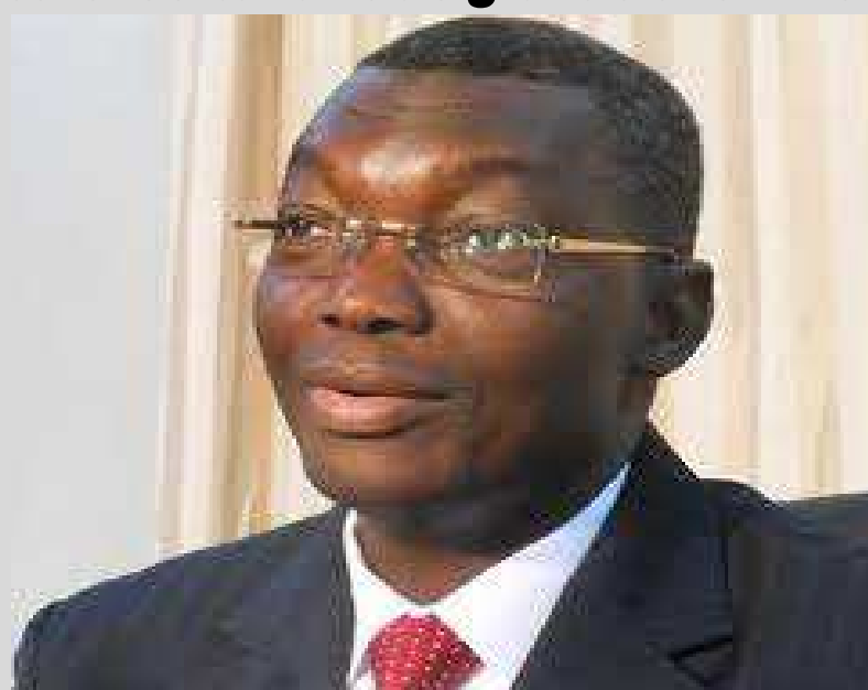
Gal Yark Damehame, ministre de la Sécurité et de la Protection civile

Dans la localité de Ségbé, près de la frontière Togo-Ghana, une descente des forces de sécurité dans le cadre d'une vaste opération de sécurisation du territoire togolais dans un contexte