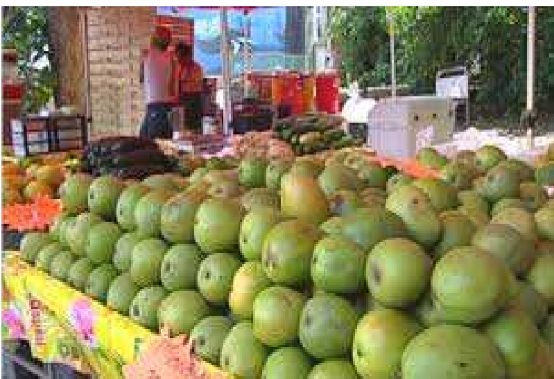
Une commerçante de fruits

Du point de vue des nomenclatures secondaires et par rapport à l'état des produits, la hausse du niveau général des prix en variation trimestrielle est à mettre à l'actif de l'augmentation des prix des " Produits