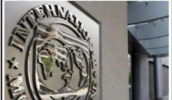
Le siège de la Banque Mondiale

Les institutions financières optimistes si... P.4