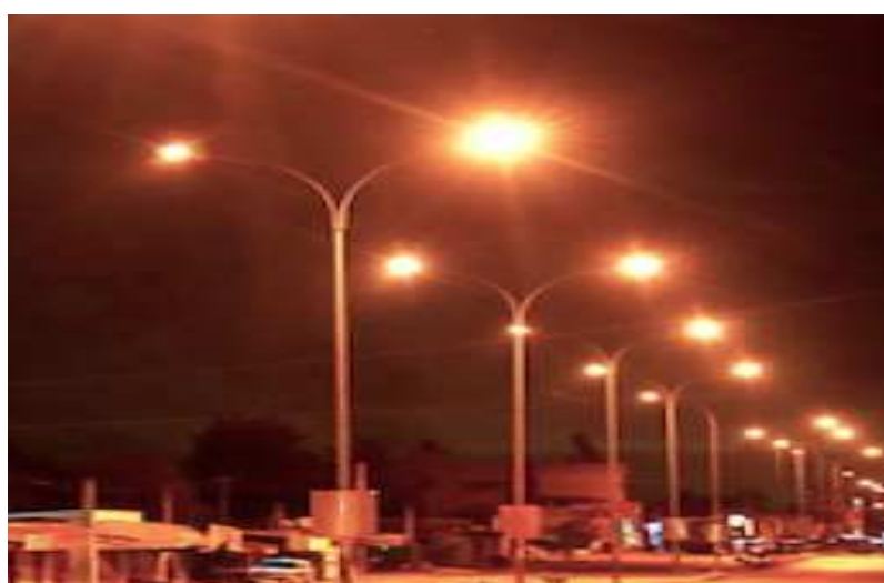
Le réseau électrique

Dans un communiqué rendu public, le projet appuiera des activités pour accélérer le déploiement de systèmes solaires autonomes dans une région, dont 50 % de la population n'a pas accès à l'électricité, et moins de 3 % de ses habitants utilisent ce type de technologies novatrices. Il s'attachera à développer le marché régional en