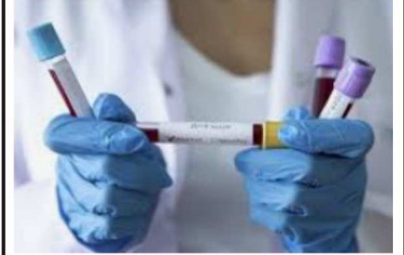
Le Togo a enregistré 600 cas de contamination au covid-19 en une semaine.