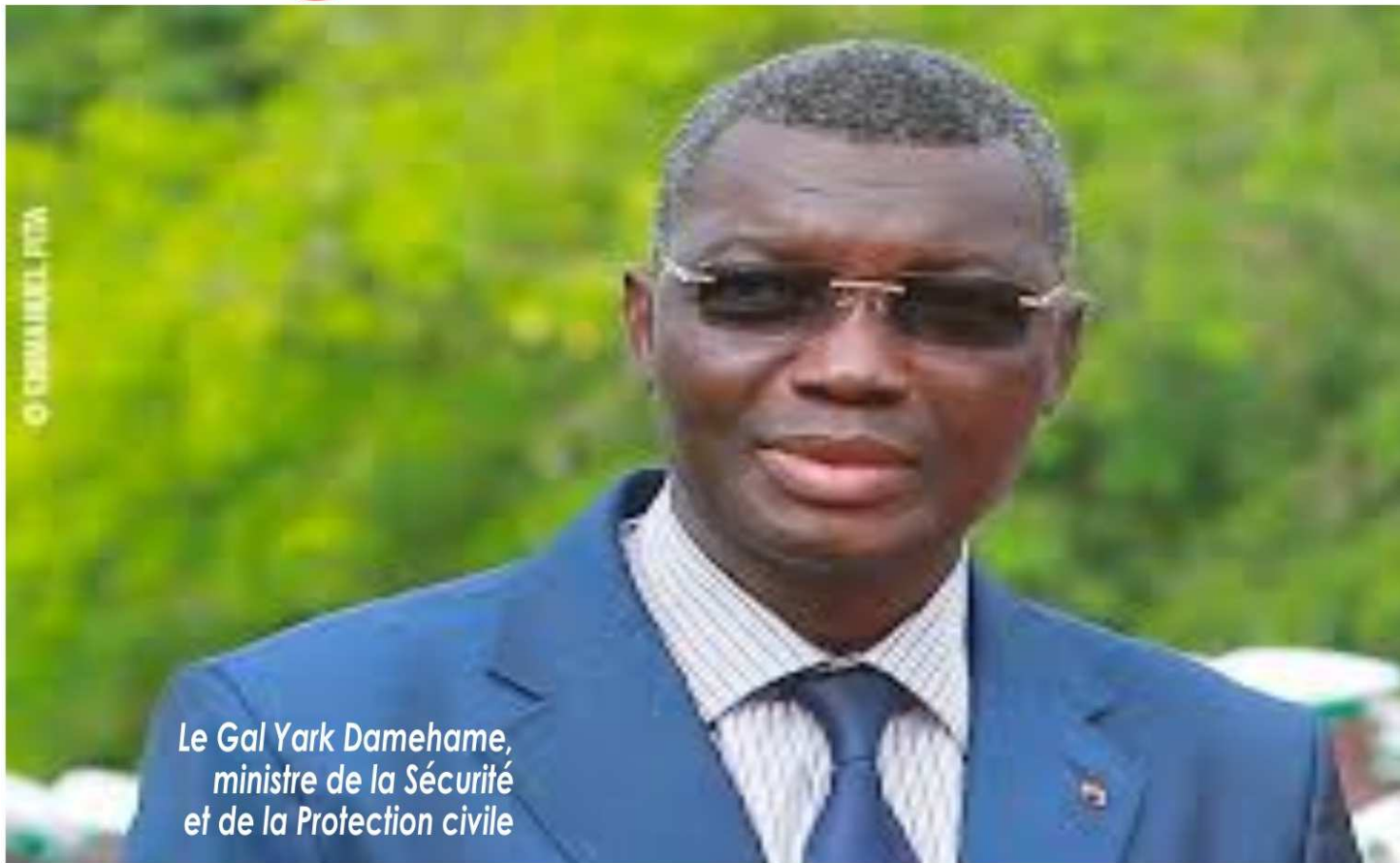
Le Gal Yark Damehame, ministre de la Sécurité et de la Protection civile

YARK accule les bandits de grands chemins P.3