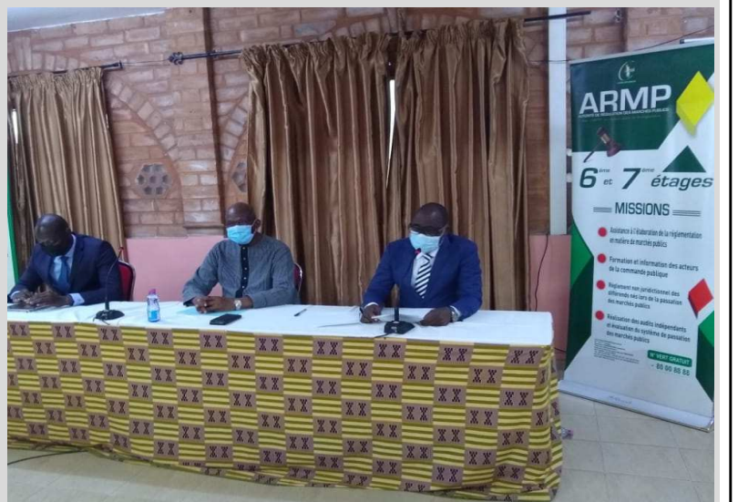
La table d'honneur

A l'ouverture des travaux, le directeur général de l'ARMP, Aftar Touré Morou a laissé entendre que " connecter la commande publique au métier de journalisme est une nécessité pour renforcer les capacités sur le contrôle citoyen des marchés publics et apprendre aux médias en tant qu'opérateur économique, les opportunités d'affaires