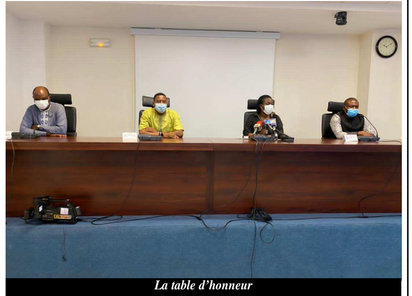
La table d'honneur

Les œuvres éligibles sont celles produites et publiées entre le 1er janvier et le 18 juin 2021. Le dépôt se fait sous pli-fermé au plus tard le 18 juin 2021 à 12 heures 30 min au siège social de l'OTM sis au quartier Bè-Klikamé à Lomé. Deux lauréats de chaque catégorie seront désignés par un jury composé de professionnels expérimentés des médias, de la communication, d'universitaires désignés par l'OTM en collaboration avec l'OTR. Le premier de chaque catégorie sera