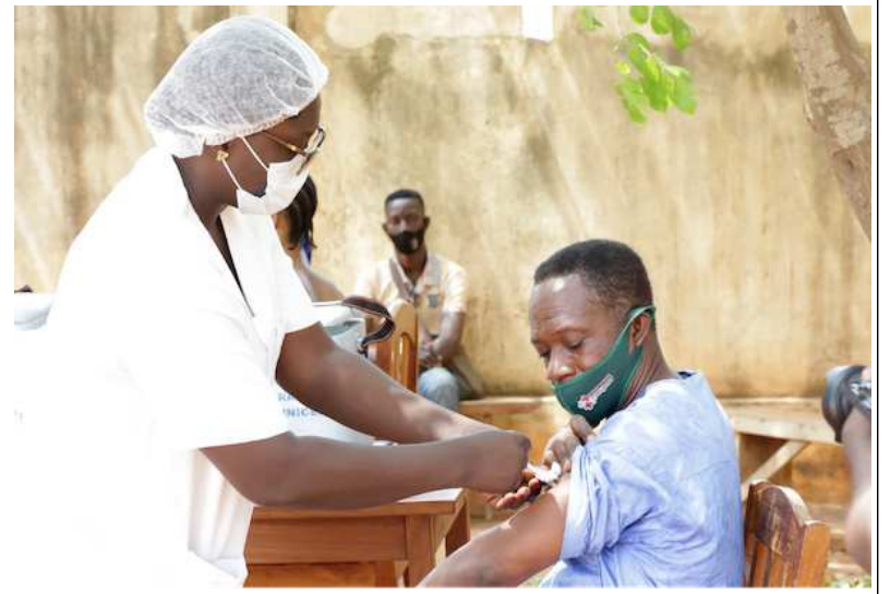
Une campagne de vaccination

La stratégie vaccinale du Togo demeure la même, vacciner le plus