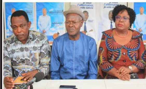
Les leaders de la DMK