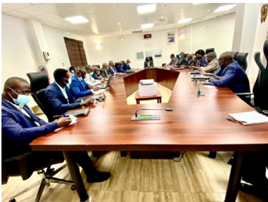
Rencontre entre la délégation bissau-guinéenne et des cadres de l'OTR

Plusieurs séances de travail ont été organisées sur la législation, l'organisation et le fonctionnement des unités avec la délégation Bissau-Guinéenne.