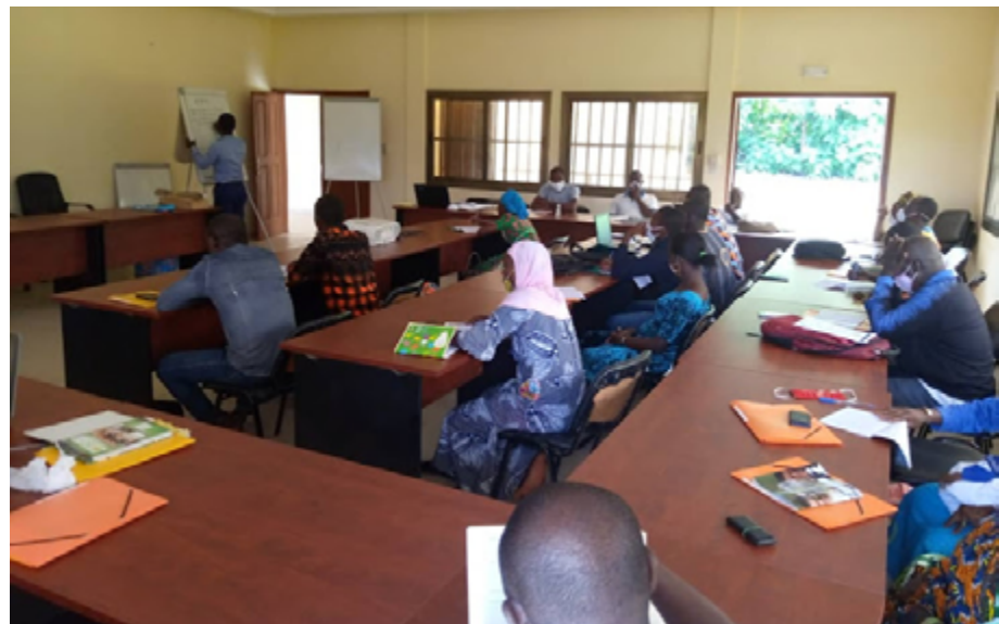
Session de formation dans le cadre du PSMICO le 15 juillet à Djarkpanga

Le Programme de soutien aux microprojets d'infrastructures communautaires (PSMICO) vise à accompagner le processus de mise en place et de gestion des infrastructures socio collectives des