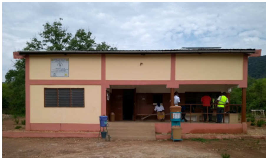
L'Unité de Soins Périphérique (USP) d'Agbamassomou, réhabilité par l'ANADEB.

centres communautaires de Banda, équipé et alimenté par un forage, a coûté 35 521 538 francs CFA.