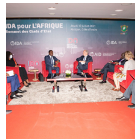
Le Président de la République à l' IDA 20 le 15 juillet