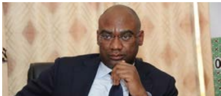
Professeur Dodzi Komla Kokoroko

Beaucoup d'observateurs ont déjà surnommé le professeur Dodzi Komla Kokoroko, le « champion des notes de services et des grandes décisions ». Le ministre des Enseignements primaire, secondaire, technique et de l'Artisanat depuis sa nomination a déjà rendu publiques plusieurs notes de services et auxquelles les acteurs de l'éducation doivent se plier. Ce sont visiblement des ballons d'essais, puisque, le professeur Kokoroko, malgré sa bonne volonté, sait qu'il ne sera pas facile de changer de vieilles habitudes du jour au lendemain.