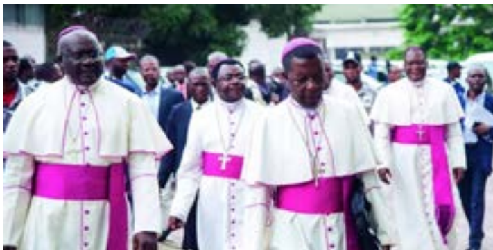
Des évêques en RDC

religieuses considèrent que, sur le plan éthique et de l'indépendance, les griefs (informations et allégations) contre deux candidats de la liste (les meilleurs sur le plan technique) affectent leur indépendance et leur crédibilité », peut-on y lire. Ces deux confessions ont donc demandé que les deux candidats en question soient écartés de la course, est-il indiqué sans autre précision. En revanche, les six autres confessions religieuses ont estimé que « les griefs relevés contre les deux candidats soit ne sont pas prouvés soit ne