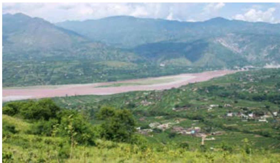
Aperçu de la préfecture autonome Yi de Liangshan

Le premier est "direction efficace". La direction du Parti communiste chinois est la garantie fondamentale de l'action nationale. Le président Xi Jinping fait de la lutte contre la pauvreté une priorité dans la gouvernance de l'État. Depuis 2015, il a convoqué sept réunions pour discuter de l'éradication de la pauvreté. Jusqu'en mars 2020, 255.000 équipes regroupant 2,9 millions de membres du Parti ont été envoyées dans les villages démunis pour diriger sur place les actions contre la pauvreté. Un régime de responsabilisation à cinq échelons, à savoir province, ville, district, bourg et village, a été mis en place pour assurer l'efficacité de l'application des politiques. Le deuxième est "mesure