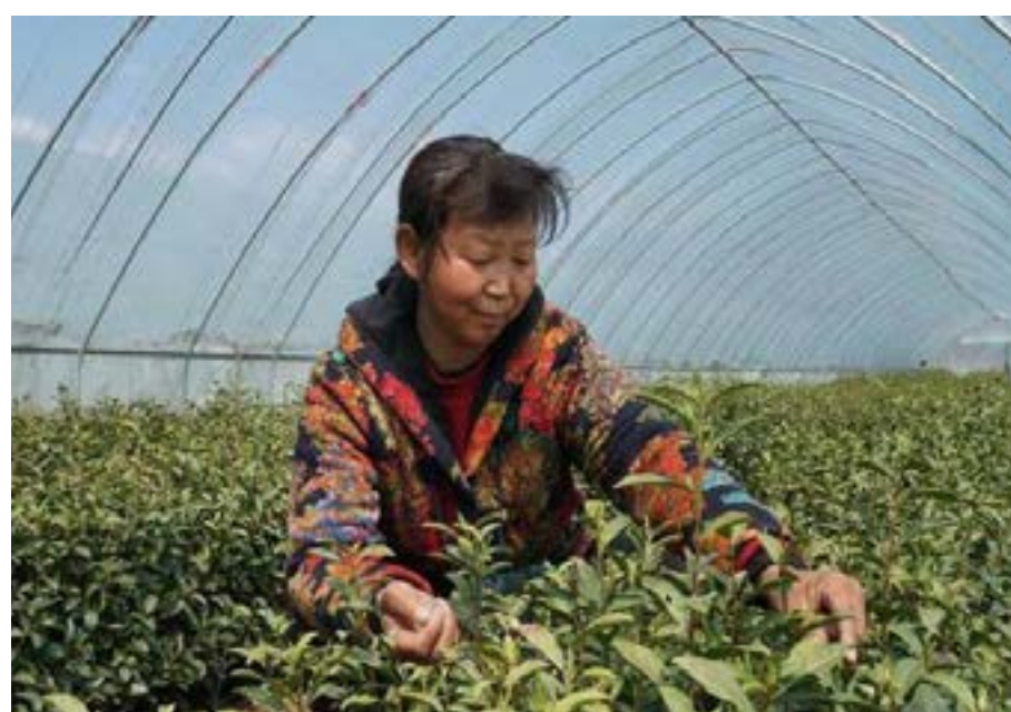
Une paysanne chinoise pratiquant l'agriculture

Années, les 98,99 millions d'habitants ruraux démunis qui vivaient encore sous le seuil de pauvreté actuel sont tous sortis de la pauvreté. L'ensemble des 832 districts et des 128.000 villages pauvres ont été retirés de la liste de la pauvreté. Depuis le lancement