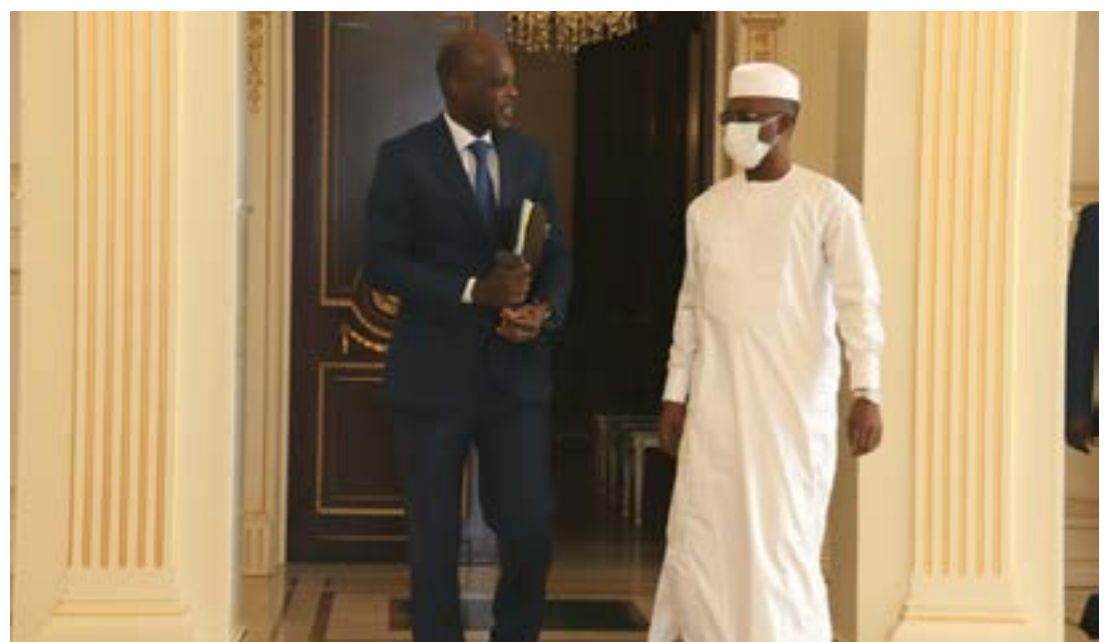
Professeur Robert Dussey (à gauche) et le général Mahamat Idriss Deby Itno à la sortie d'audience

« J'ai été porteur d'un message du président de la République togolaise, le président Faure Gnassingbé, qui a souhaité que nous puissions discuter avec le président de la transition et surtout l'encourager pour l'effort qu'il est en train de faire afin de préserver la