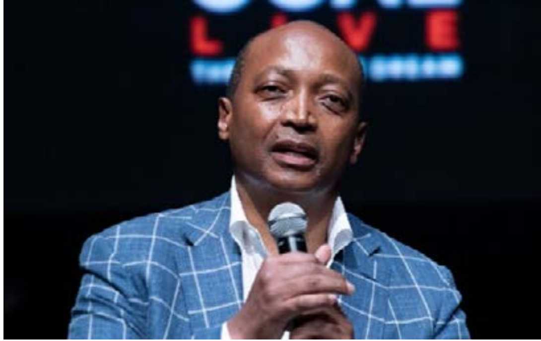
Patrice Motsepe, nouveau président de la CAF

Depuis le 12 mars 2021, le siège de la présidence de la Confédération africaine de football (CAF) a un nouvel occupant. Le Sud-africain Patrice Motsepe a été élu, par acclamation, président de la CAF lors de la 43e Assemblée générale de la Confédération africaine de football (CAF) à Rabat au Maroc. Au sortir de cette élection où il a été seul candidat en lice, Patrice Motsepe l'homme au parcours diversifié, s'est prononcé sur ses ambitions à la tête de la fédération du football continental.