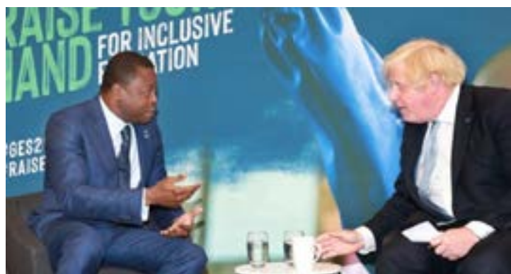
Faure Gnassingbé et Boris Johnson

Au cours de leur rencontre le 29 juillet dernier à Londres au Royaume-Uni, en marge du sommet mondial sur l'éducation, Faure Gnassingbé et Boris Johnson ont abordé différents sujets dont l'amélioration du climat des affaires au Togo. Cette amélioration du climat des affaires au Togo pourrait attirer des investisseurs britanniques.