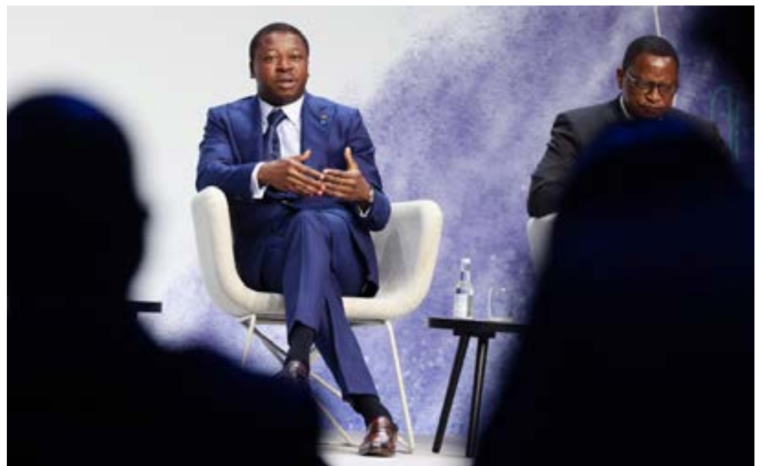
Faure Gnassingbé (à gauche)

« Face à cela, je pense qu'il faut promouvoir l'éducation inclusive, c'est-à-dire offrir aux familles des régions les plus défavorisées, la