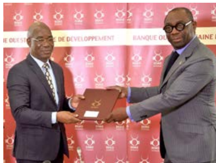
Echange de documents entre les deux parties

Il s'agira également pour les deux institutions de mobiliser des ressources pour le financement des études de faisabilité des projets