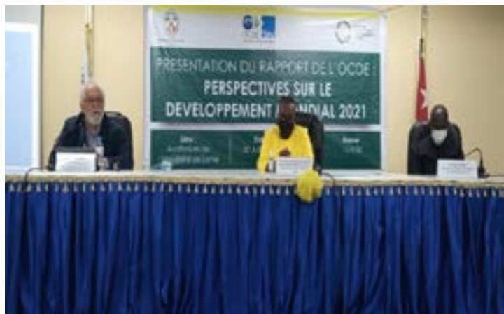
Table d'honneur de la présentation

Le développement mondial a été analysé, étudié, mesuré par l'Organisation de coopération et de développement économiques (OCDE). Dans un élan de vulgarisation, le temple du savoir l'Université de Lomé a accueilli, le 30 juillet 2021, la présentation du rapport de l'OCDE sur les perspectives sur le développement mondial 2021. Il s'est agi pour l'OCDE, en collaboration avec le gouvernement togolais par le truchement de son ministère du Développement à la base, d'aider la jeune tête pensante togolaise, les chercheurs et les professionnels, de connaître le contenu du rapport et de savoir lire entre les lignes du présent rapport.